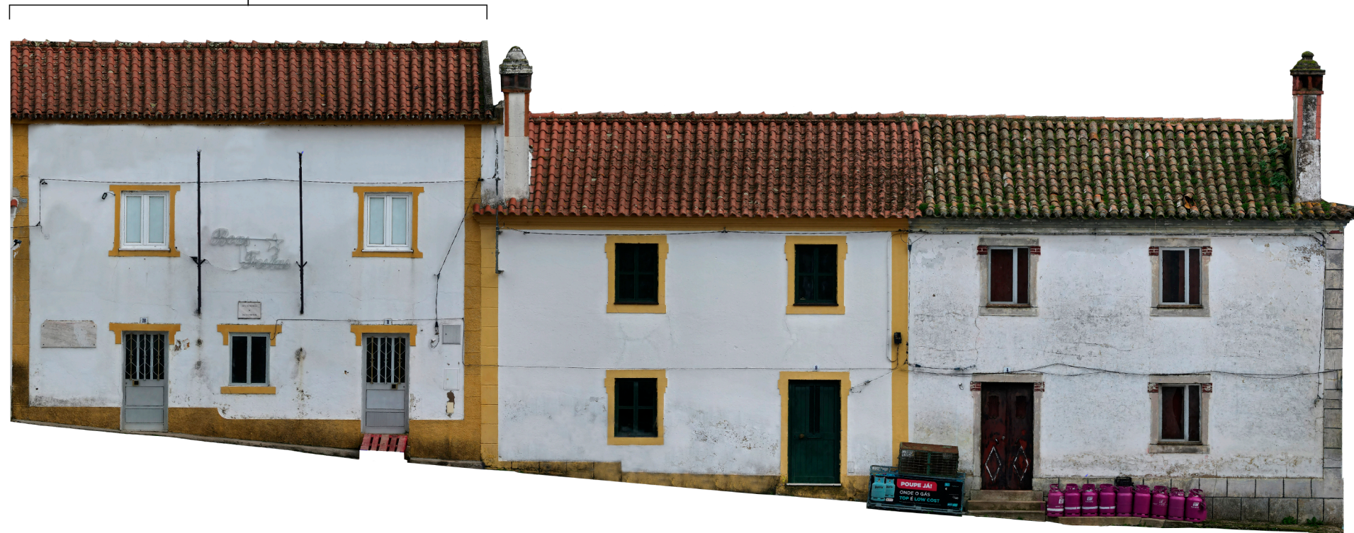
Edifício Junta de Freguesia