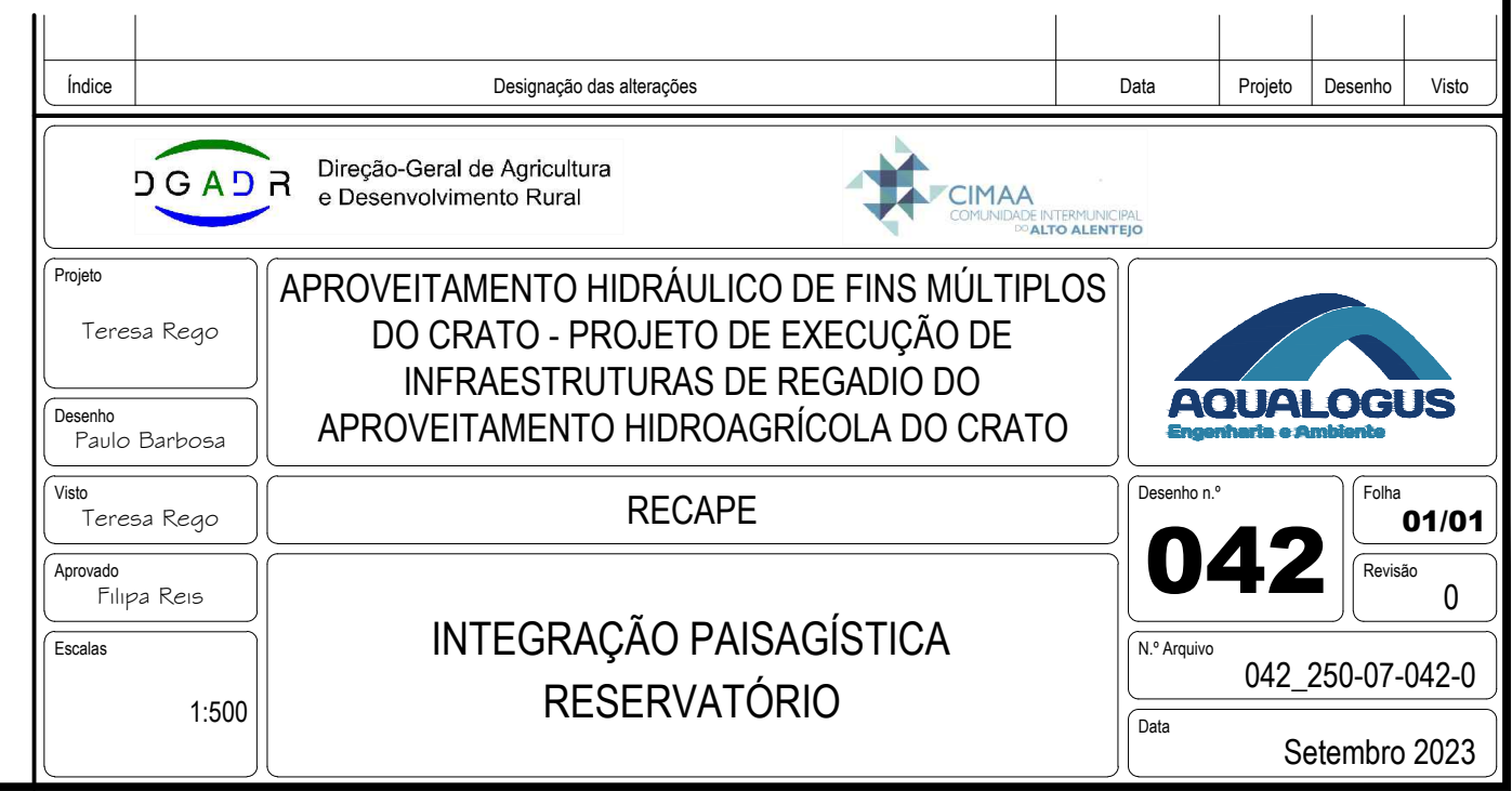
PLANTA Esc. 1:500

ESTE DESENHO NÃO PODE SERVIR DE BASE À EXECUÇÃO DA OBRA SEM O VISTO DO DONO DA OBRA OU SEU REPRESENTANTE COMO "BOM PARA EXECUÇÃO"