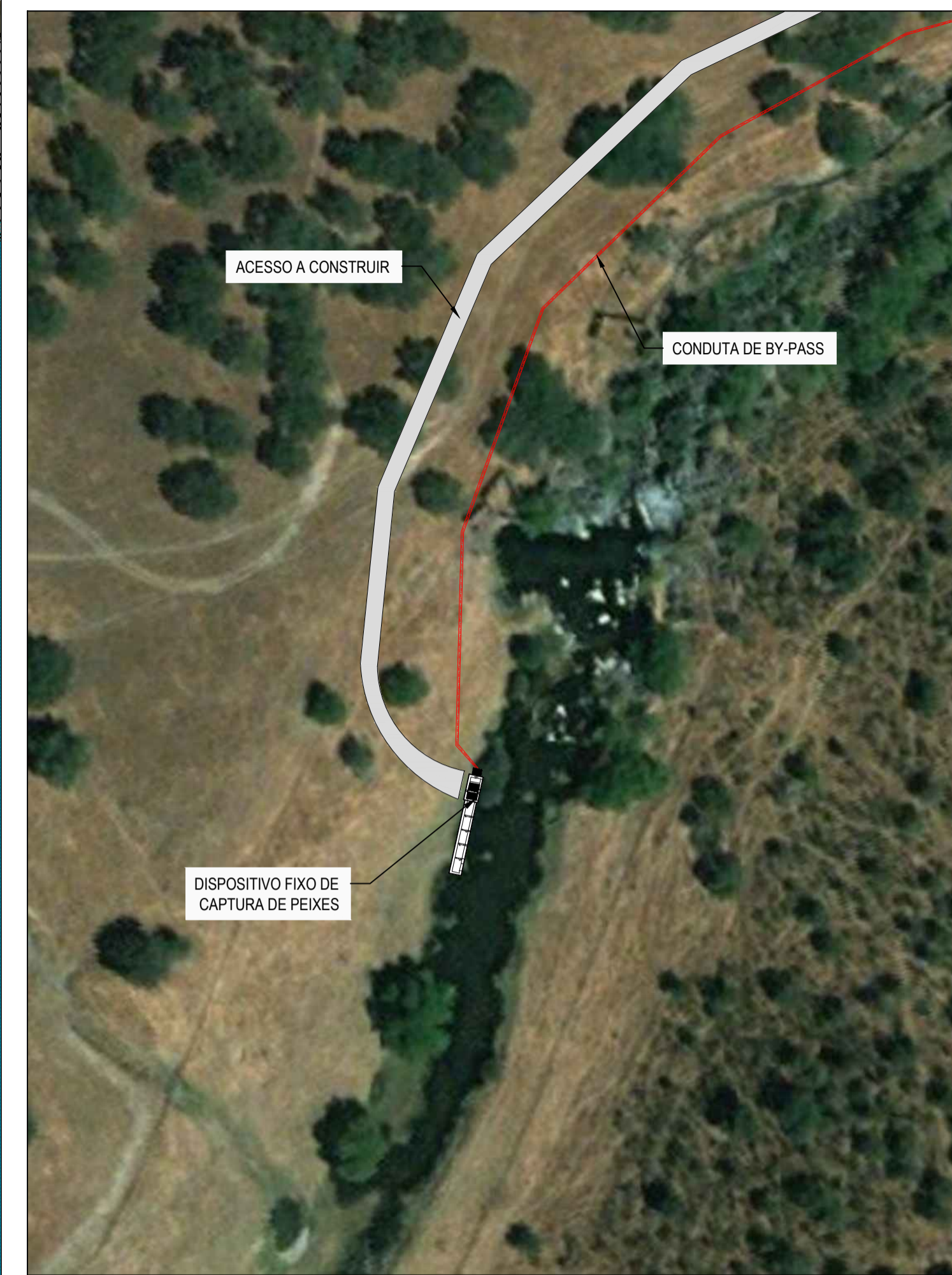
PORMENOR Esc. 1:1000

ESTE DESENHO NÃO PODE SERVIR DE BASE À EXECUÇÃO DA OBRA SEM O VISTO DO DONO DA OBRA OU SEU REPRESENTANTE COMO "BOM PARA EXECUÇÃO"