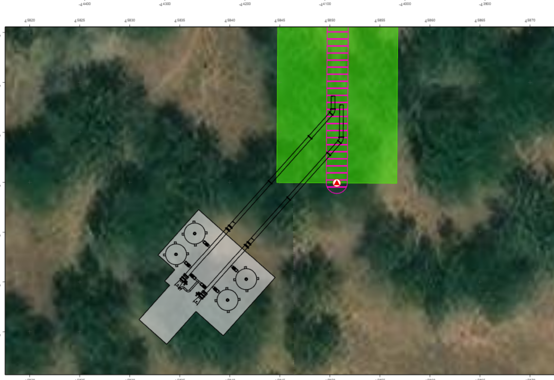
0 25 50 100 m Base cartográfica - Maxar, Microsoft. Sistema de Coordenadas: ETRS 1989 Portugal TM06