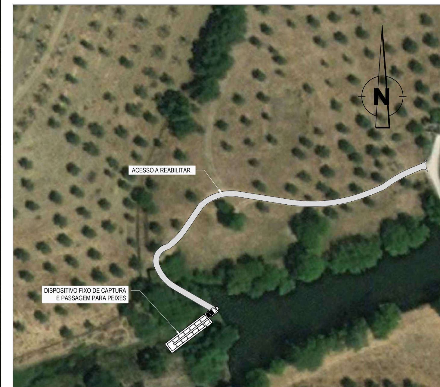
PORMENOR Esc. 1:1000

ESTE DESENHO NÃO PODE SERVIR DE BASE À EXECUÇÃO DA OBRA SEM O VISTO DO DONO DA OBRA OU SEU REPRESENTANTE COMO "BOM PARA EXECUÇÃO"