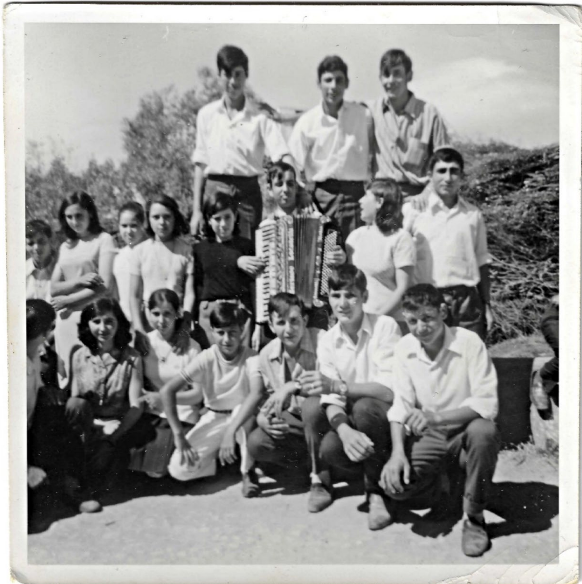
Figura 27 – Grupo de jovens, anos 1960/1970.