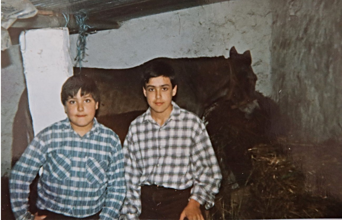
Figura 95 – Burro, anos 1980/90.