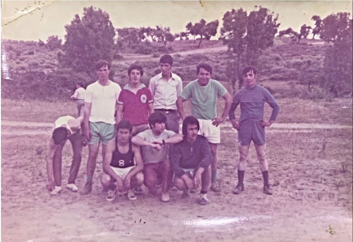
Figura 57 – Jogo de futebol, anos 1960/1970.