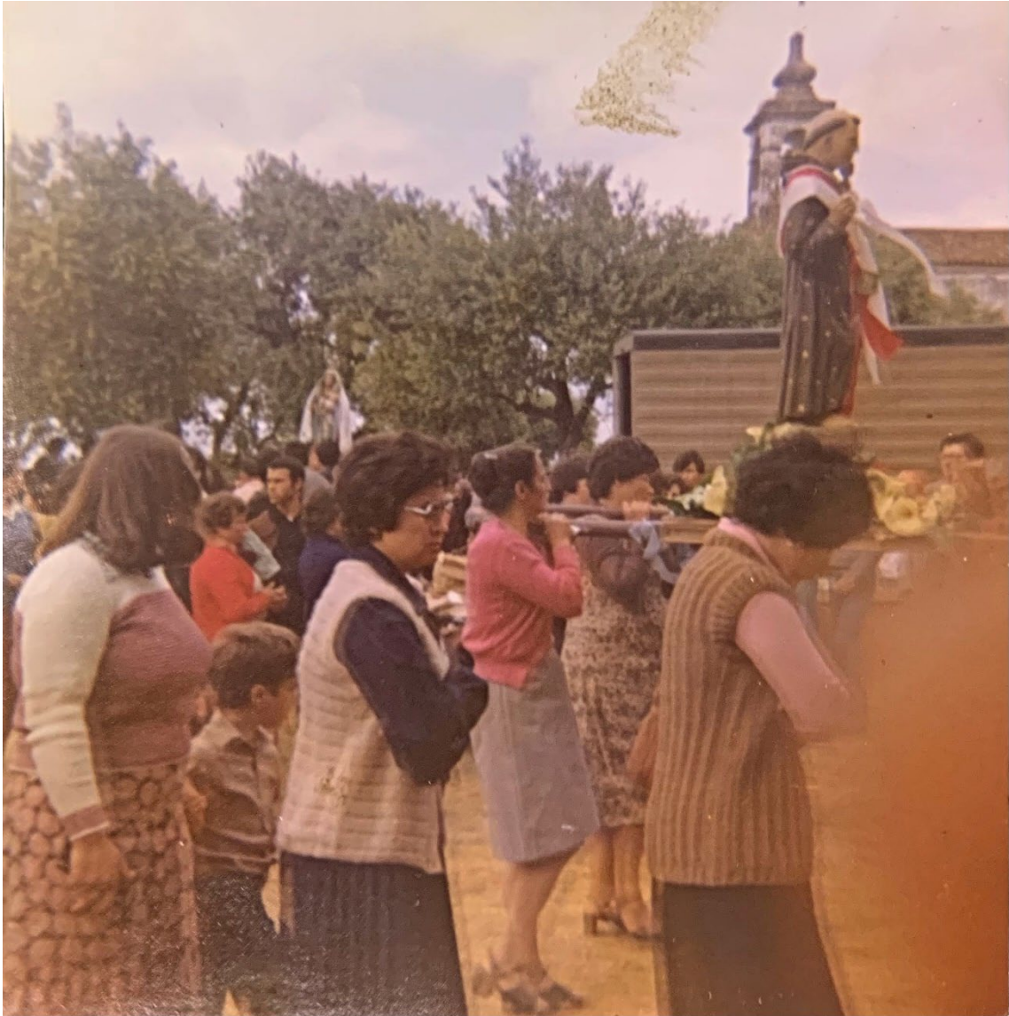
Figura 51 – Procissão em honra de Nossa Senhora dos Mártires, anos 1970/1980.