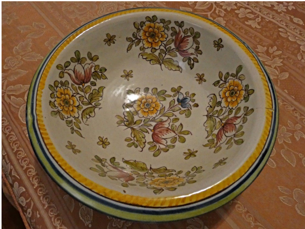
Figura 76 – Bacia de lavatório, século XX.