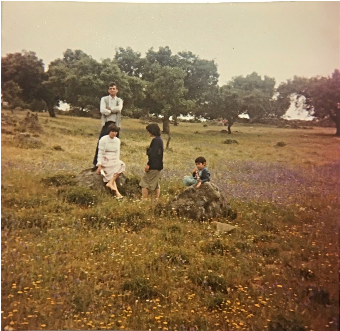
Figura 42 – Família nos Mártires, anos 1970/1980.