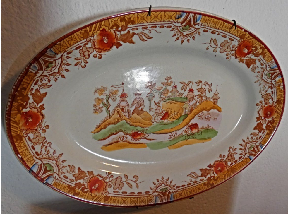
Figura 81 – Travessa de faiança da Fábrica de Sacavém, 1905-1973.