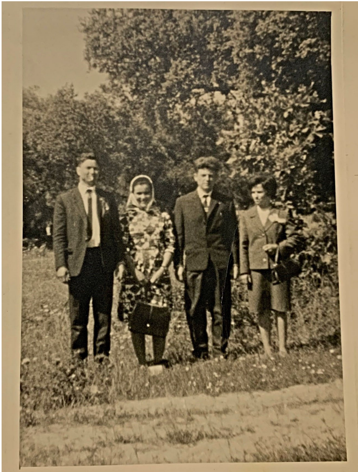
Figura 39 – Casais nos Mártires, anos 1960/70.