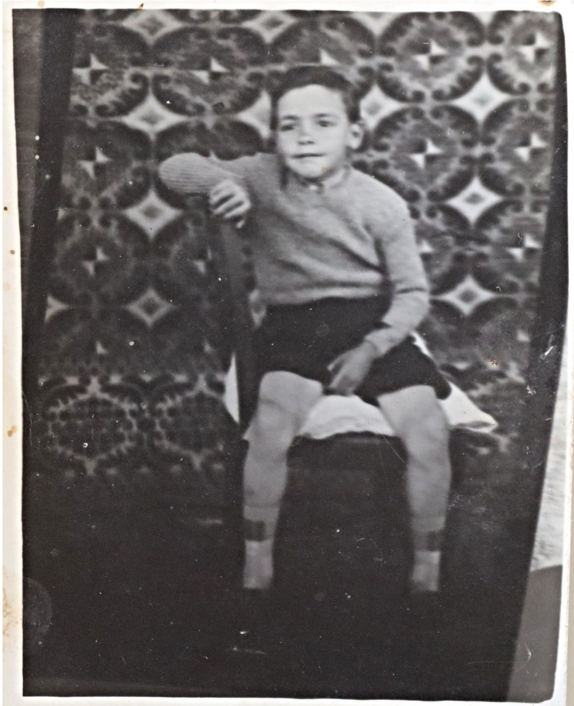
Figura 8 – Criança nos anos 1960/1970.