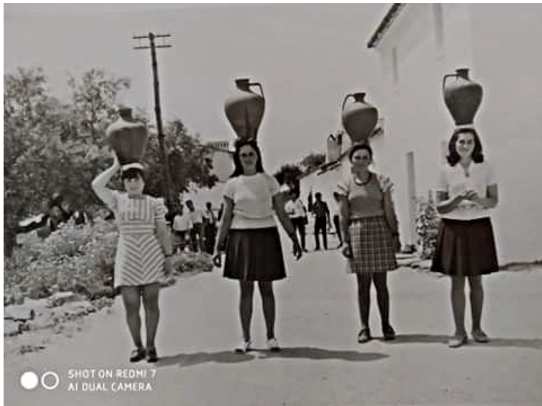
Figura 55 – Corrida de cântaros, anos 1950/1960.