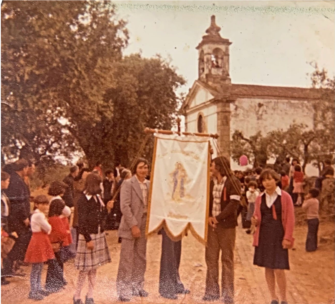
Figura 49 – Procissão em honra de Nossa Senhora dos Mártires, anos 1970/1980.