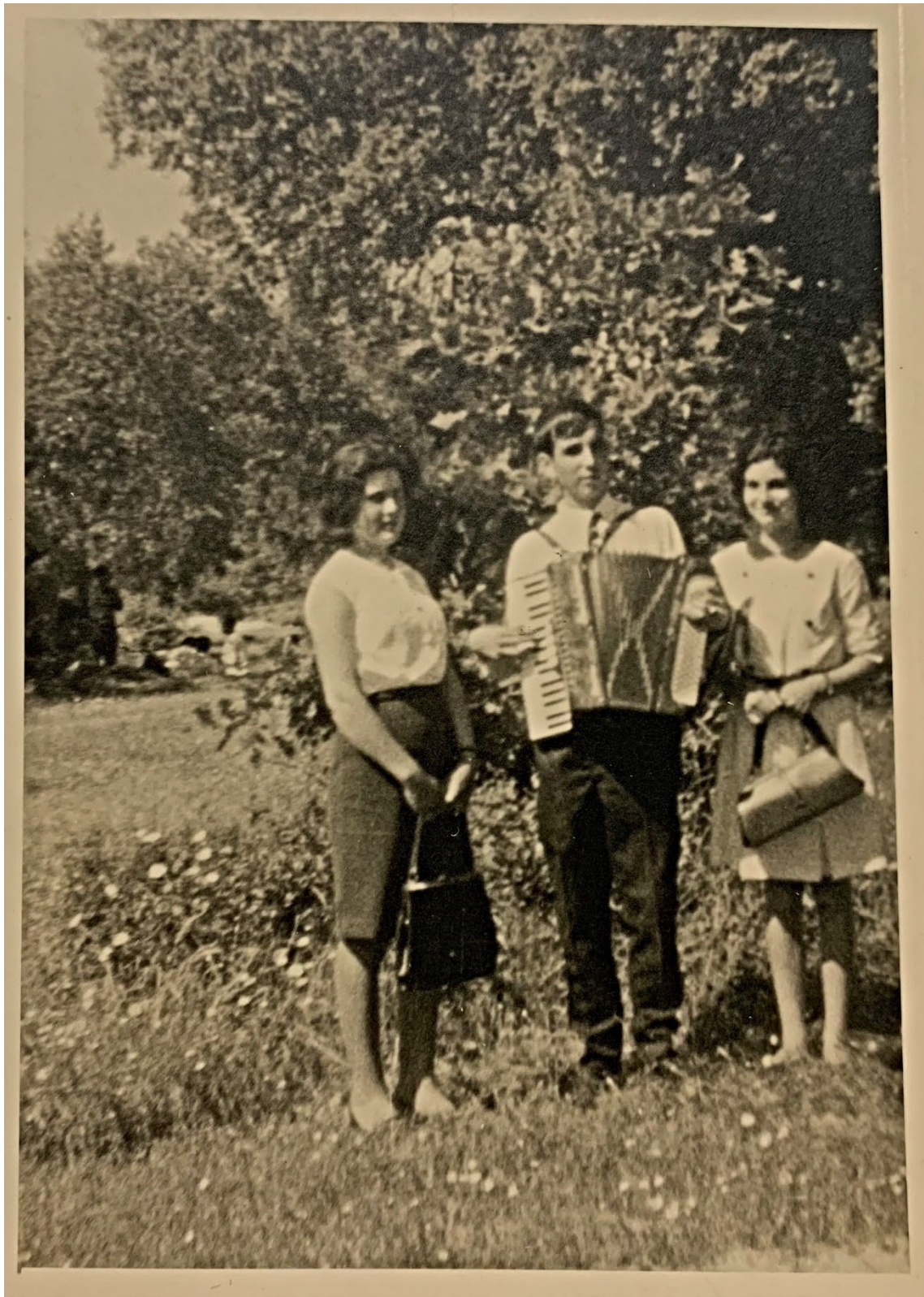
Figura 38 – Grupo de jovens nos Mártires, anos 1960/1970.