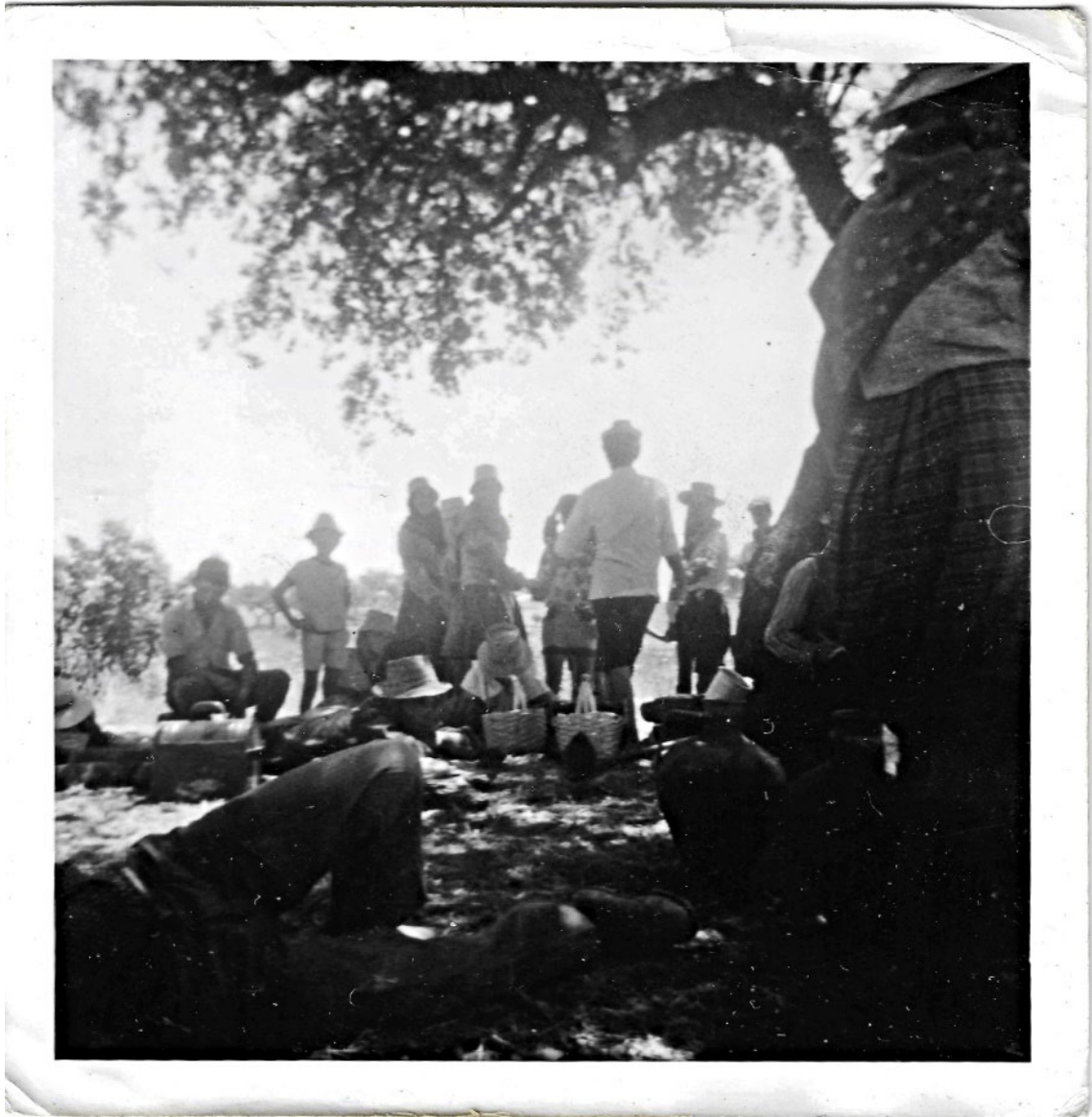
Figura 73 – Grupo de jovens a cantar e bailar, anos 1950/1970.