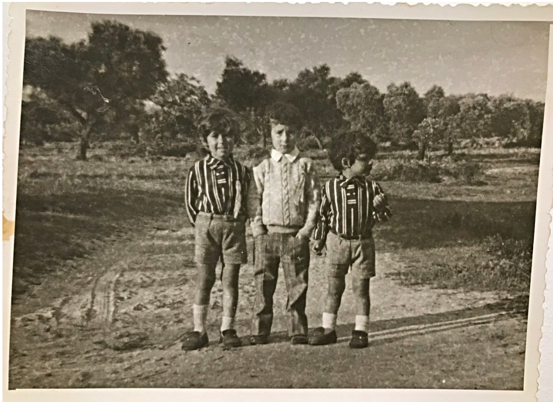
Figura 40 – Grupo de crianças nos Mártires, anos 1960/1970.