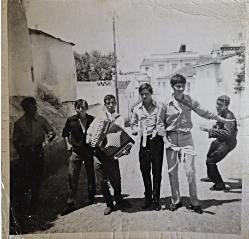
Figura 68 – Grupo de jovens do Pisão tocando acordeão e bailando pelas ruas do Crato, anos 1960/1970.