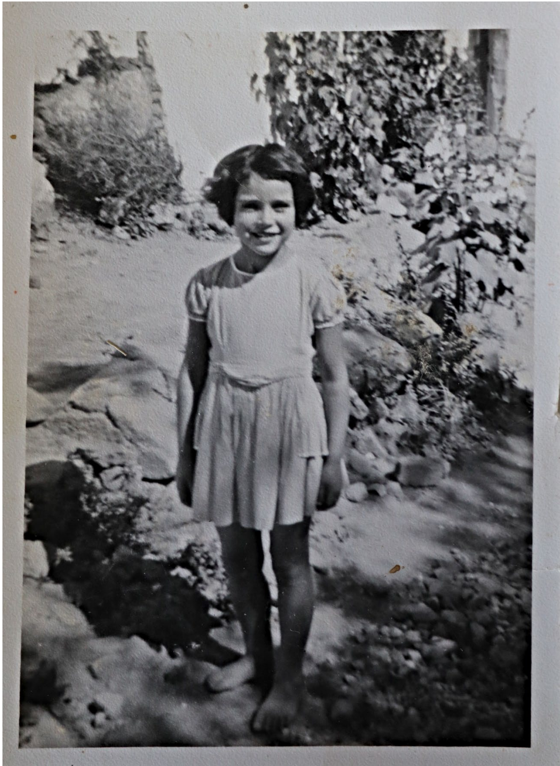
Figura 6 – Menina nos anos 1960/1970.