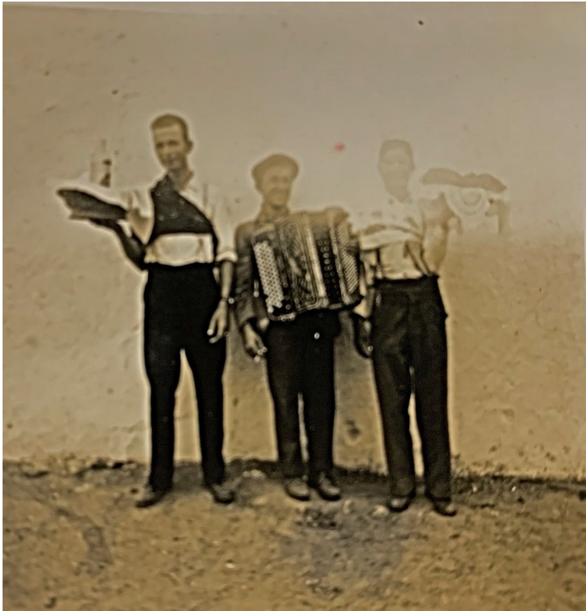
Figura 66 – Homens nas corridas das fogaças, anos 1940/1950.