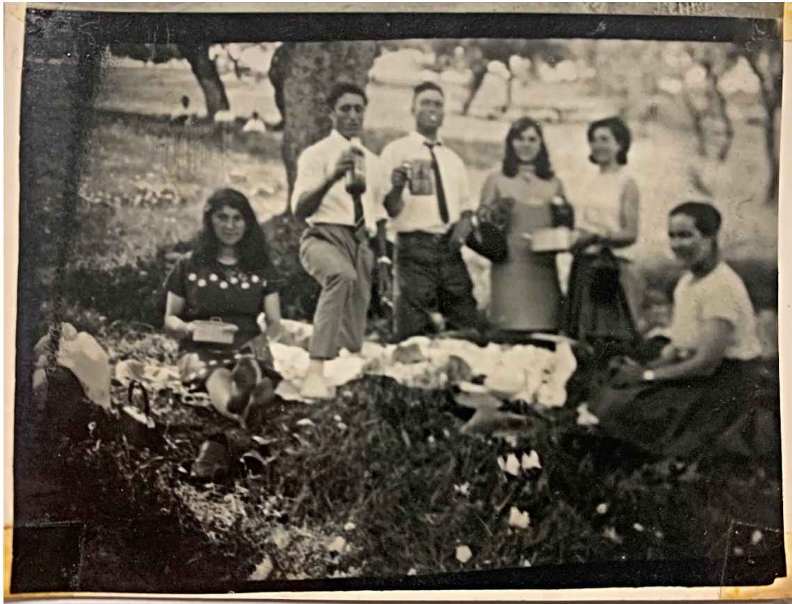
Figura 35 – Grupo de jovens merendando nos Mártires, anos 1960/70.