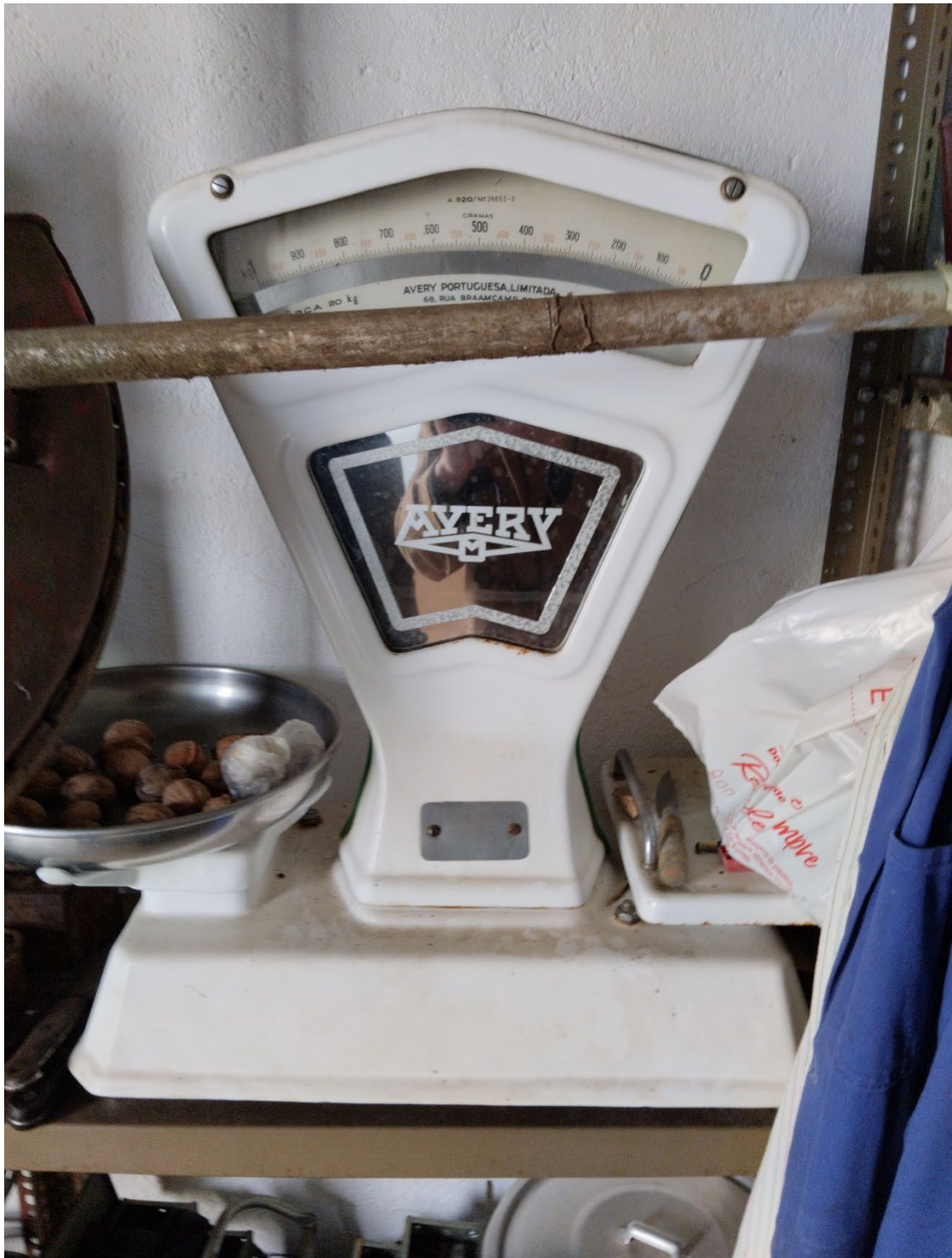
Figura 102 – Balança Avery, meados do século XX.