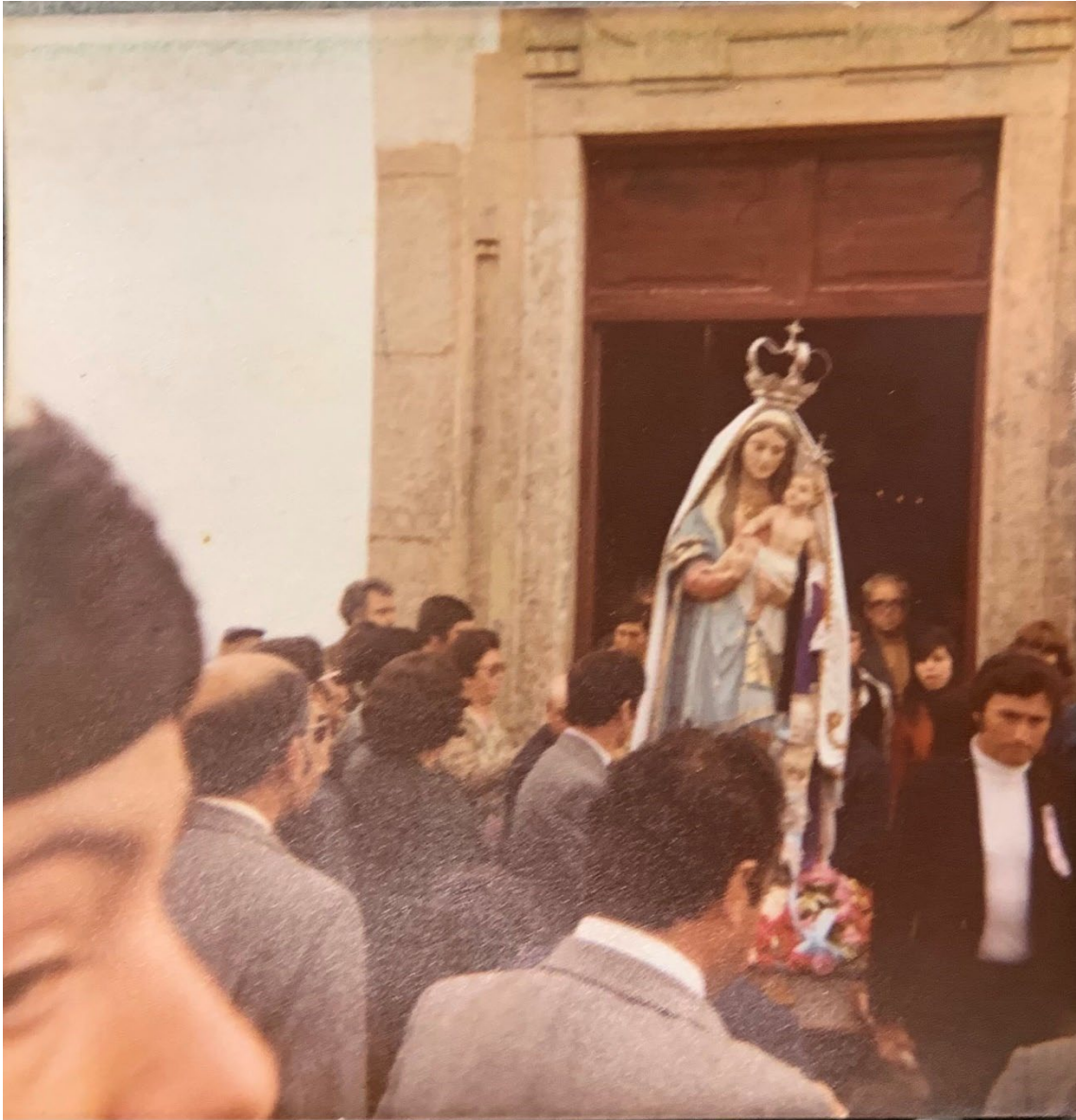
Figura 48 – Procissão em honra de Nossa Senhora dos Mártires, anos 1970/1980.