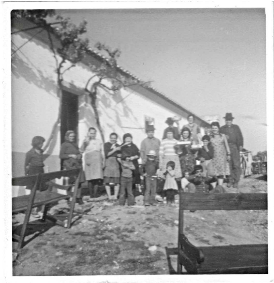
Figura 16 – Família no Pisão, meados do século XX.