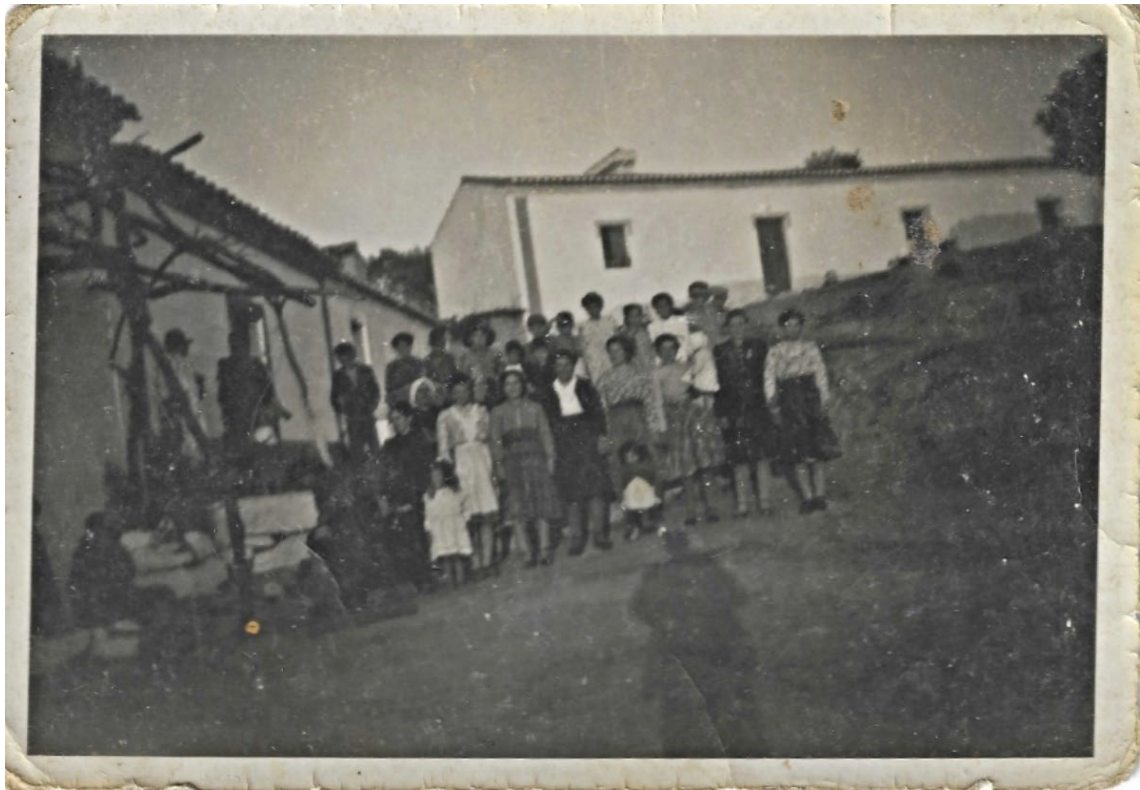
Figura 17 – Família no Pisão, meados do século XX.