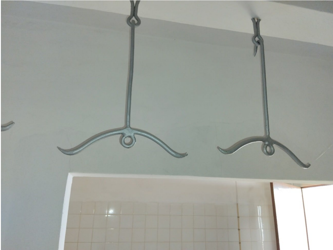
Figura 100 – Peças para pendurar os porcos, antiga salsicharia do Pisão.