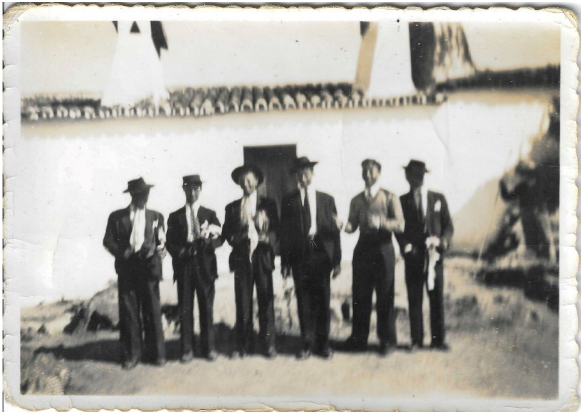
Figura 71 – Rapazes vindos do sorteamento (inspeção médica para serviço militar), anos de 1950.