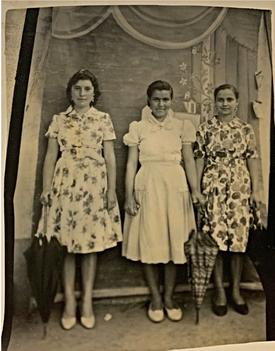
Figura 24 – Grupo de mulheres, meados do século XX.