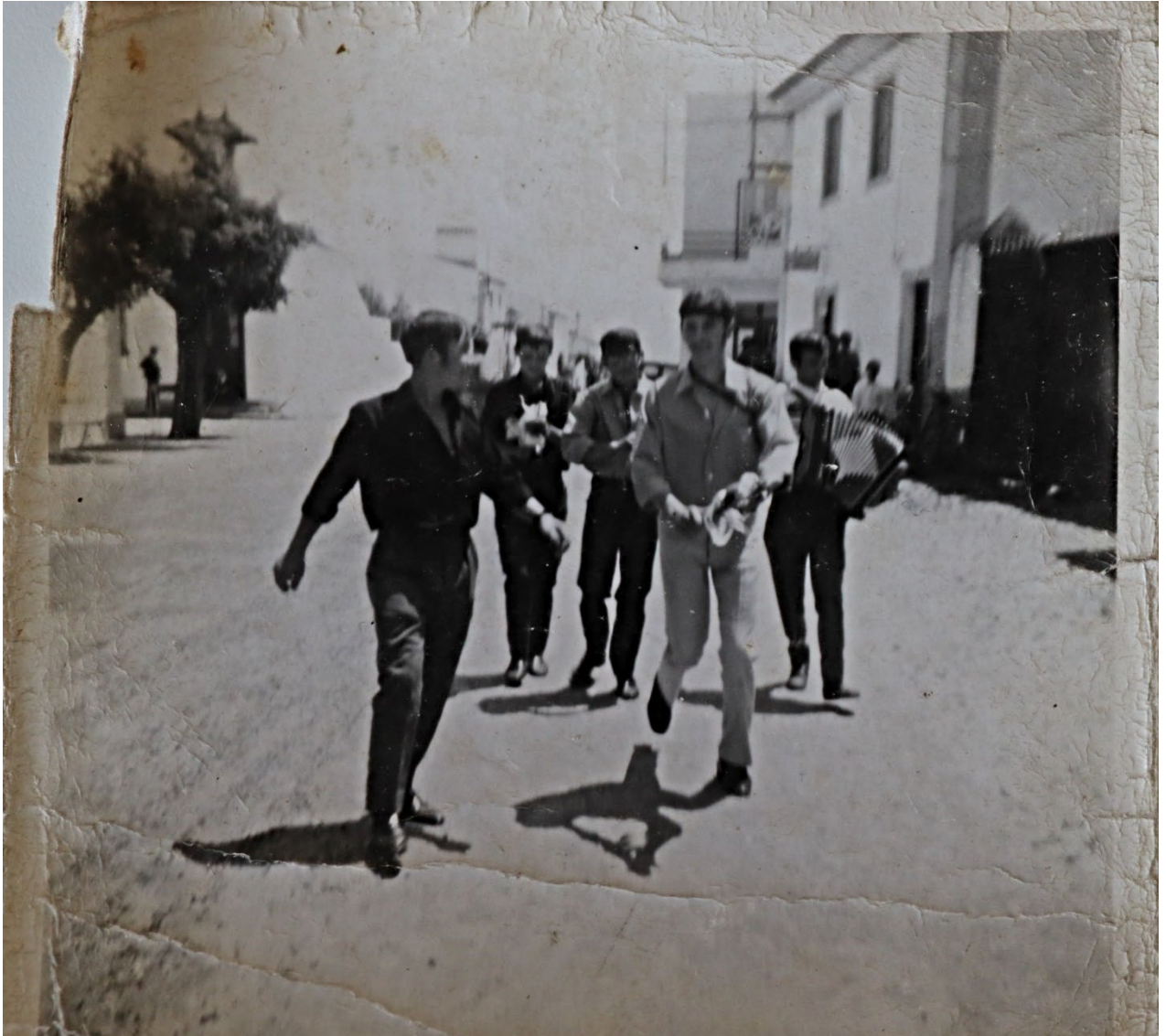
Figura 69 – Grupo de jovens do Pisão tocando acordeão e bailando pelas ruas do Crato, anos 1960/1970.