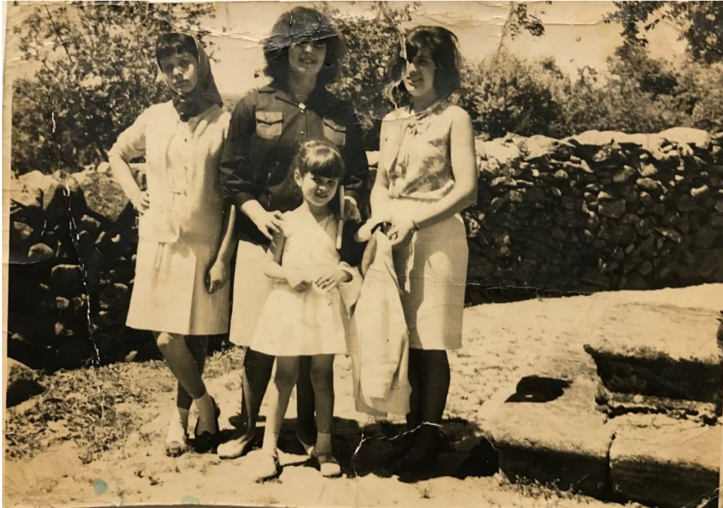
Figura 36 – Grupo de mulheres nos Mártires, anos 1960/70.