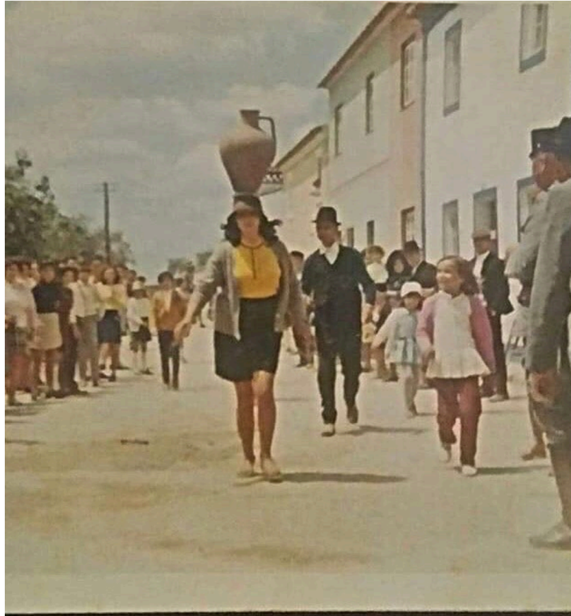
Figura 54 – Corrida de cântaros, anos 1950/1960.