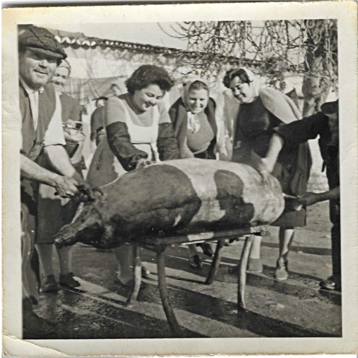
Figura 88 – Matança do porco, anos 1960.