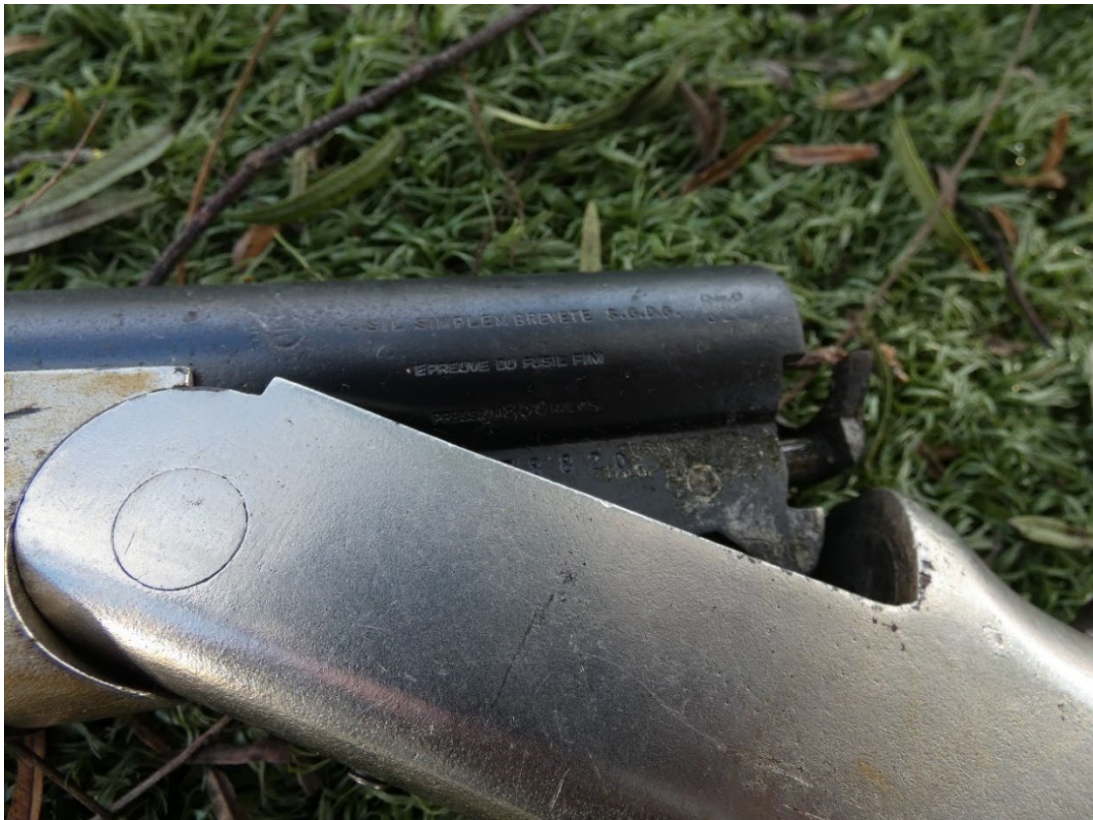
Figura 98 – Pormenor espingarda Saint-Etienne Fusil Simplex reveté S-G-D-G, da 1ª metade do séc. XX.