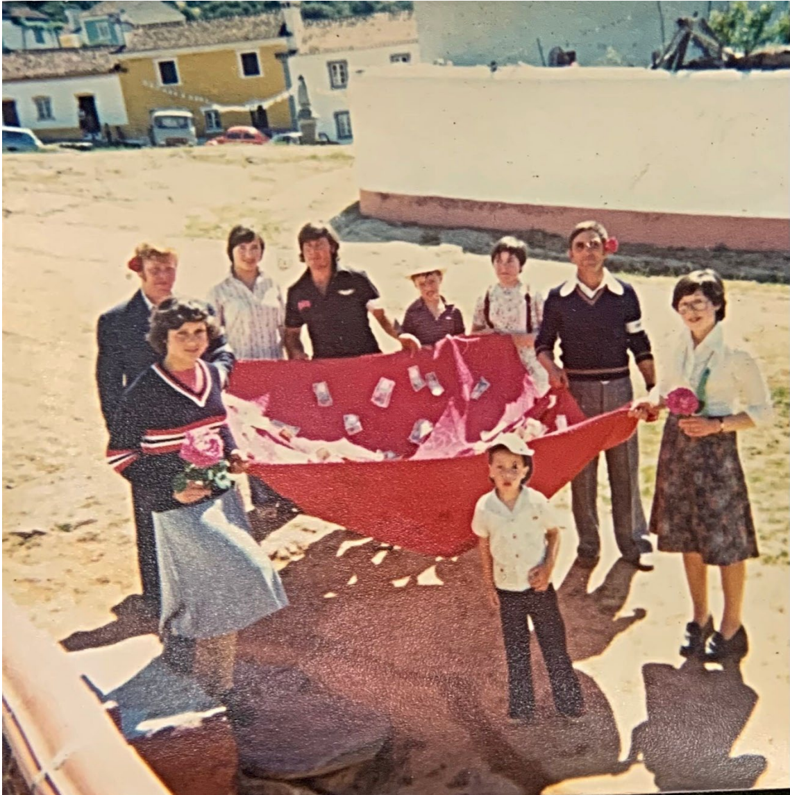
Figura 31 – Peditório na manhã de sábado da Festa de Nossa Senhora dos Mártires, anos 1970/80.