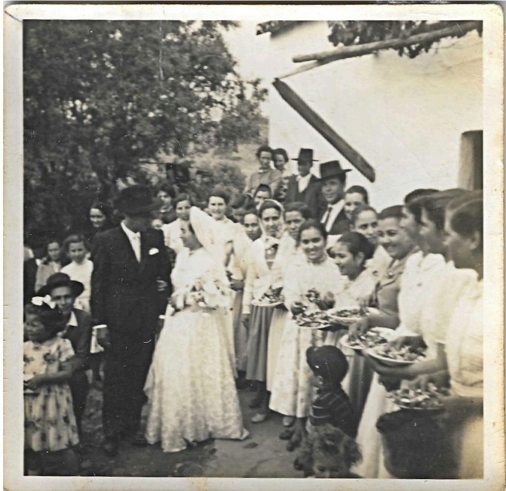
Figura 59 – Casamento, anos 1950.