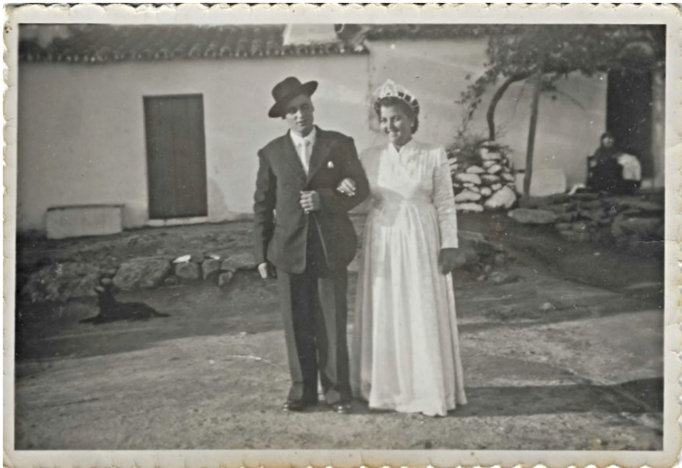
Figura 60 – Casamento, anos 1950.