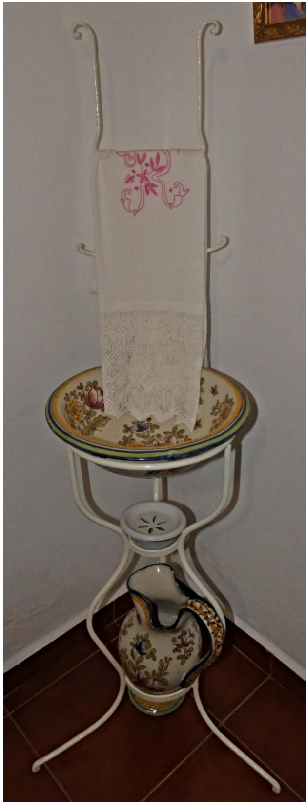
Figura 75 – Lavatório, século XX.