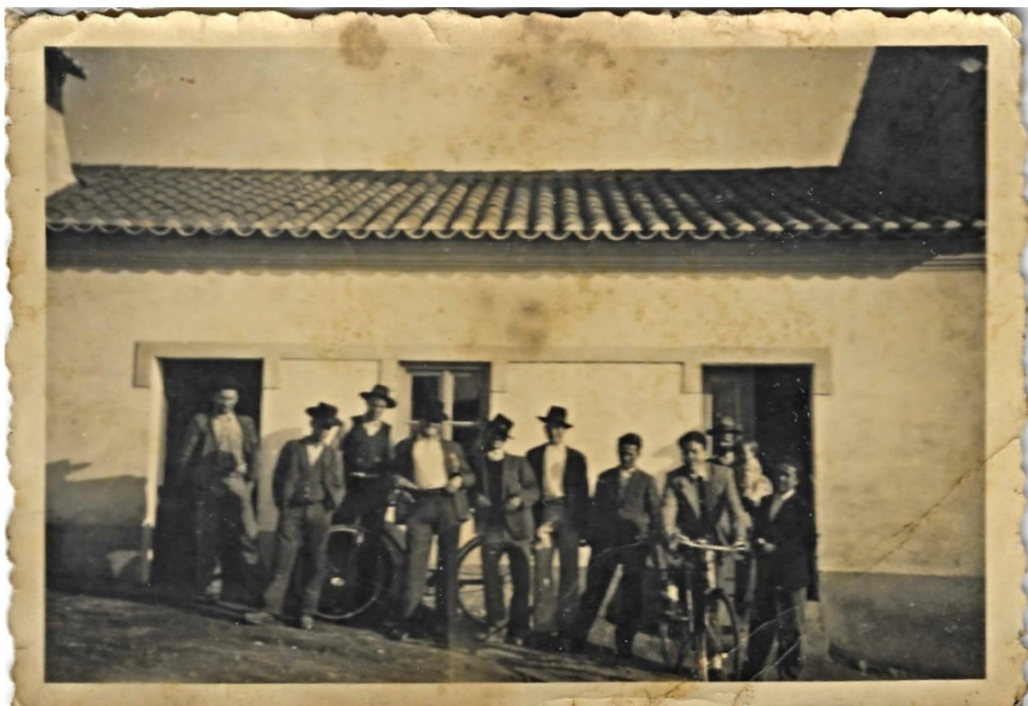
Figura 18 – Grupo de homens, meados do século XX.