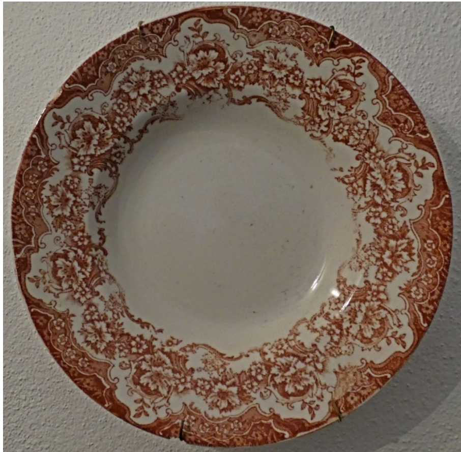
Figura 78 – Prato de faiança da Fábrica de Alcântara, 1885-1935.