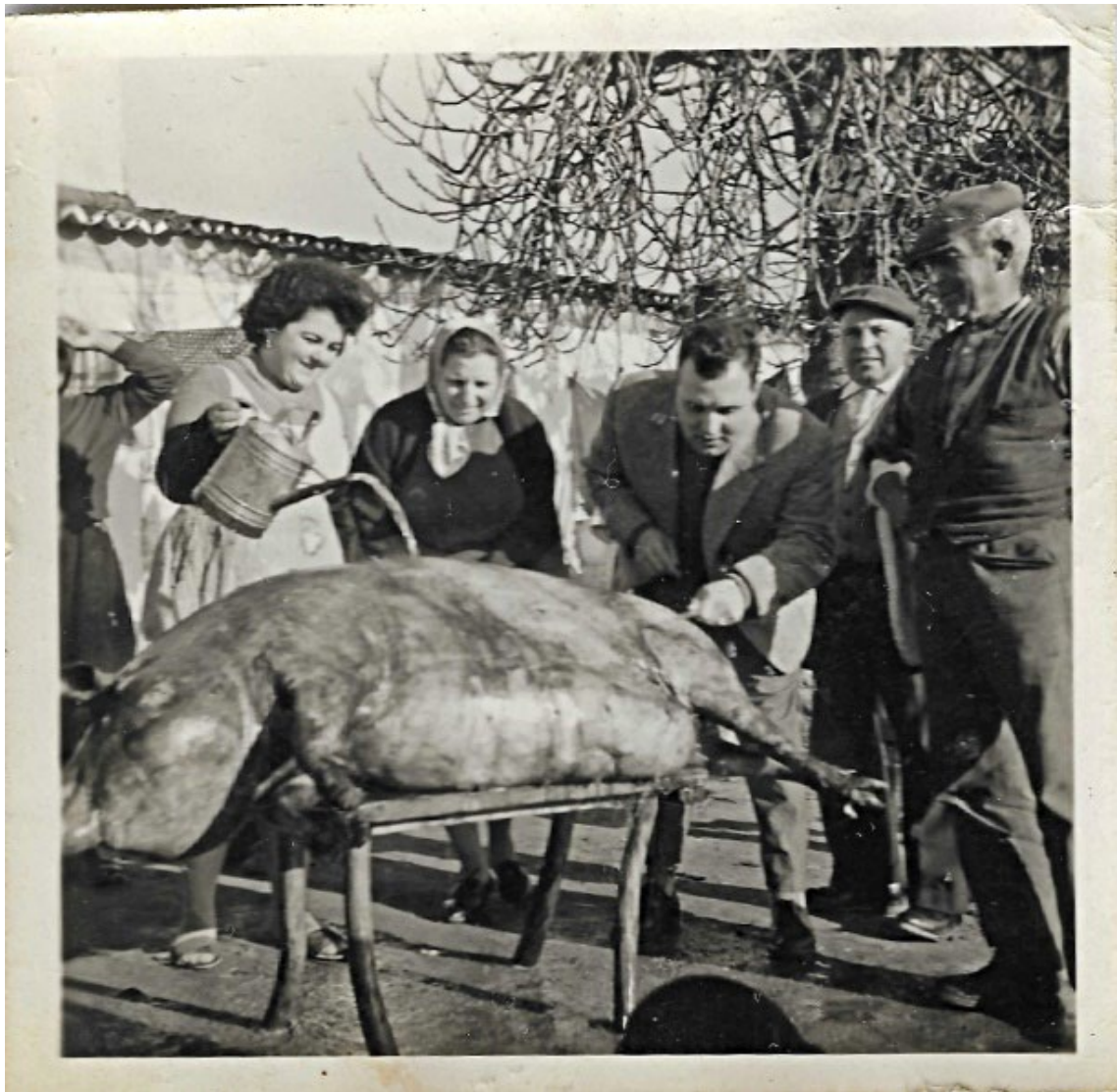
Figura 87 – Matança do porco, anos 1960.

Fotografias de objectos dos inícios e meados do século XX