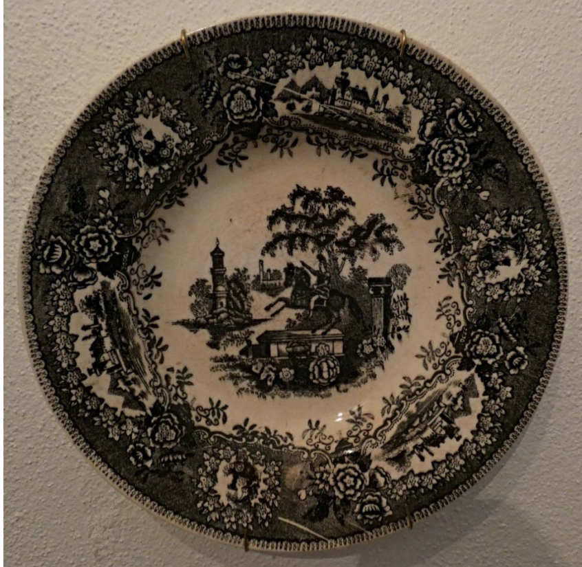
Figura 85 – Prato de faiança da Fábrica de Sacavém, 1905-1973.