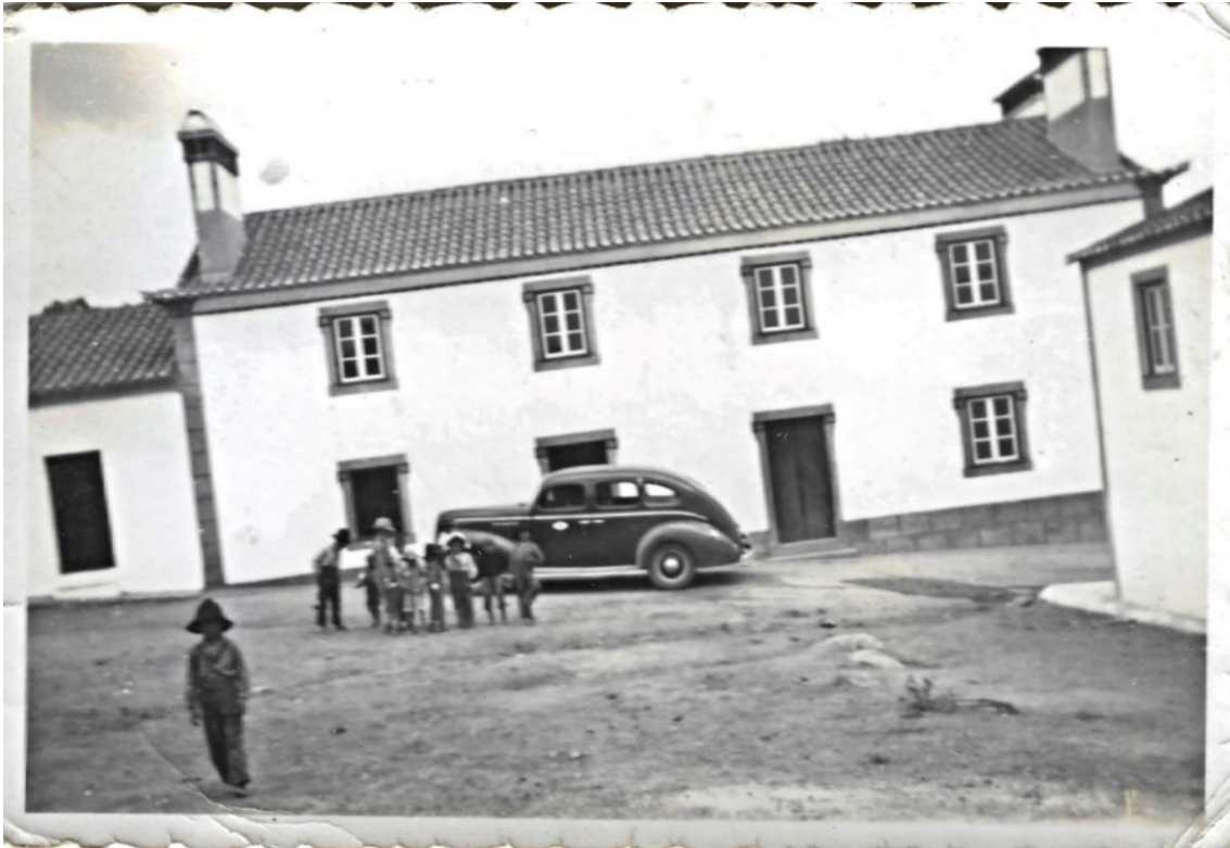
Figura 74 – Grupo de jovens do Pisão, com edificadros da actual Largo da Fonte, à frente de um táxi que veio à aldeia por altura do baptizado de Manuel Matias, 1955.

Fotografias de louça decorativa (c. 1900-1975)