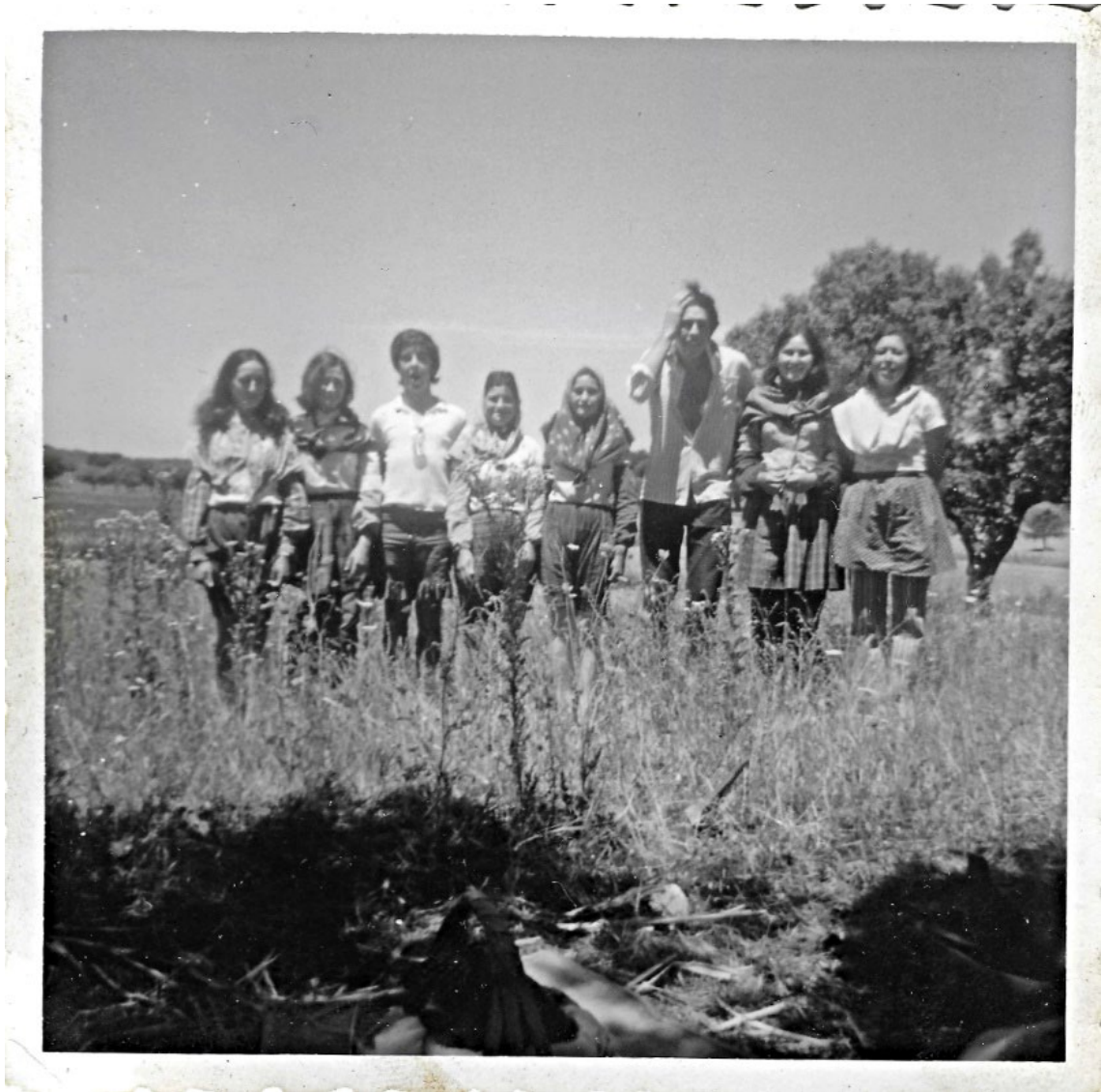
Figura 28 – Grupo de jovens, anos 1960/1970.