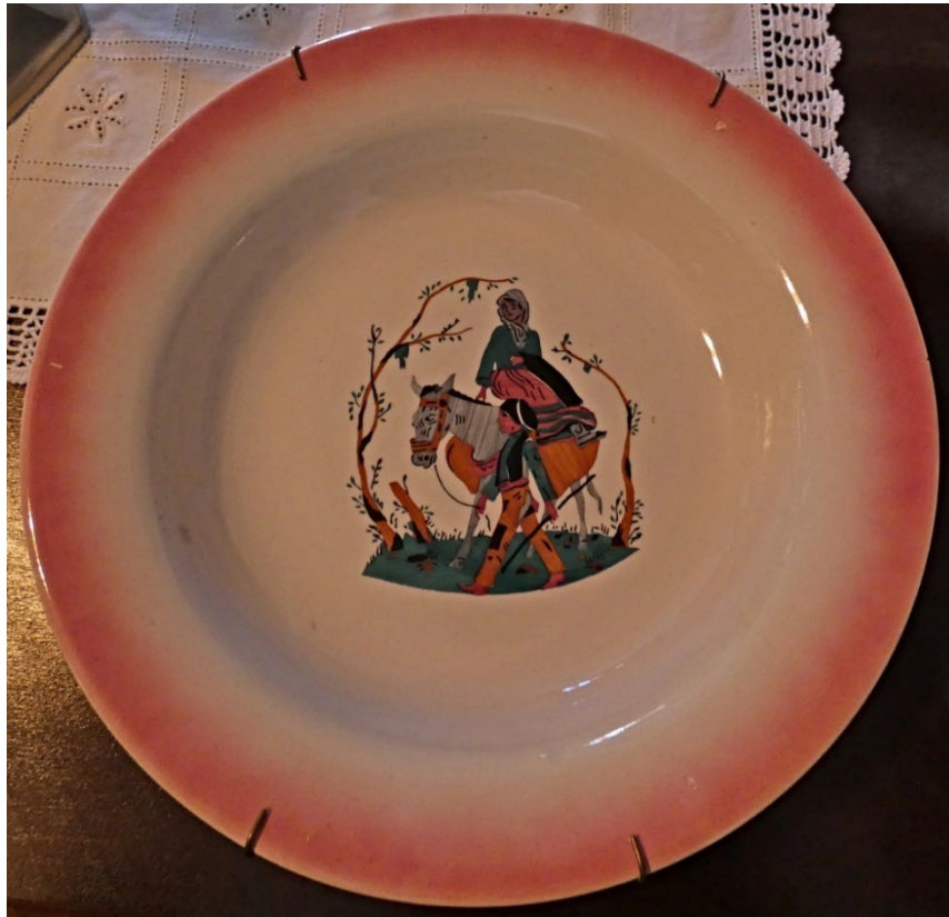
Figura 82 – Prato de faiança da Fábrica de Sacavém, 1905-1973.