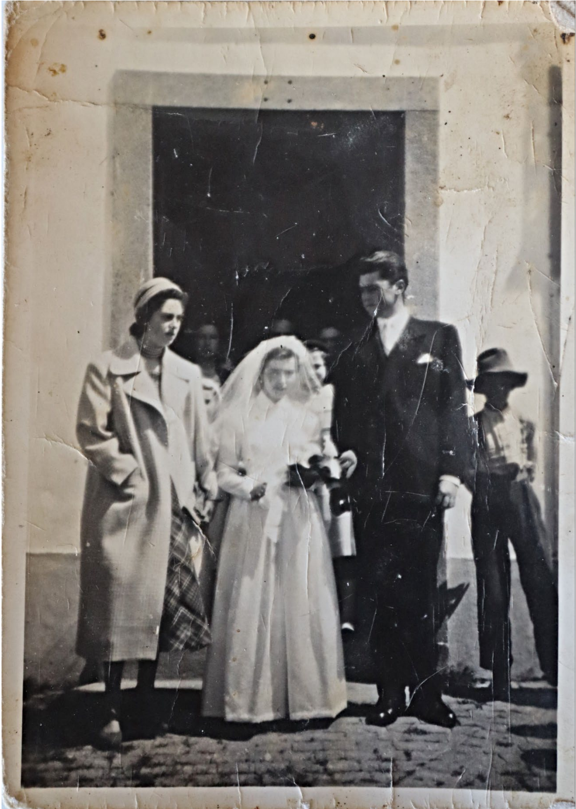
Figura 61 – Casamento, anos 1950.