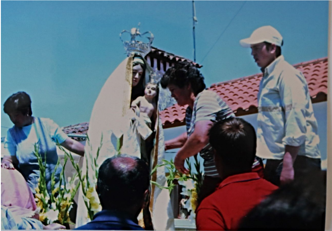
Figura 52 – Procissão em honra de Nossa Senhora dos Mártires, anos 1980/1990.