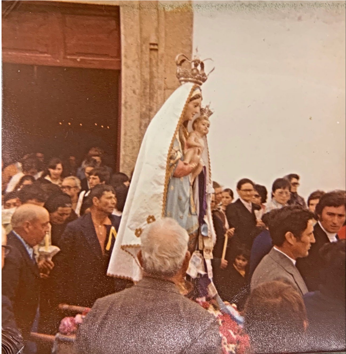
Figura 47 – Procissão em honra de Nossa Senhora dos Mártires, anos 1970/1980.