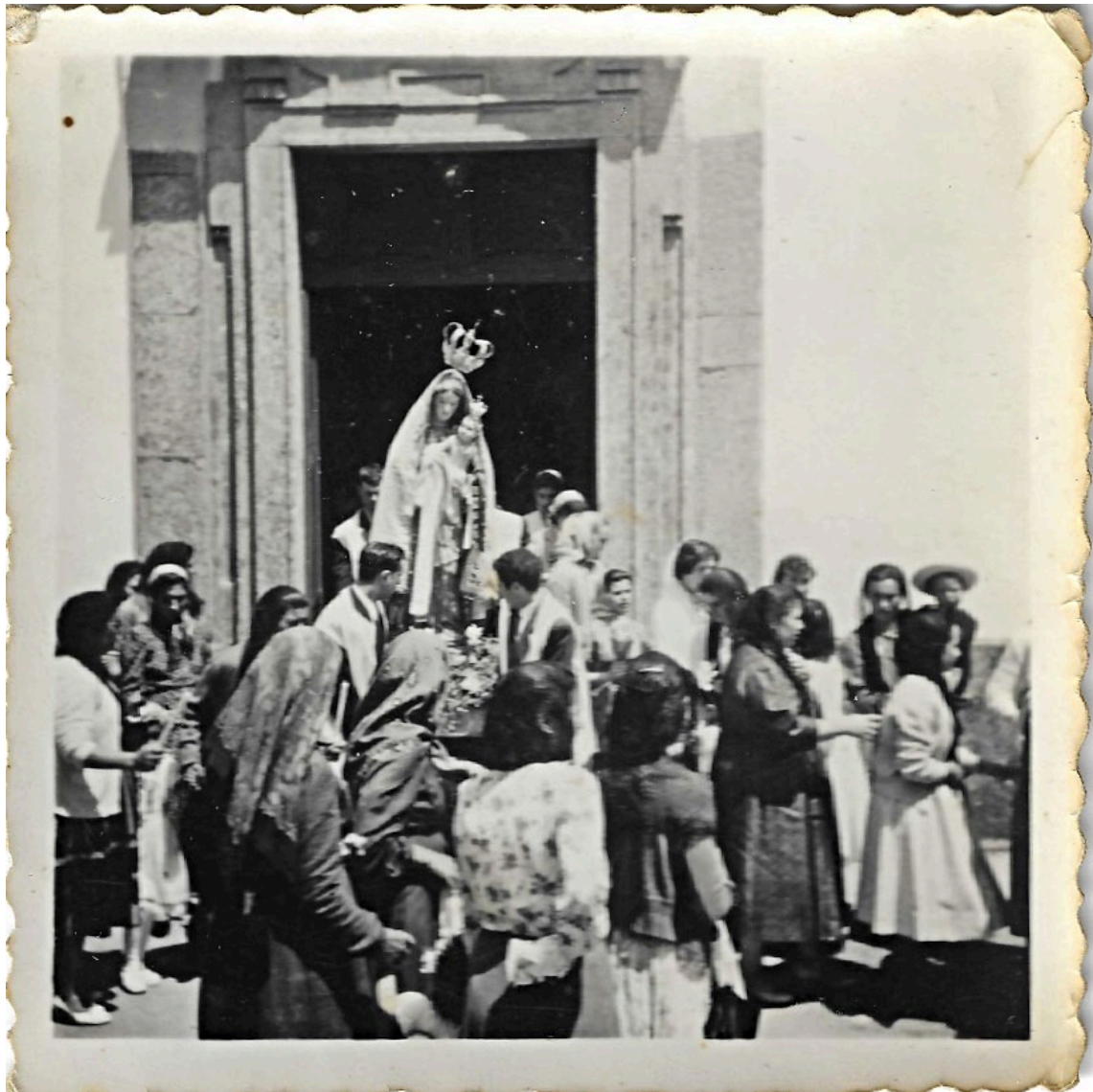
Figura 43 – Imagem de Nossa Senhora a sair da Igreja, na procissão, anos 1950/1960.