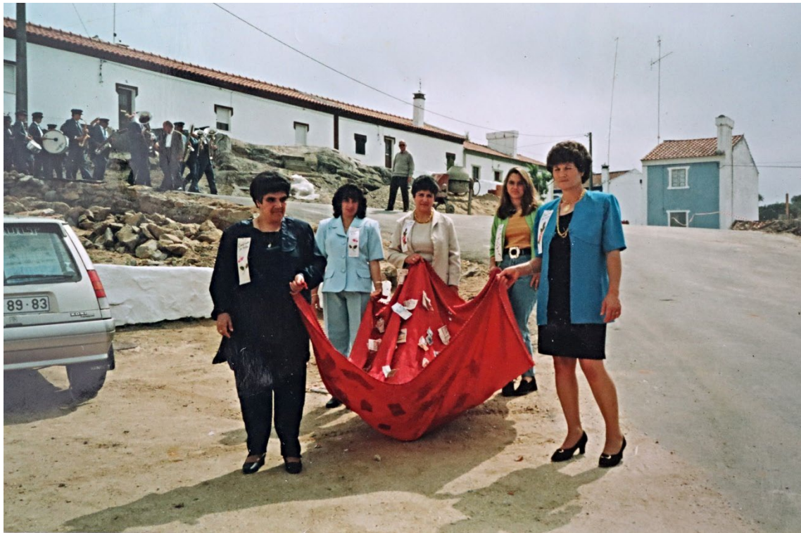
Figura 32 – Peditório na manhã de sábado da Festa de Nossa Senhora dos Mártires, anos 1980/90.