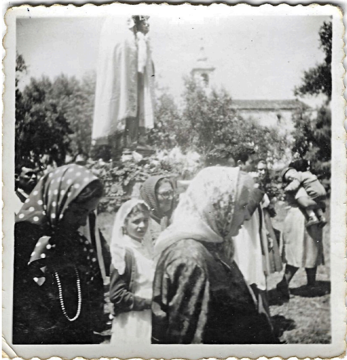
Figura 44 – Procissão em honra de Nossa Senhora dos Mártires, anos 1950/1960.