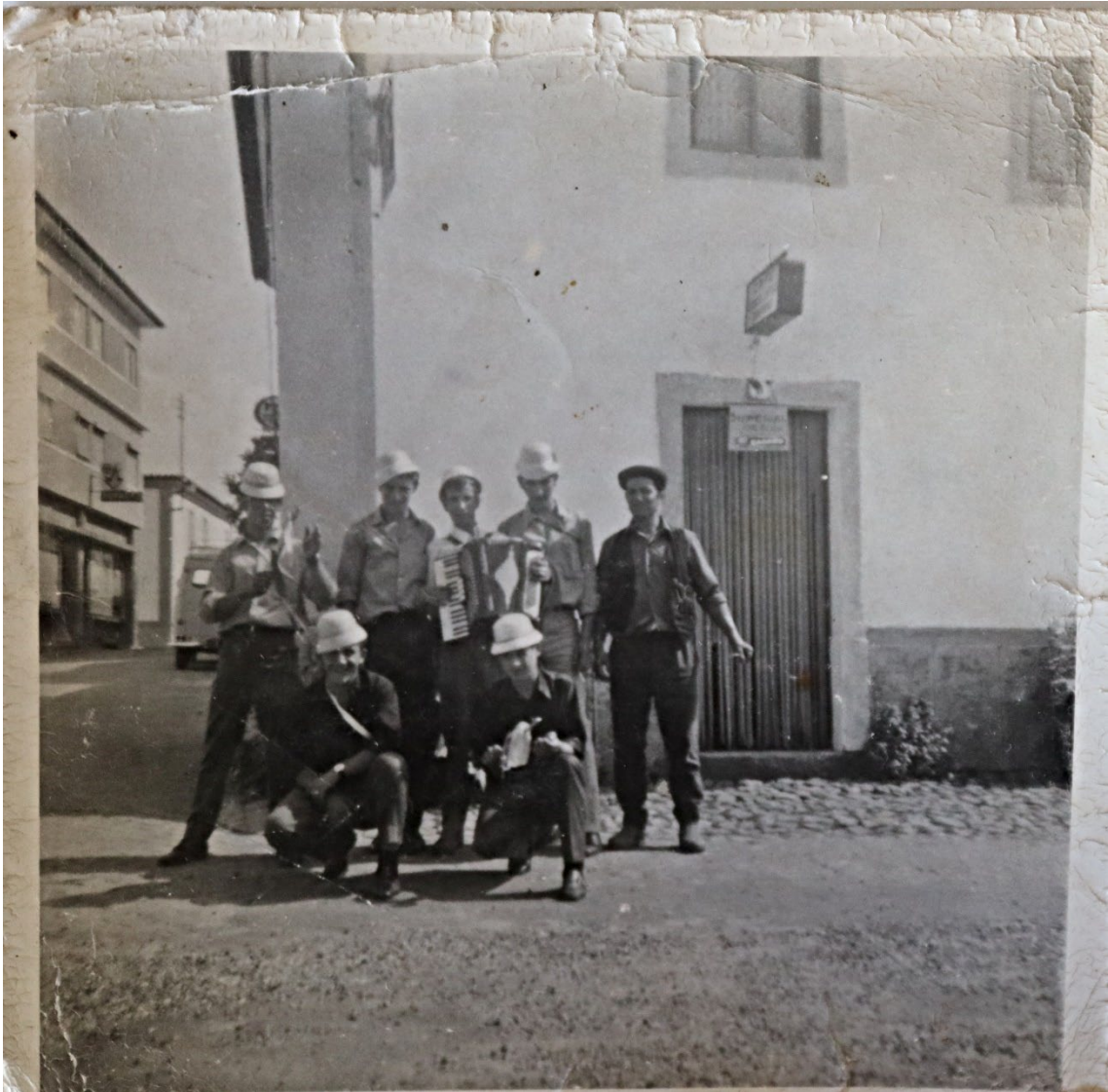
Figura 70 – Grupo de jovens do Pisão tocando acordeão e bailando em Alcorochel, anos 1960/1970.