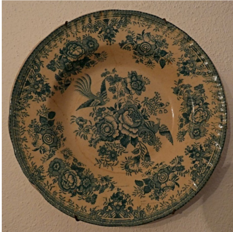
Figura 86 – Prato de faiança da Fábrica de Sacavém, 1905-1973.