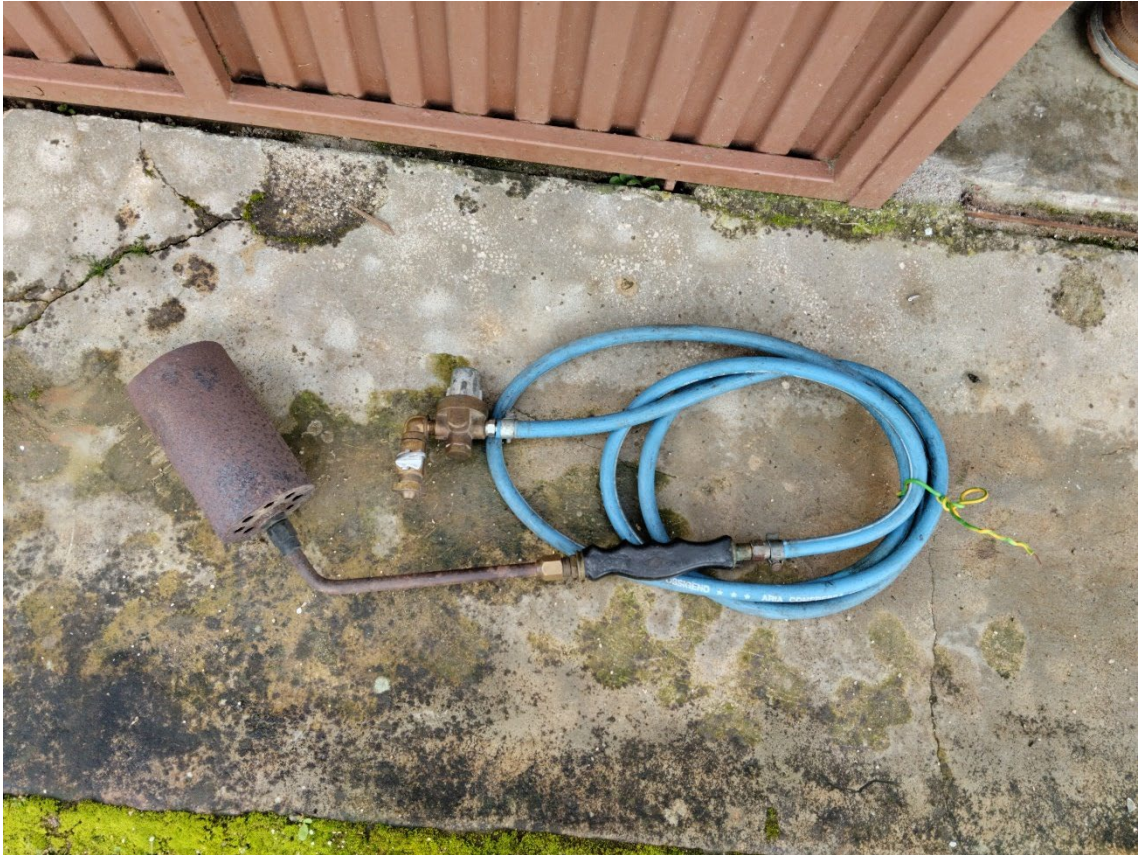
Figura 103 – Maçarico a gás, para musgar o porco.