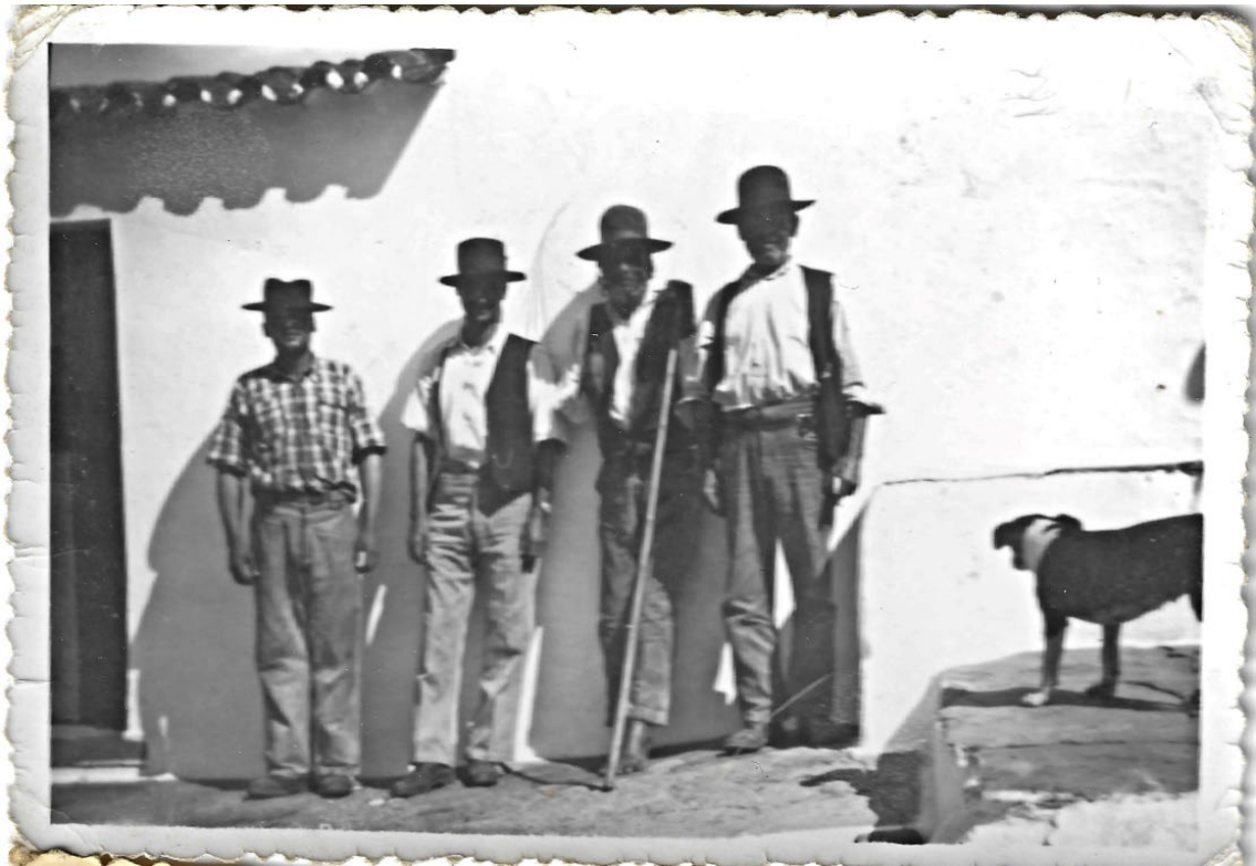
Figura 15 – Grupo de homens, meados do século XX.