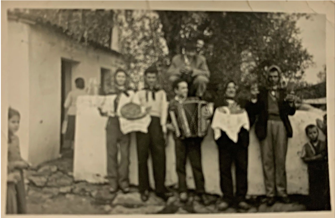
Figura 67 - – Homens nas corridas das fogaças, anos 1950/1960.