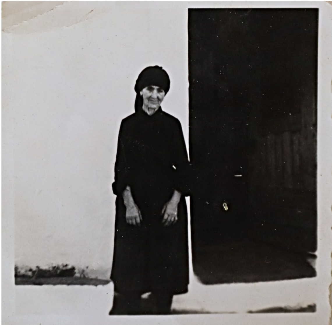
Figura 12 – Retrato de mulher de idade avançada, meados do século XX.