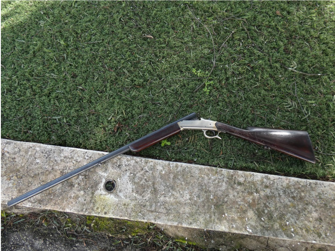
Figura 96 – Espingarda Saint-Etienne Fusil Simplex reveté S-G-D-G, da 1ª metade do século XX.