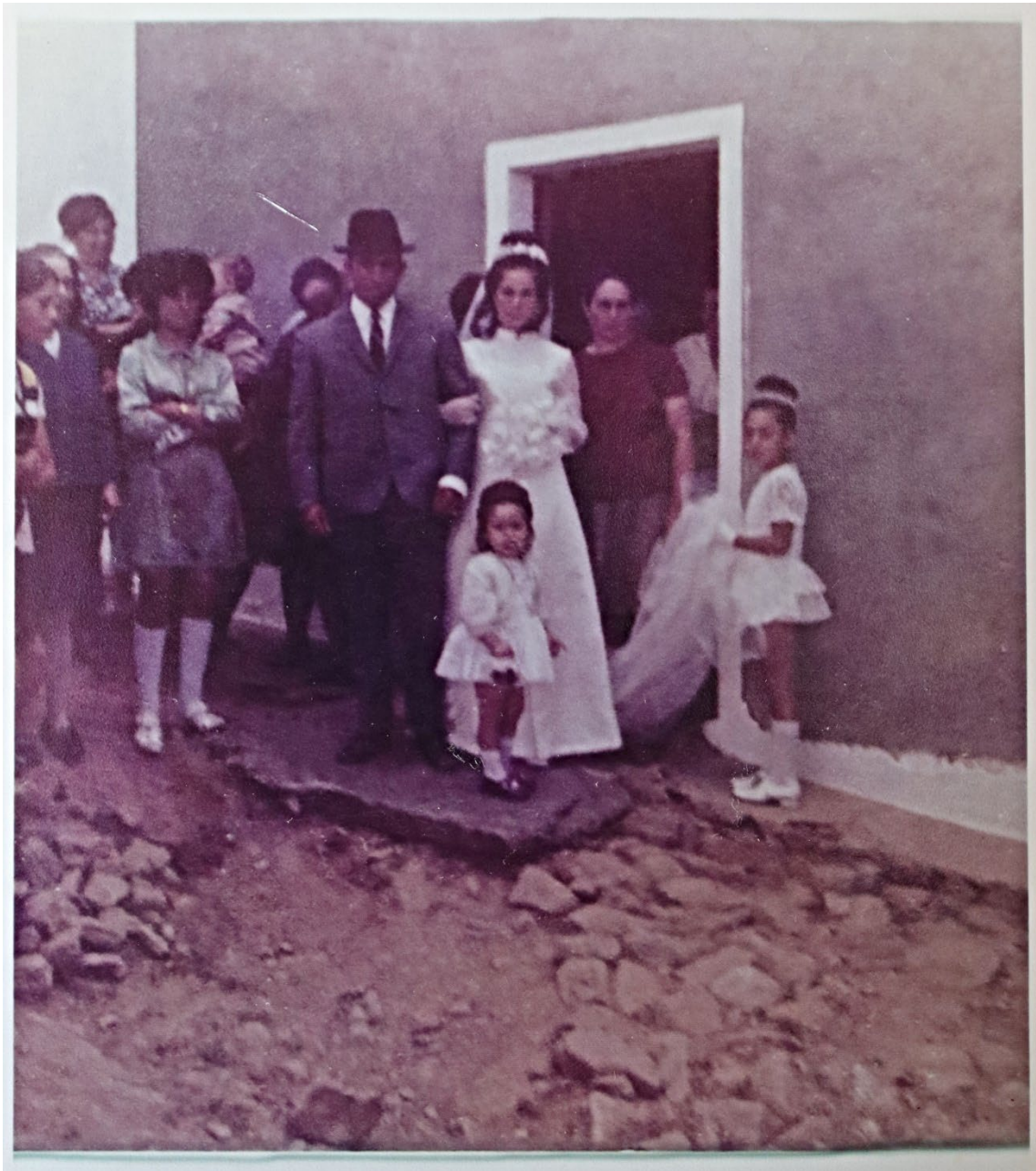
Figura 63 – Casamento, anos 1950/1960.