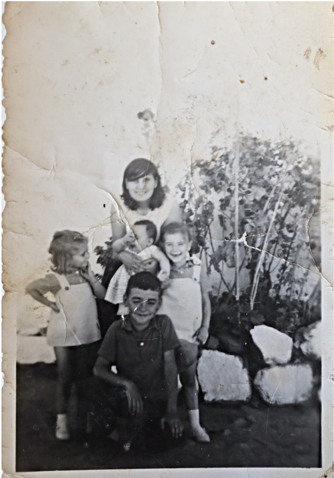
Figura 7 – Mãe e seus filhos nos anos 1960/1970.