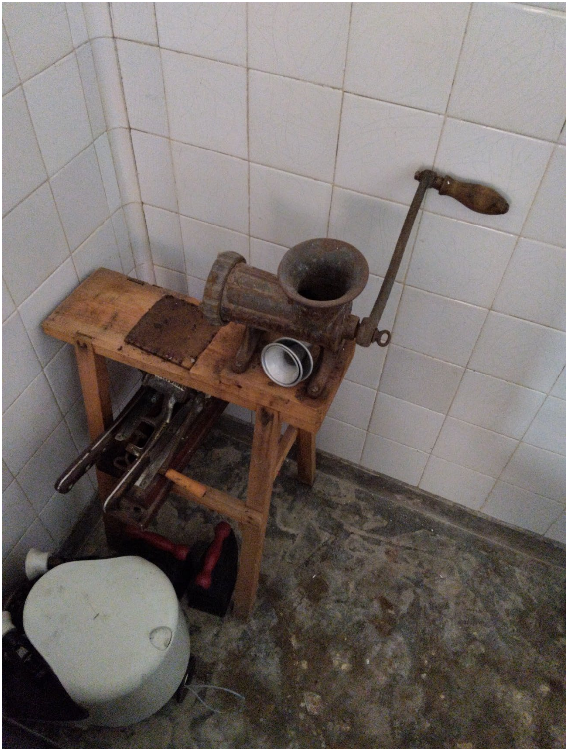
Figura 99 – Utensílio para fazer os enchidos, , antiga salsicharia do Pisão.