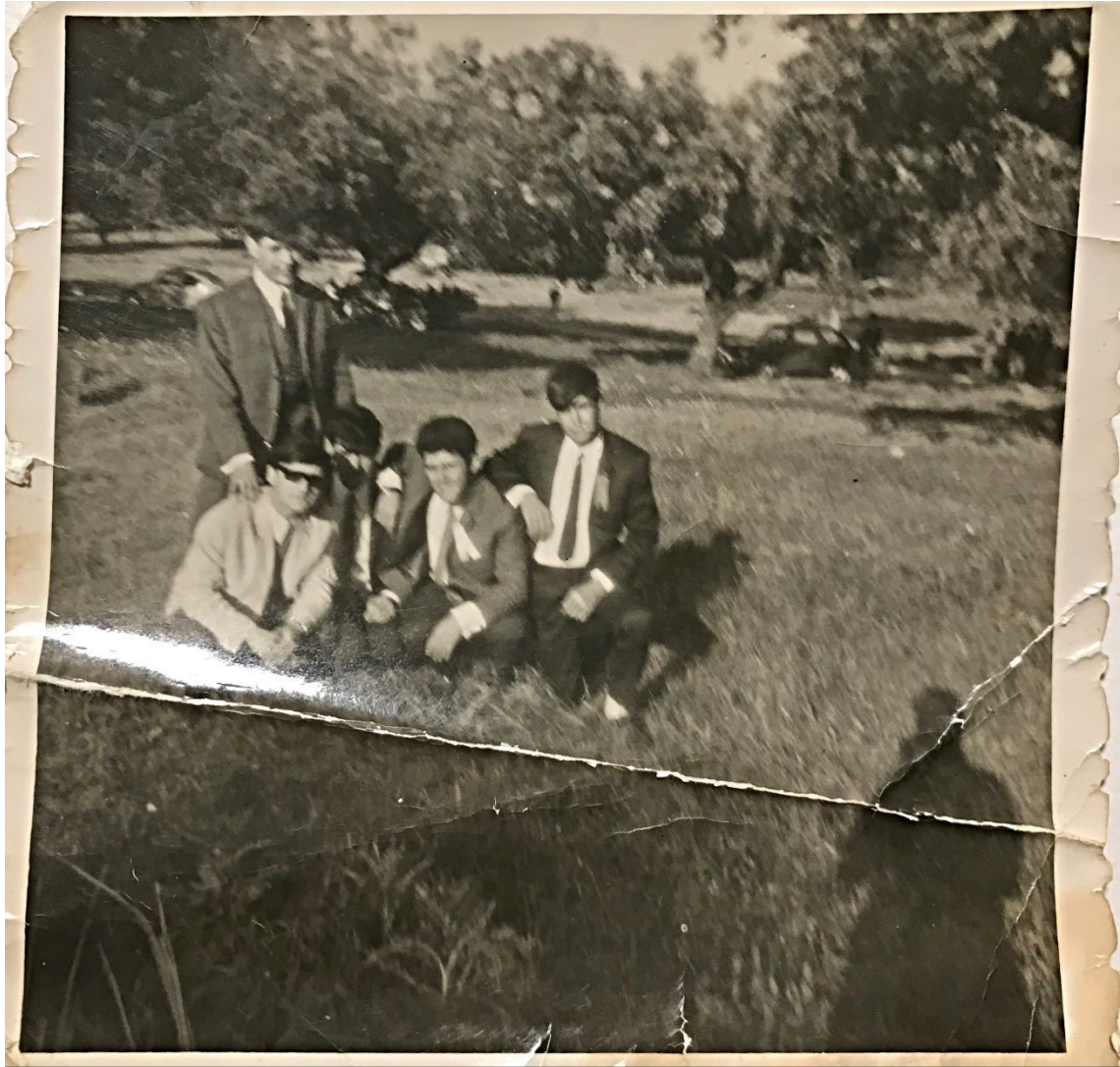
Figura 37 – Grupo de jovens nos Mártires, anos 1960/70.