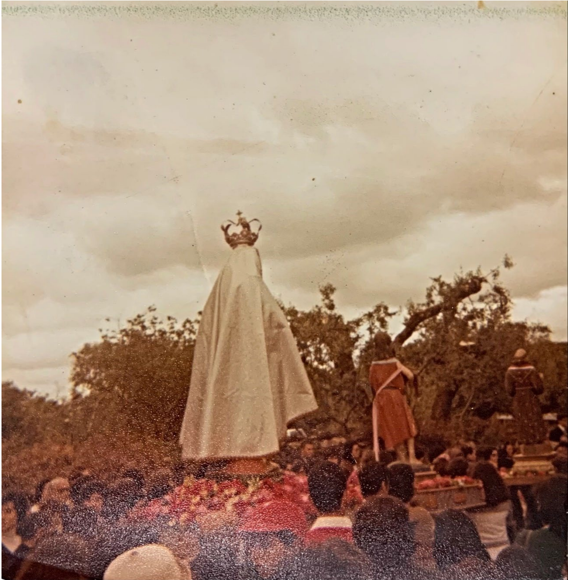
Figura 50 – Procissão em honra de Nossa Senhora dos Mártires, anos 1970/1980.