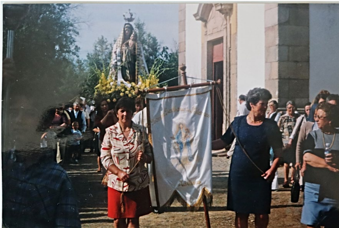
Figura 53– Procissão em honra de Nossa Senhora dos Mártires, anos 1970/1980.