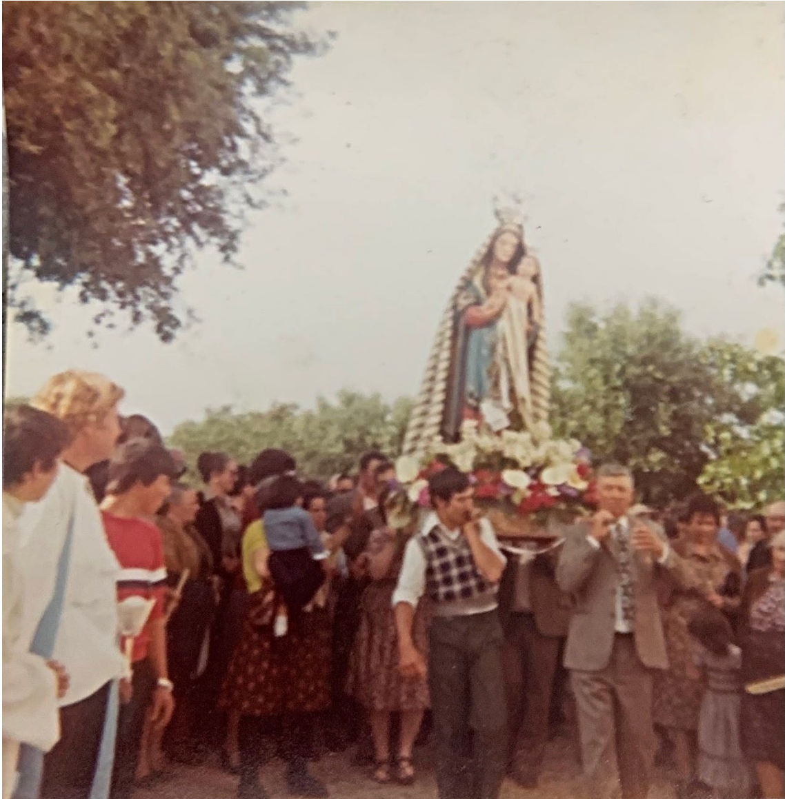
Figura 46 – Procissão em honra de Nossa Senhora dos Mártires, anos 1970/1980.