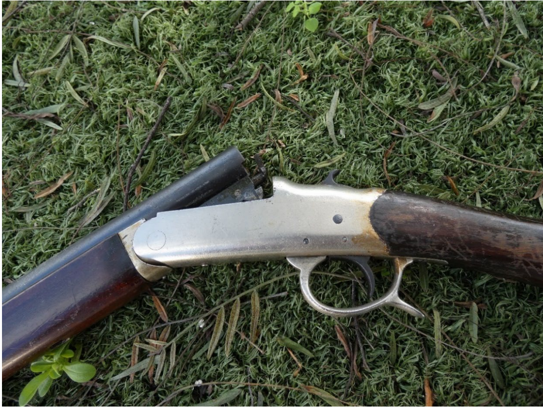
Figura 97 – Pormenor espingarda Saint-Etienne Fusil Simplex reveté S-G-D-G, da 1ª metade do séc. XX.