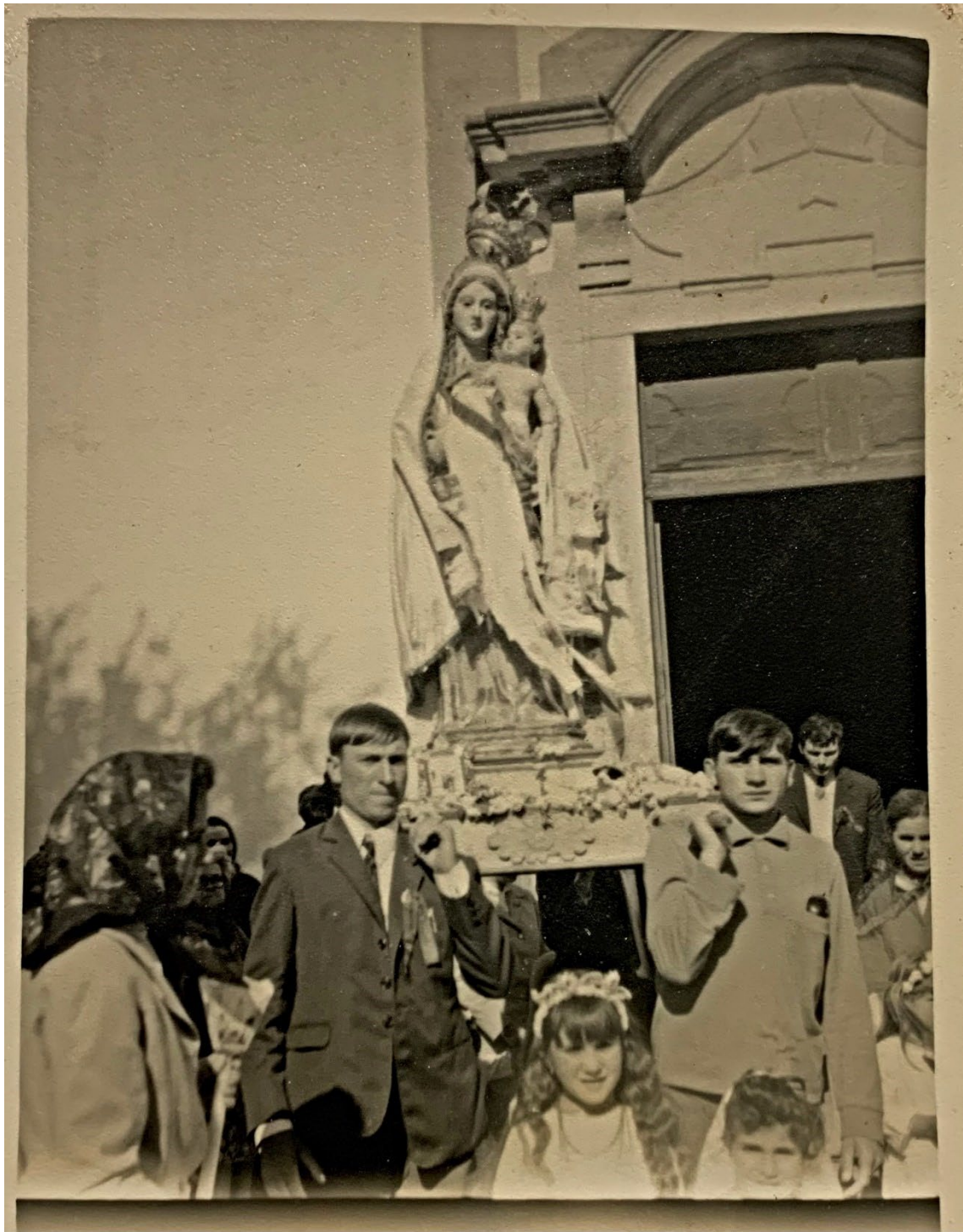
Figura 45 – Procissão em honra de Nossa Senhora dos Mártires, anos 1950/1960.