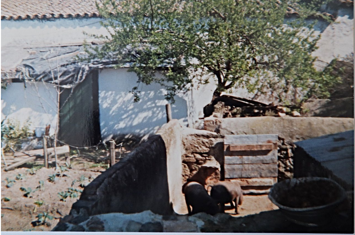
Figura 91 – Malhada de porcos, anos 1960/1970.