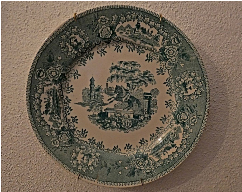
Figura 79 – Prato de faiança da Fábrica de Sacavém, 1905-1973.