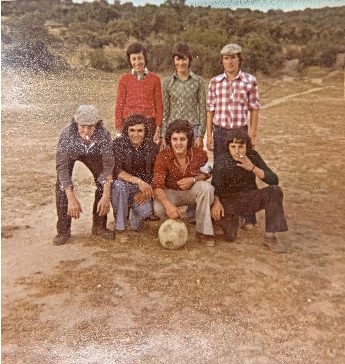
Figura 56 – Jogo de futebol, anos 1970/1980.