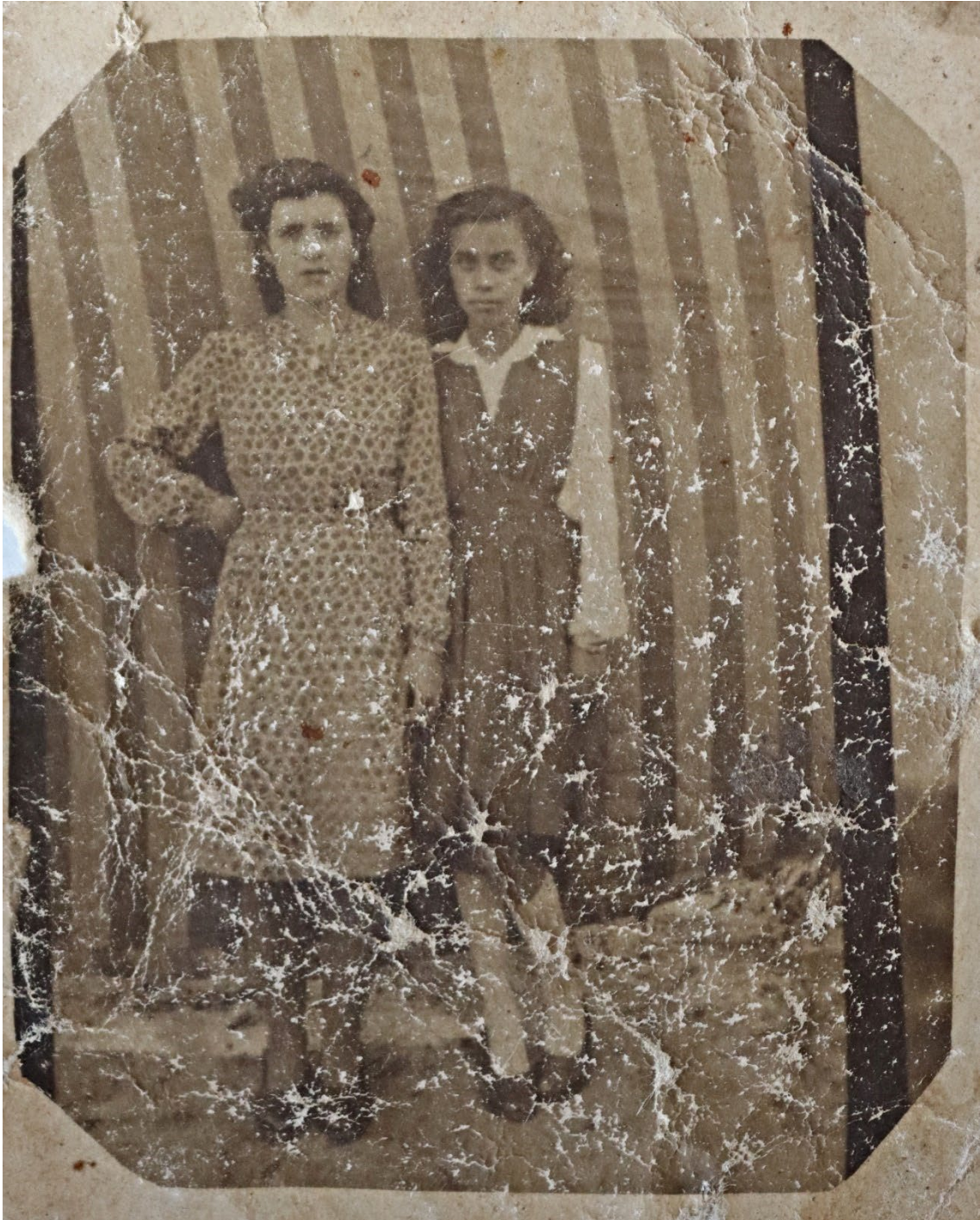
Figura 25 – Grupo de mulheres, meados do século XX.