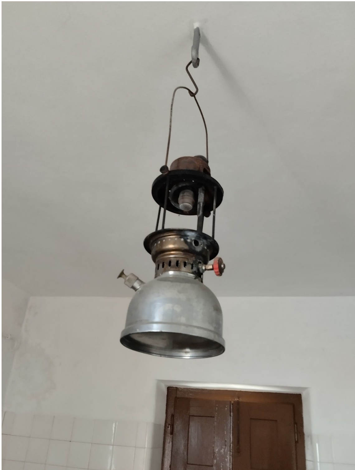
Figura 101 – Candeeiro petromax.