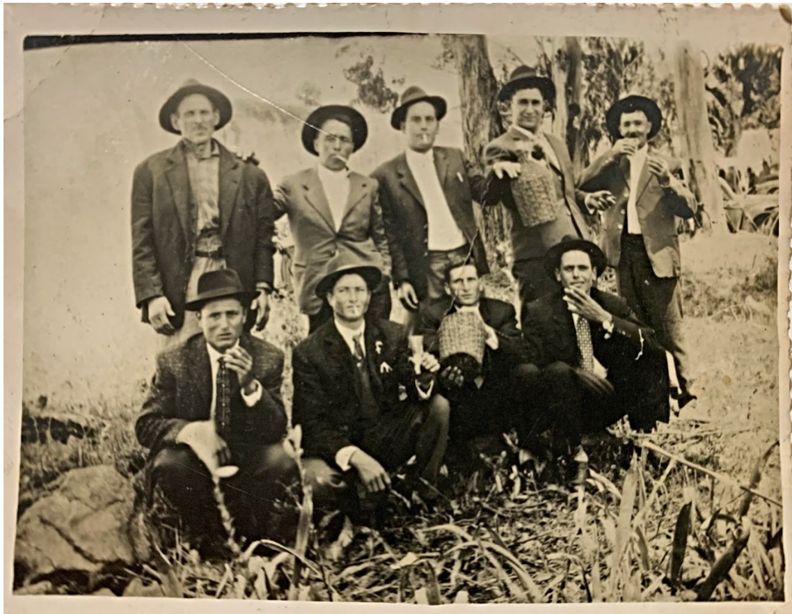
Figura 19 – Grupo de homens, meados do século XX.