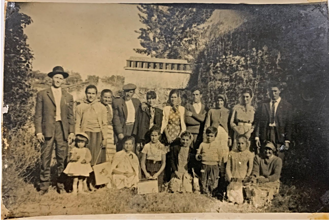
Figura 22 – Família, meados do século XX.