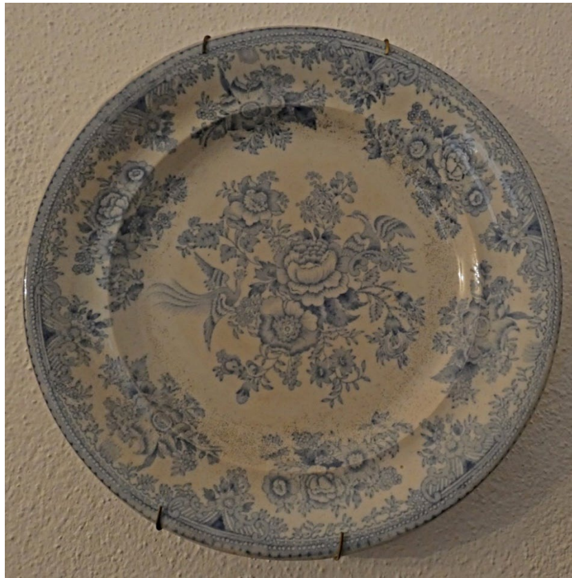
Figura 83 – Prato de faiança da Fábrica de Sacavém, 1905-1973.