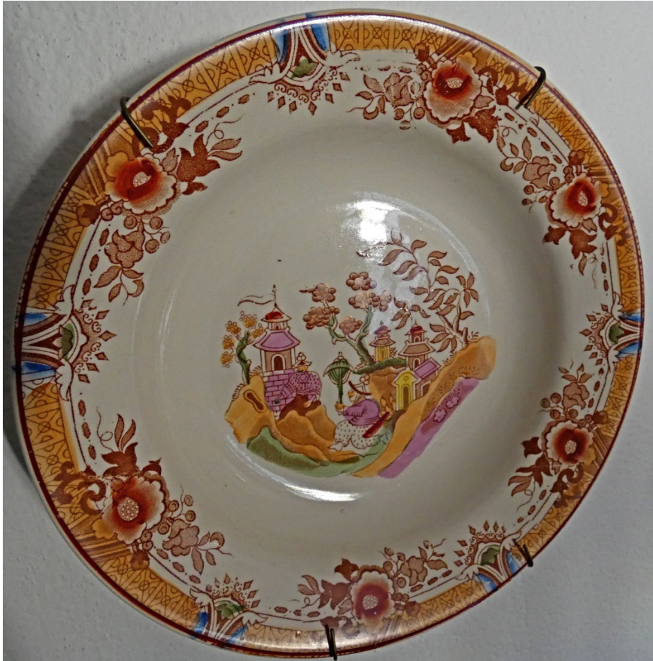
Figura 80 – Prato de faiança da Fábrica de Sacavém, 1905-1973.