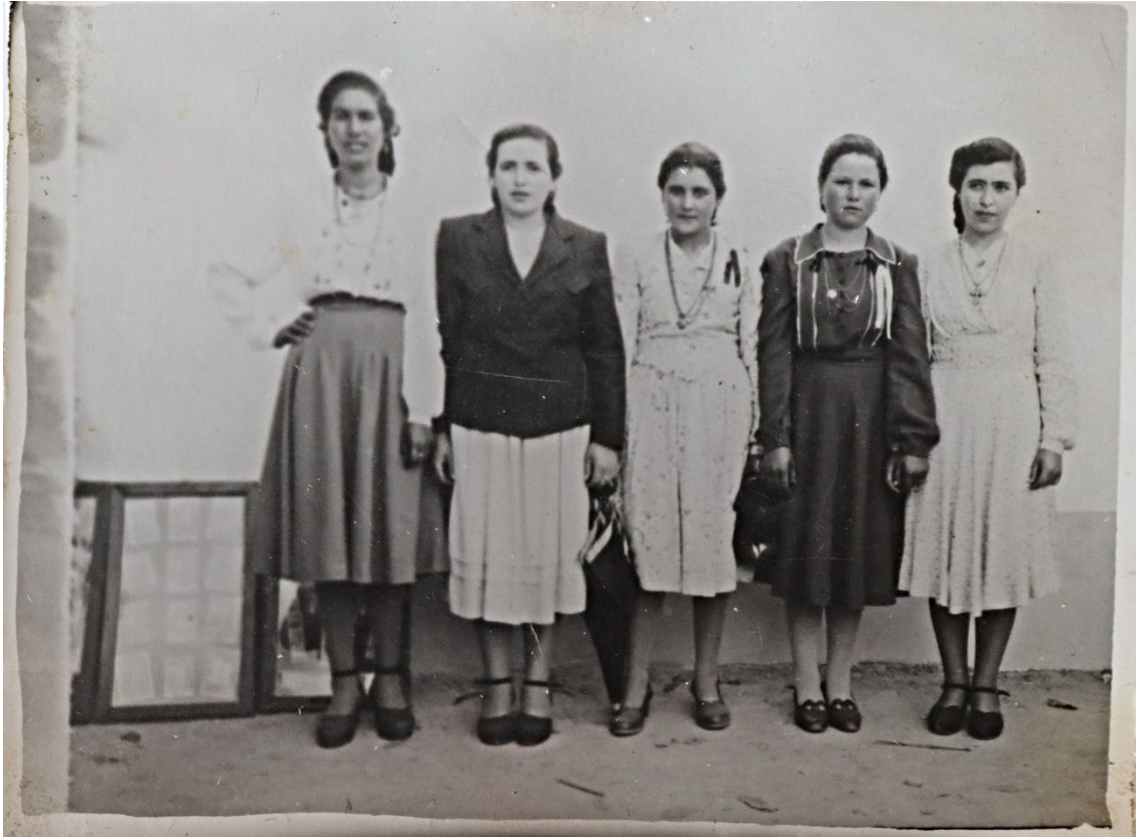
Figura 23 – Grupo de mulheres, meados do século XX.