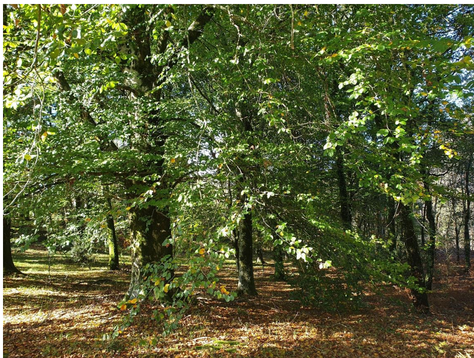
Figura 26 – Florestas de outras folhosas