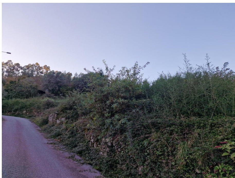
Figura 24 – Matos