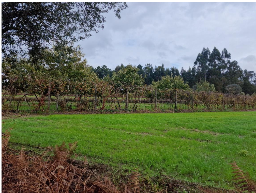
Figura 22 – Vinhas com castanheiros