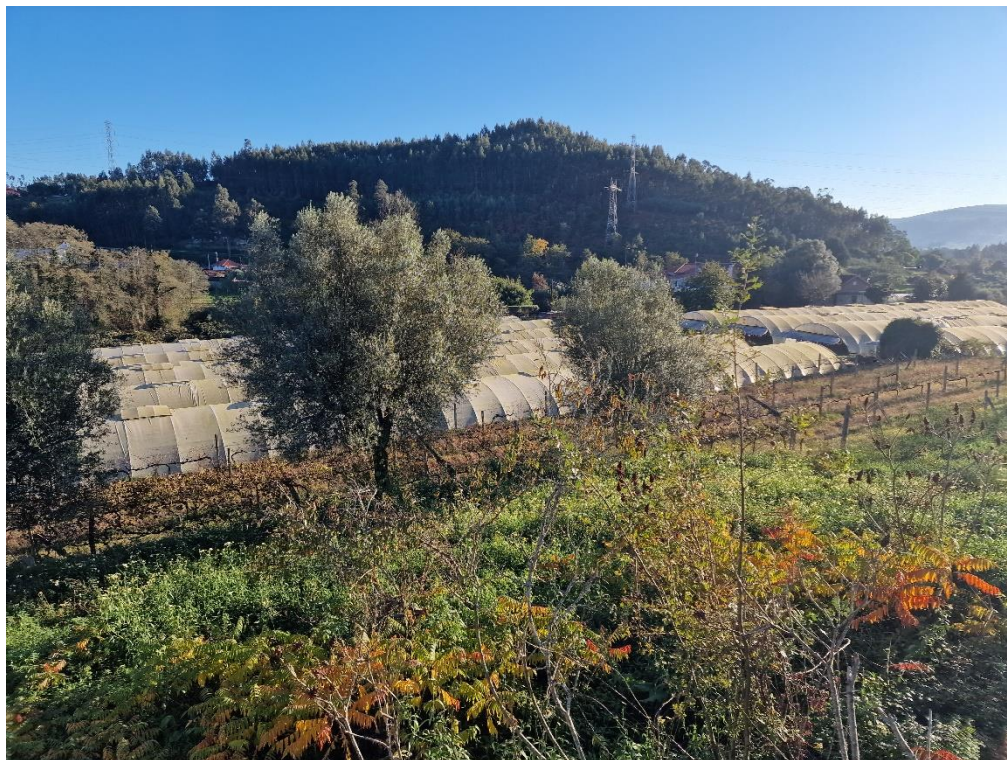
Figura 21 – Agricultura protegida e viveiros