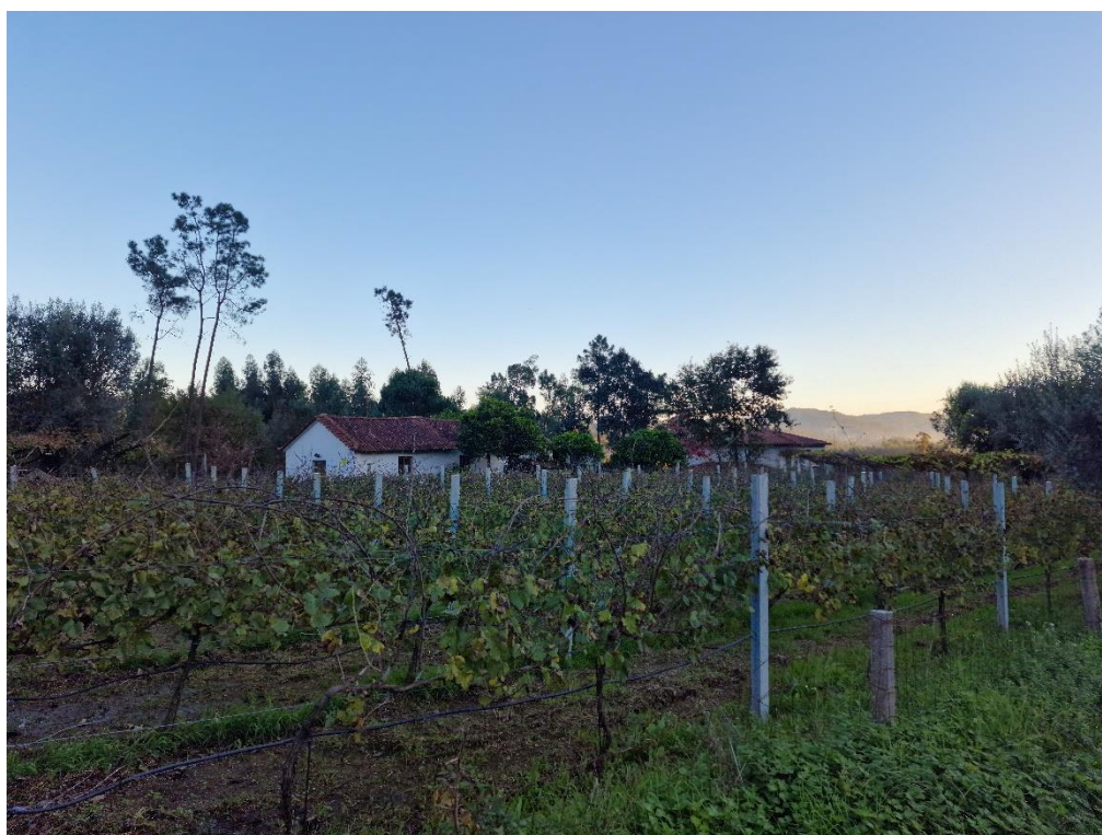
Figura 16 – Vinhas