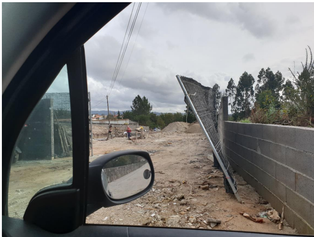
Figura 11 – Áreas em construção