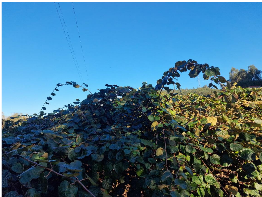
Figura 17 – Pomares (pomar de kiwi)