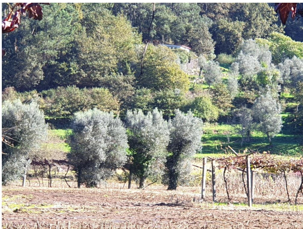
Figura 18 – Olivais