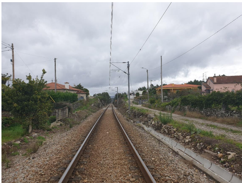
Figura 10 – Rede ferroviária e espaços associados