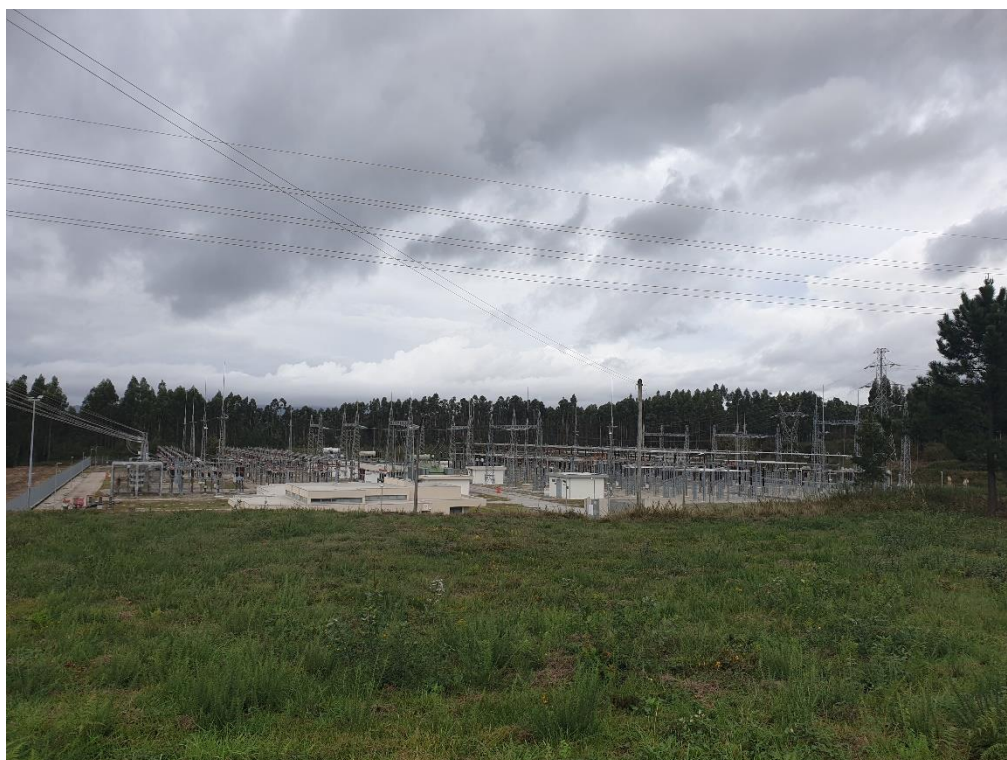
Figura 6 – Infraestruturas de transformação de tensão (subestação de Vila Fria)