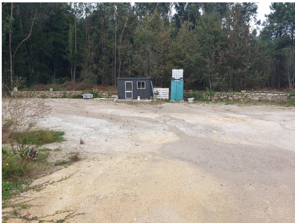
Figura 14 – Espaços vazios sem construção