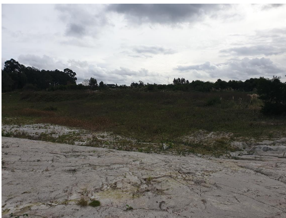
Figura 30 – Rocha nua