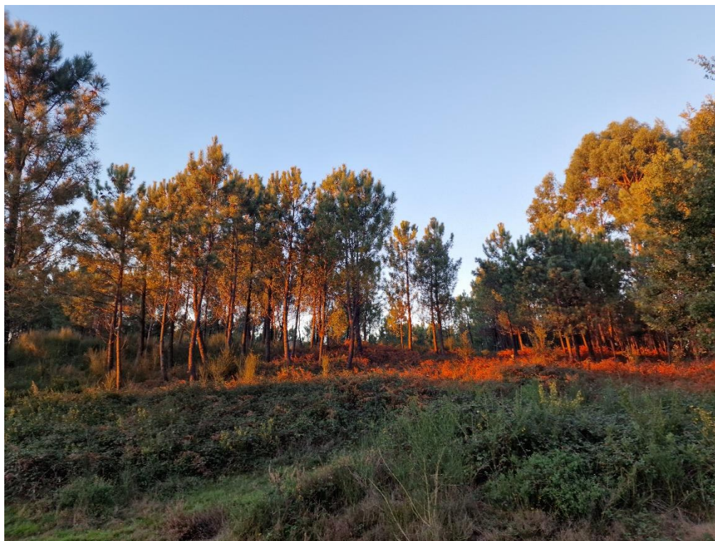
Figura 27 – Florestas de pinheiro-bravo