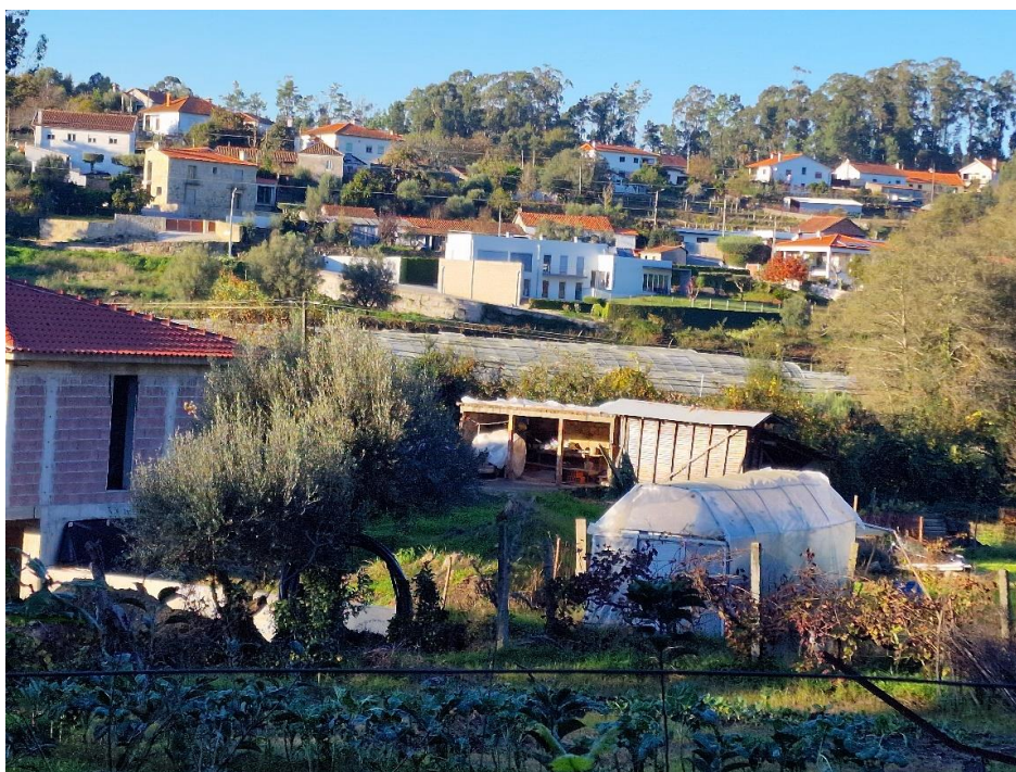
Figura 1 – Tecido edificado descontínuo