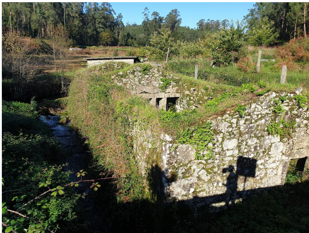
Figura 3 – Ruínas