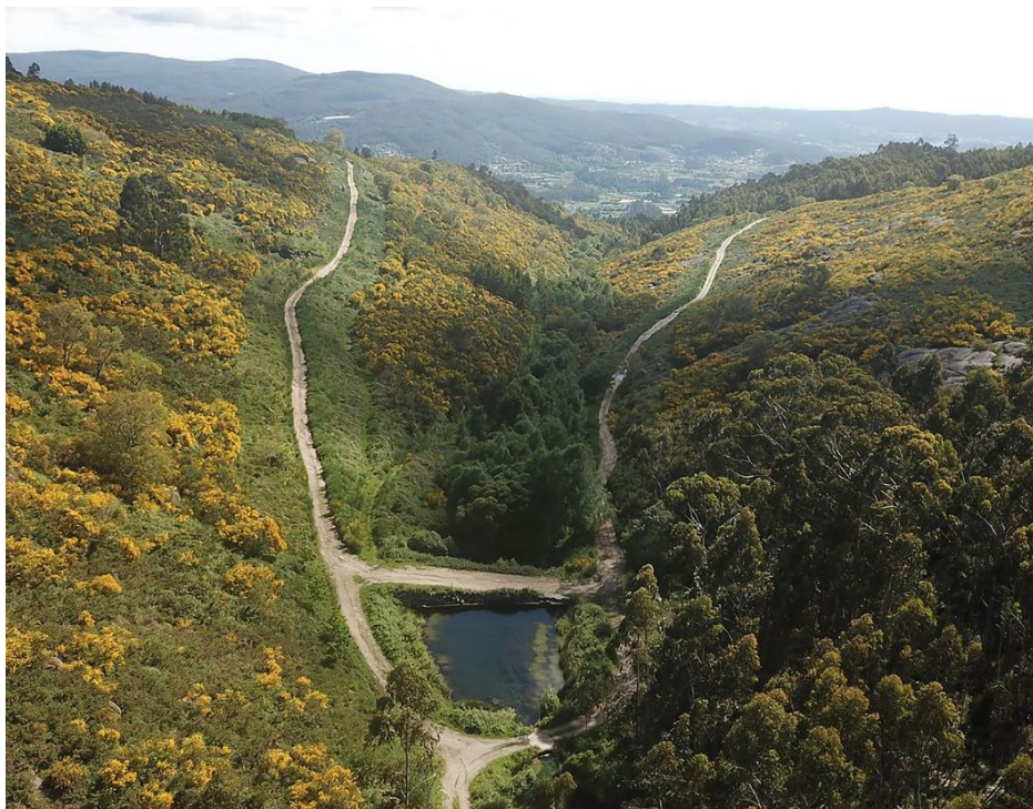
Figura 29 – Charcas