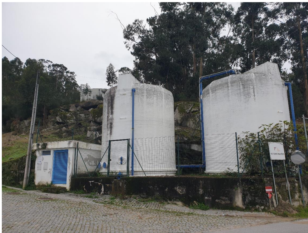
Figura 7 – Infraestruturas para captação, tratamento e abastecimento de água para consumo