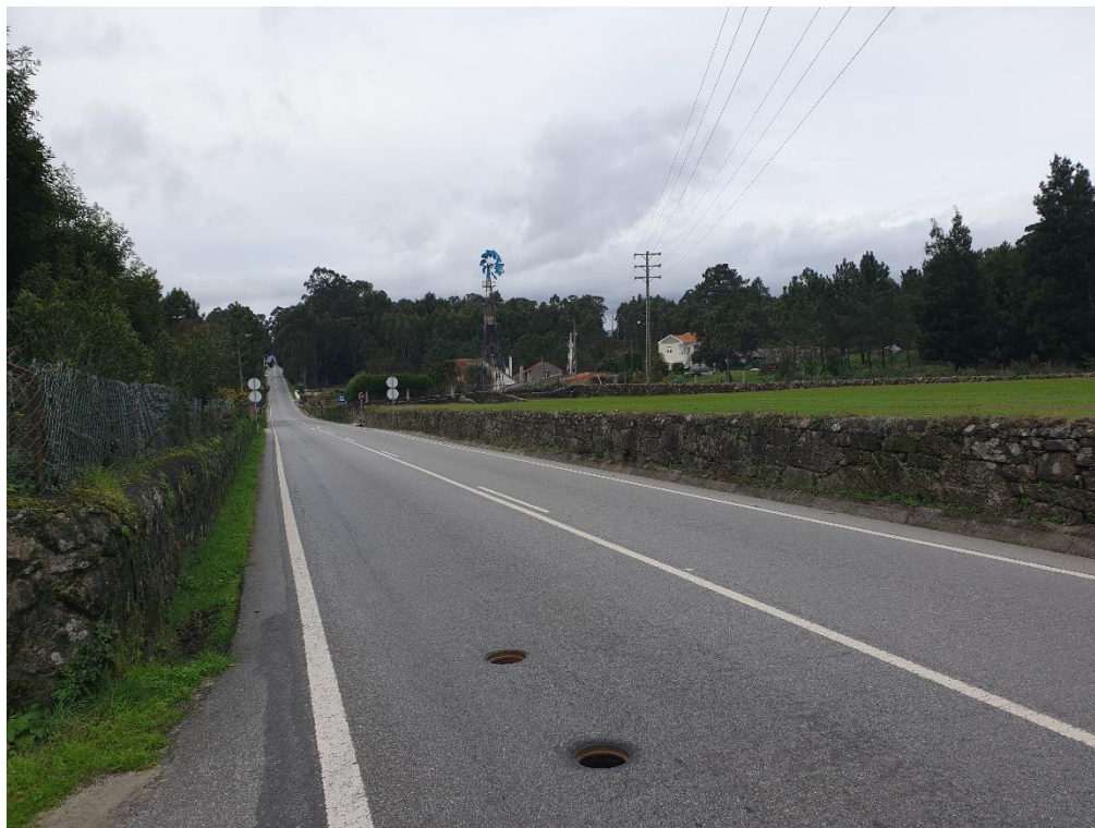
Figura 9 – Rede viária e espaços associados