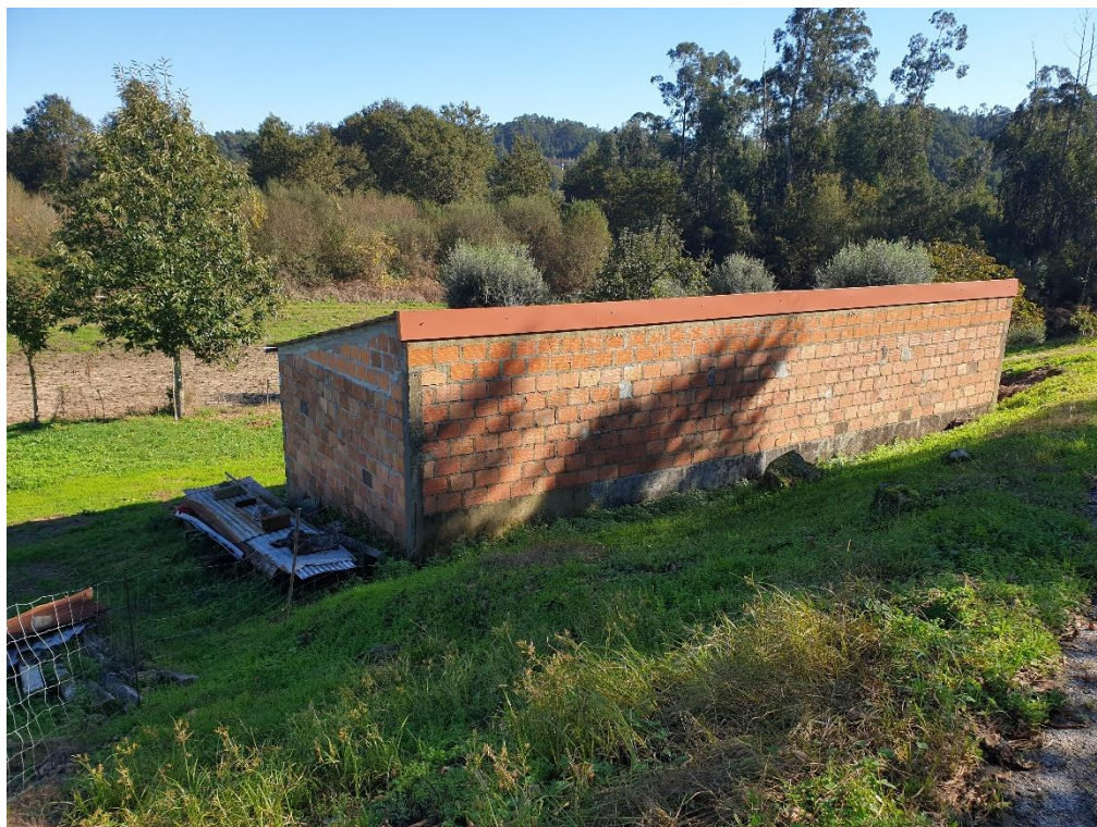
Figura 5 – Instalações agrícolas (pequeno apoio agrícola)