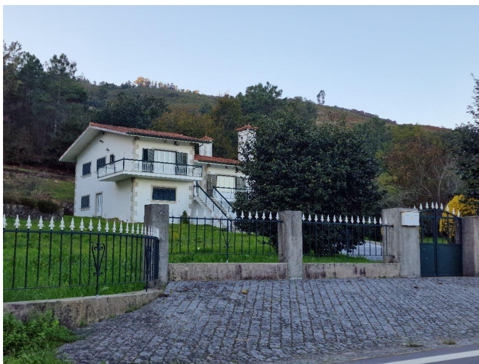
Figura 2 – Tecido edificado descontínuo esperso (habitação isolada)