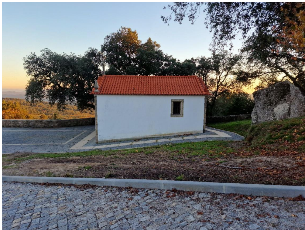
Figura 13 – Equipamentos Culturais