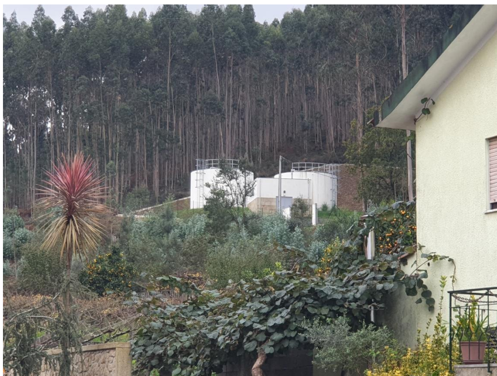
Figura 8 – Infraestruturas de tratamento de resíduos e águas residuais