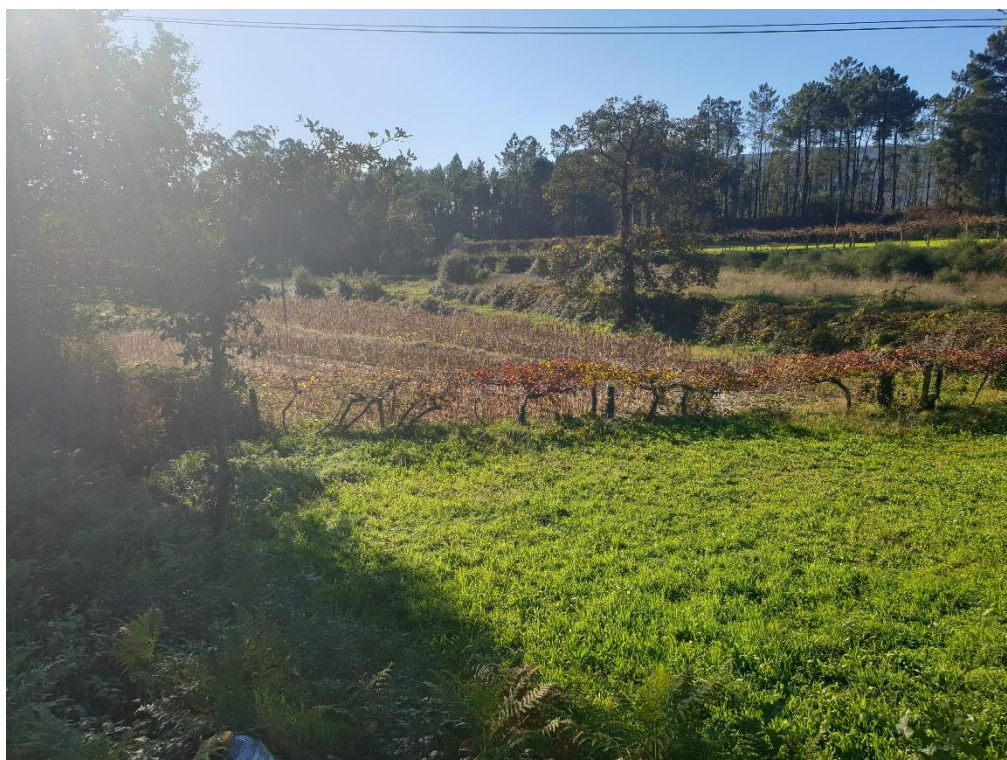
Figura 20 – Agricultura com espaços naturais e seminaturais