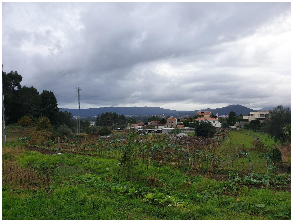
Figura 19 – Mosaicos culturais e parcelares complexos