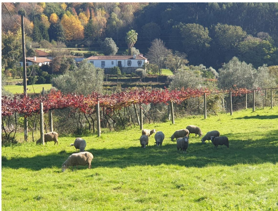
Figura 23 – Pastagens melhoradas