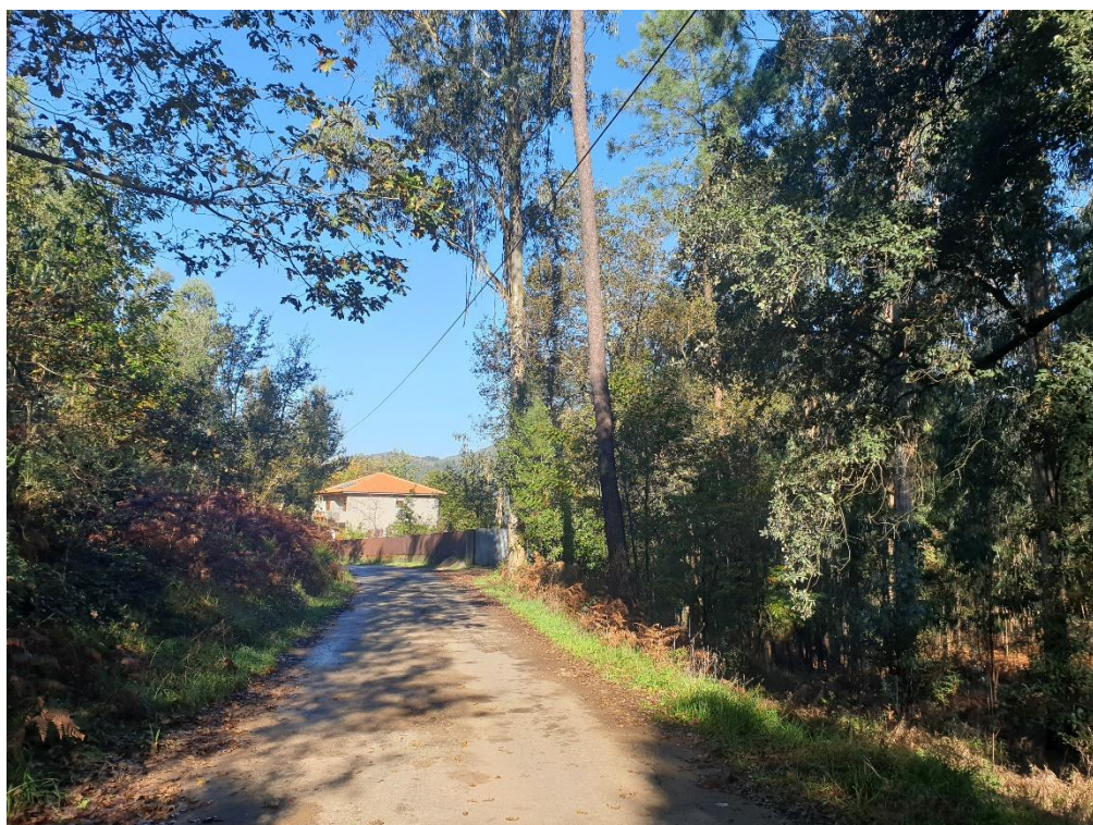
Figura 28 – Florestas mistas de eucalipto e pinheiro-bravo