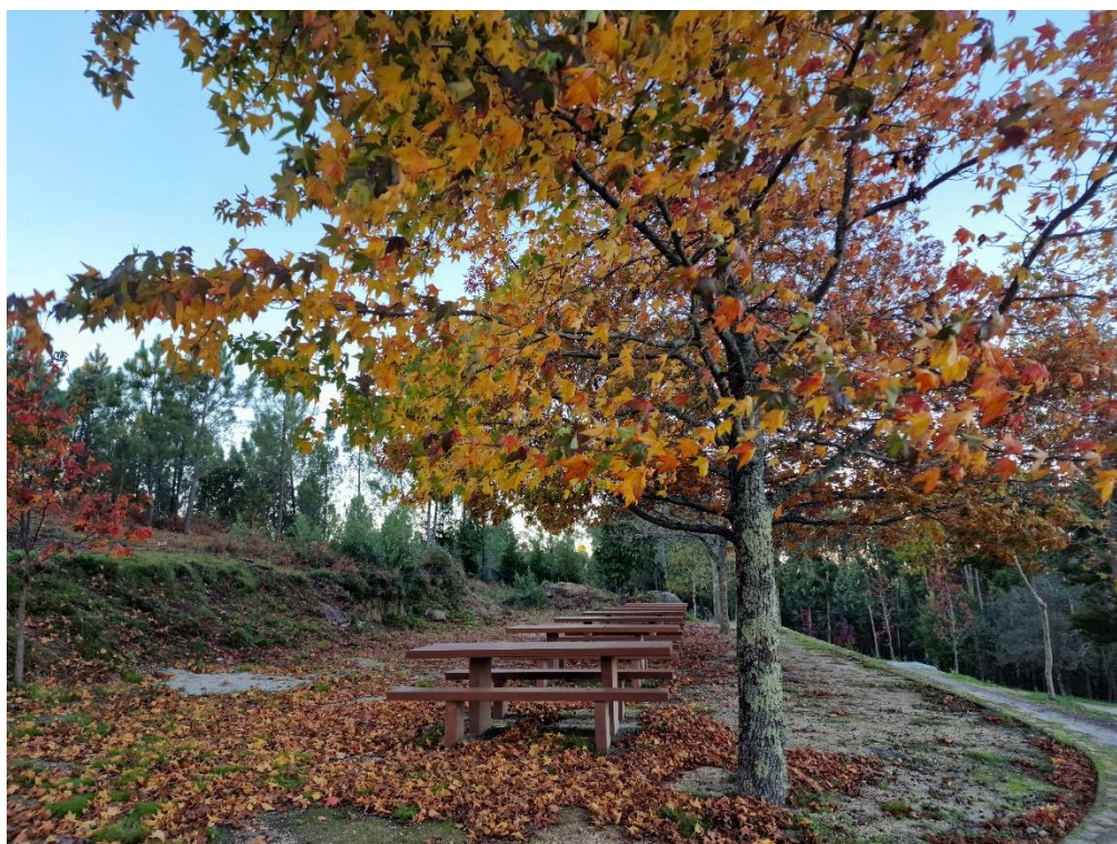
Figura 12 – Áreas de lazer