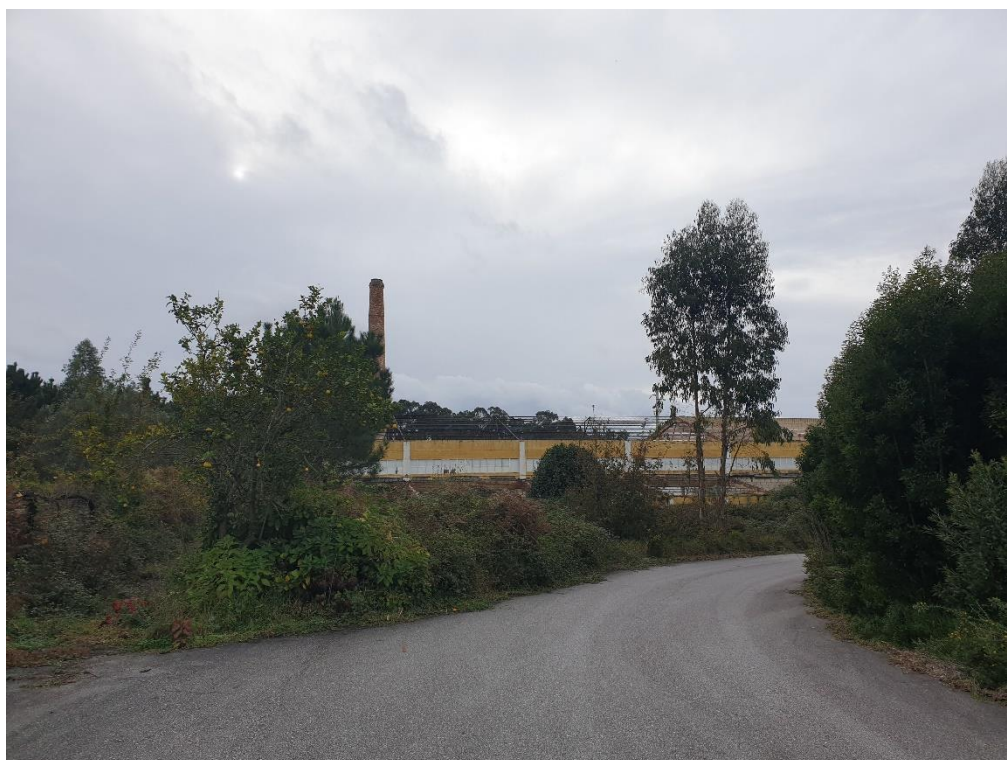
Figura 4 – Indústria