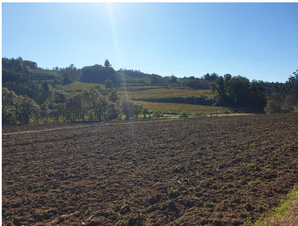
Figura 15 – Culturas temporárias de sequeiro e regadio