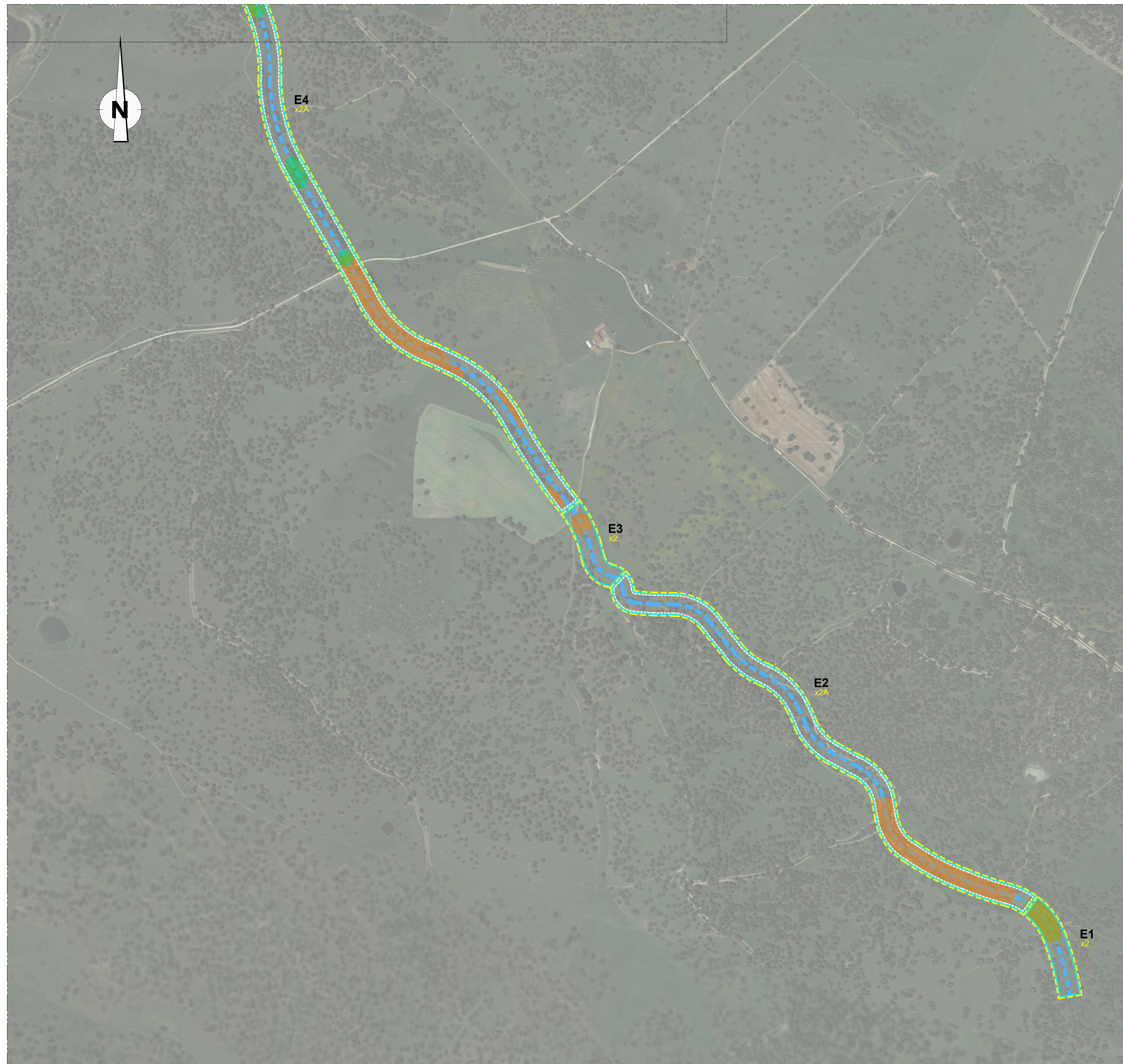
PLANTA - FOLHA 02 Esc. 1:5000