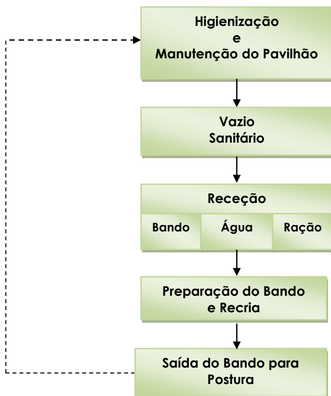
| Figura 1 – Fluxograma do ciclo produtivo da exploração - Pavilhão de Recria.

Relativamente à atividade de recria na empresa, segue-se o diagrama descritivo: