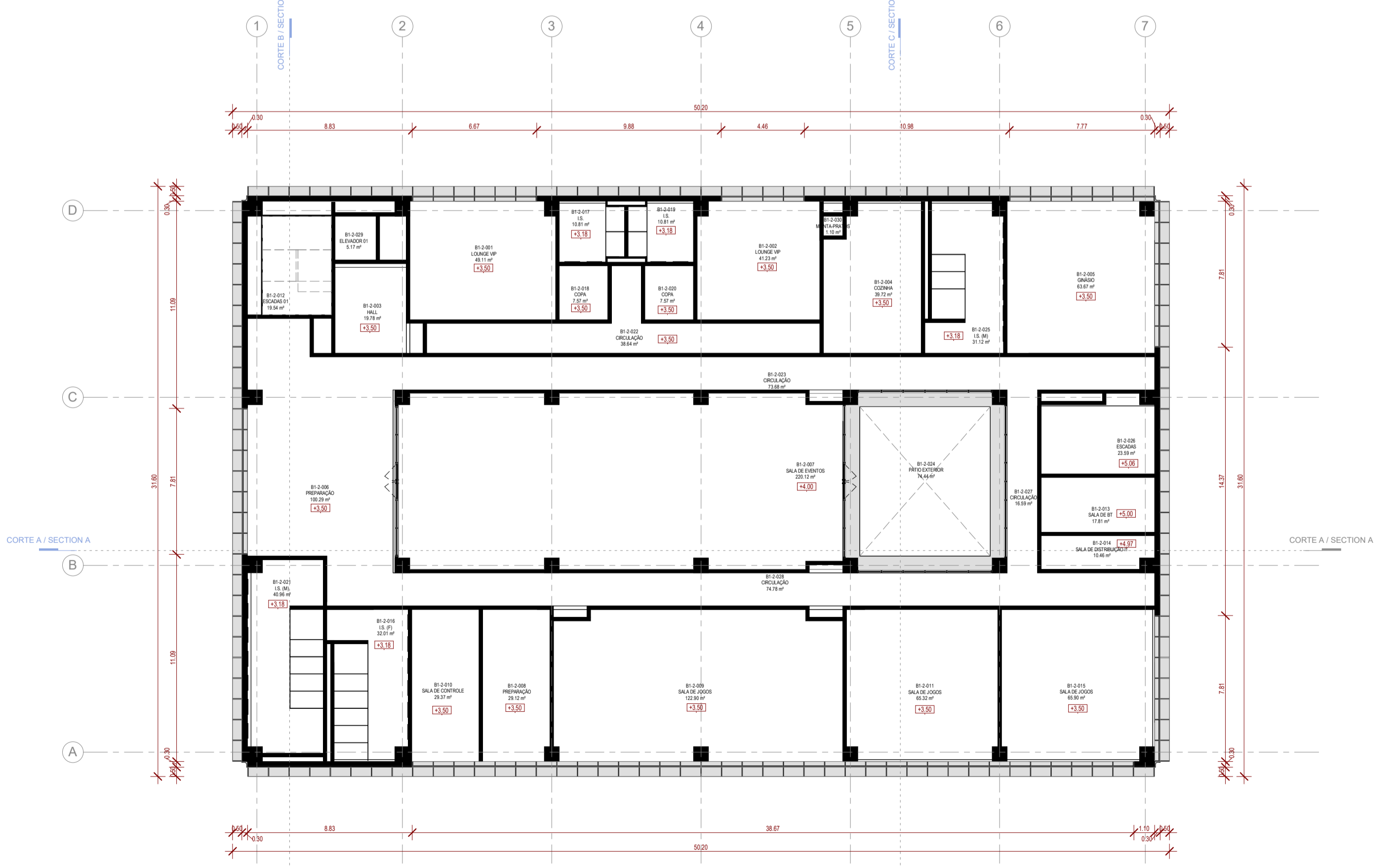
PISO 2 / LEVEL 2 1 : 200