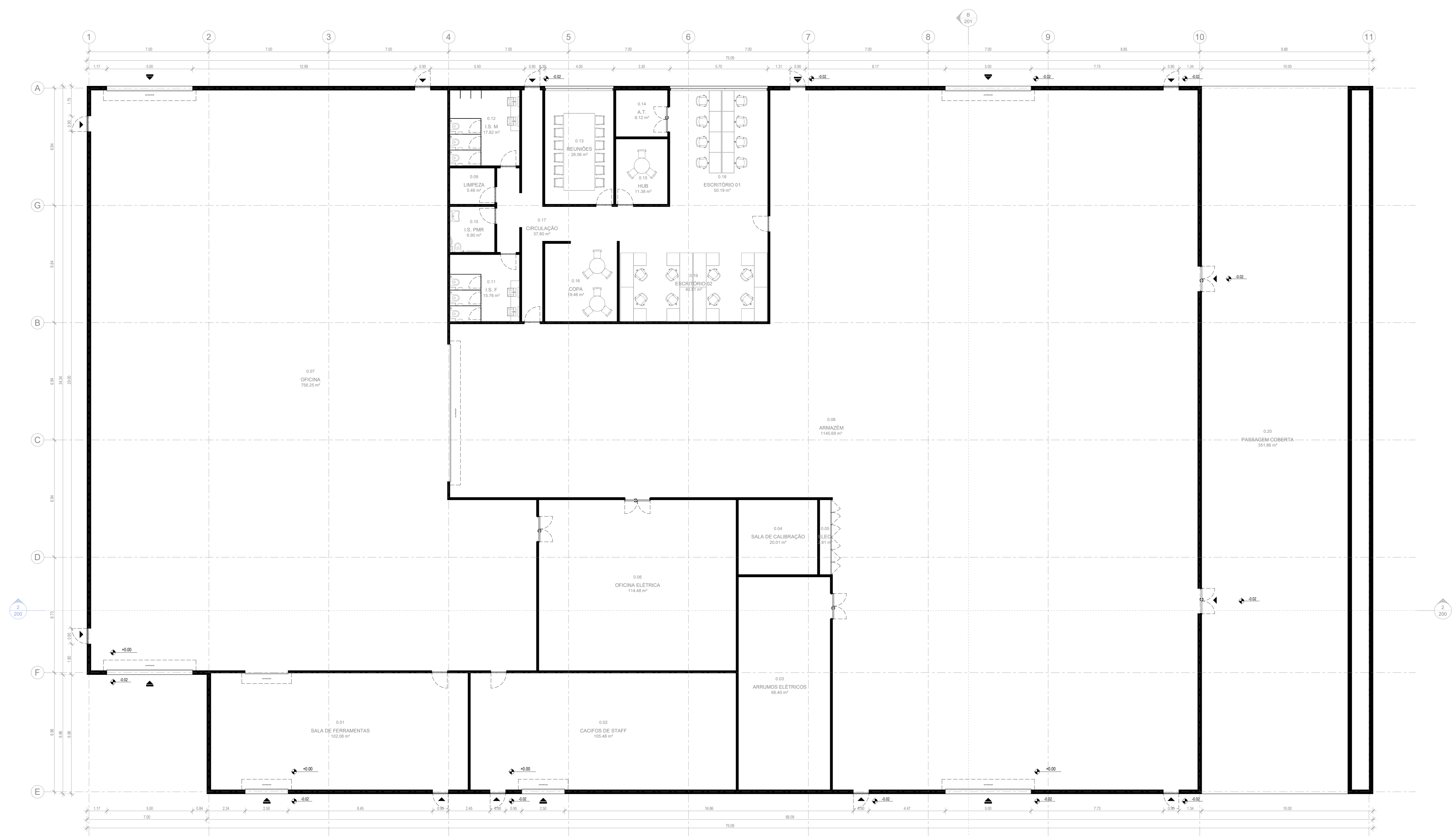
PLANTA - NÍVEL 00 1 : 100