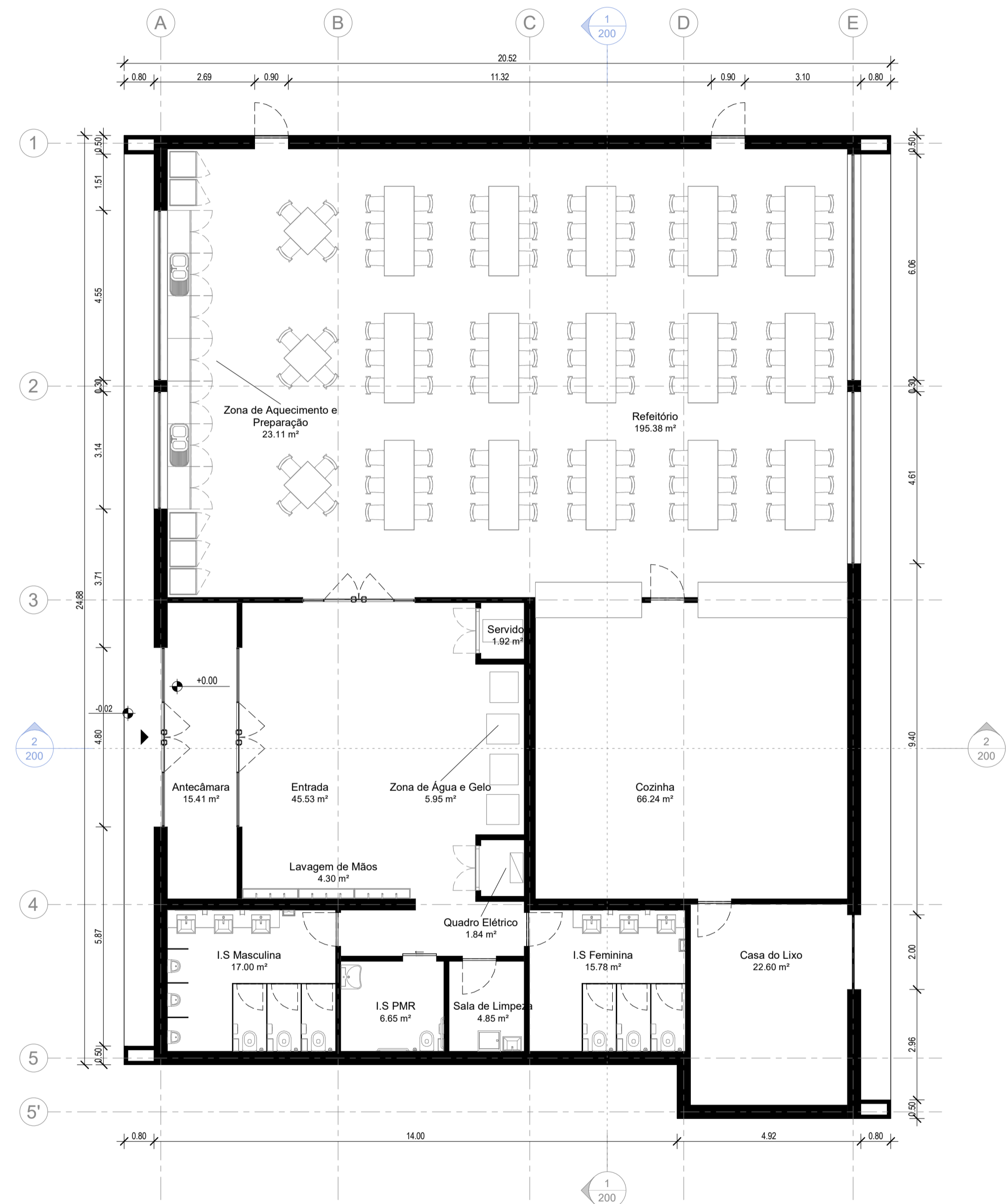
PLANTA - NÍVEL 00 1 : 100