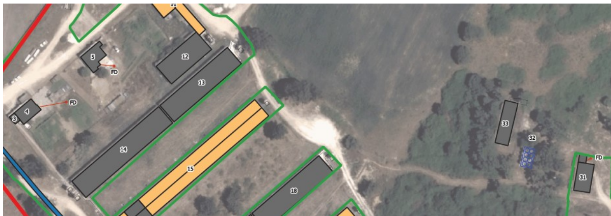
Figura 1 – Localização do sistema de tratamento de águas residuais domésticas – Fossas Séptica com Poço Absorvente (FD)