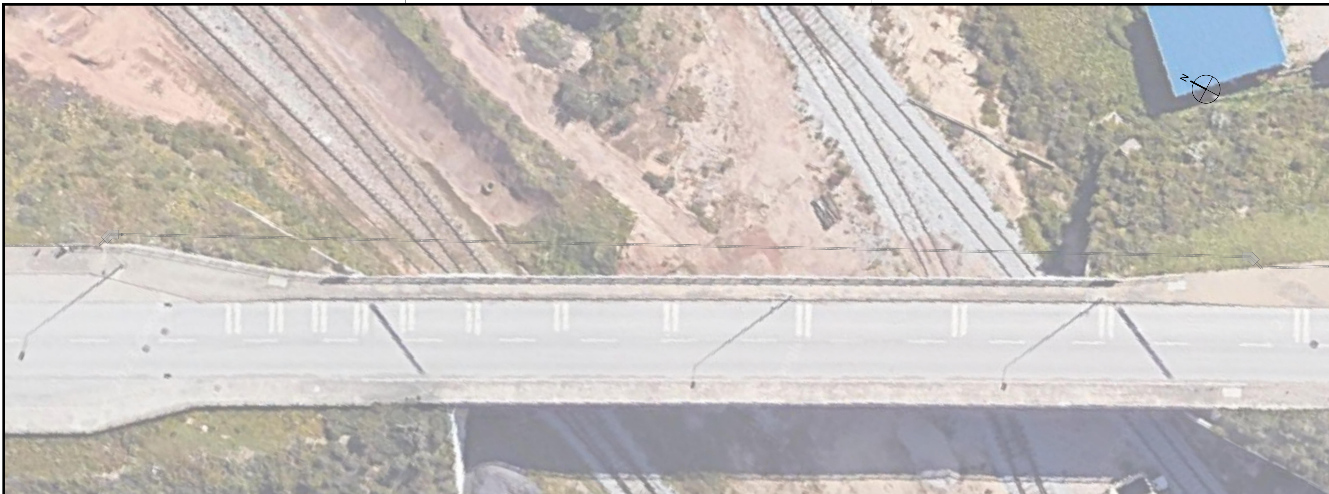
PLANTA ESCALA 1:200