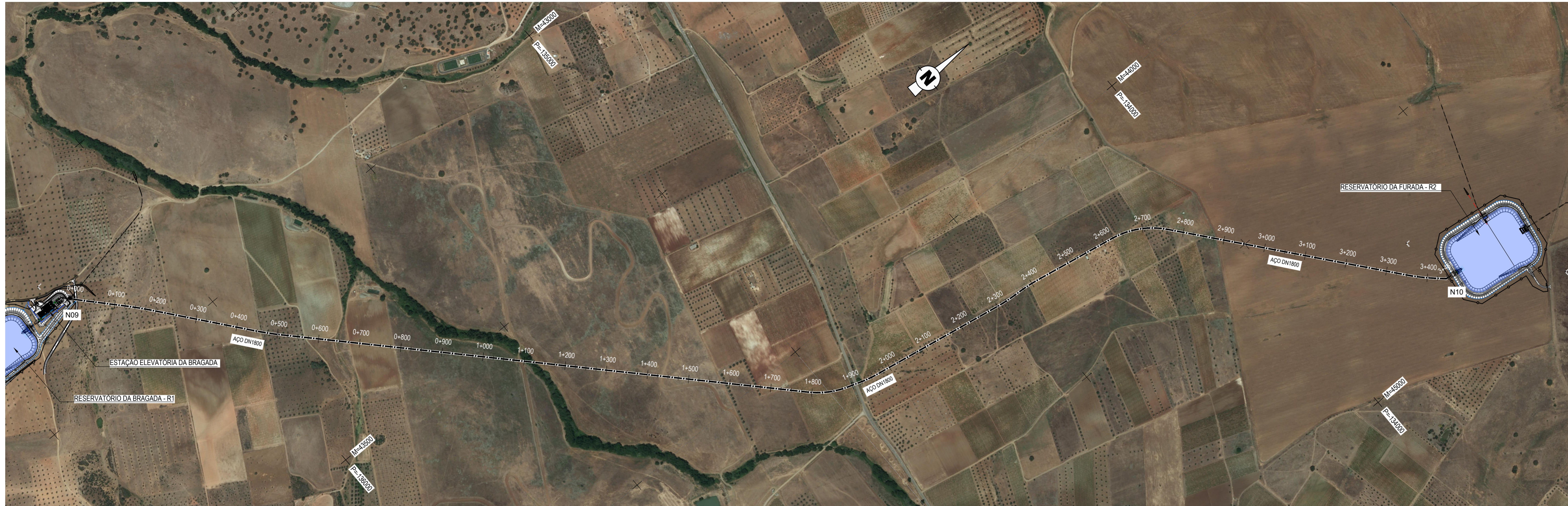
PLANTA Esc. 1:5000