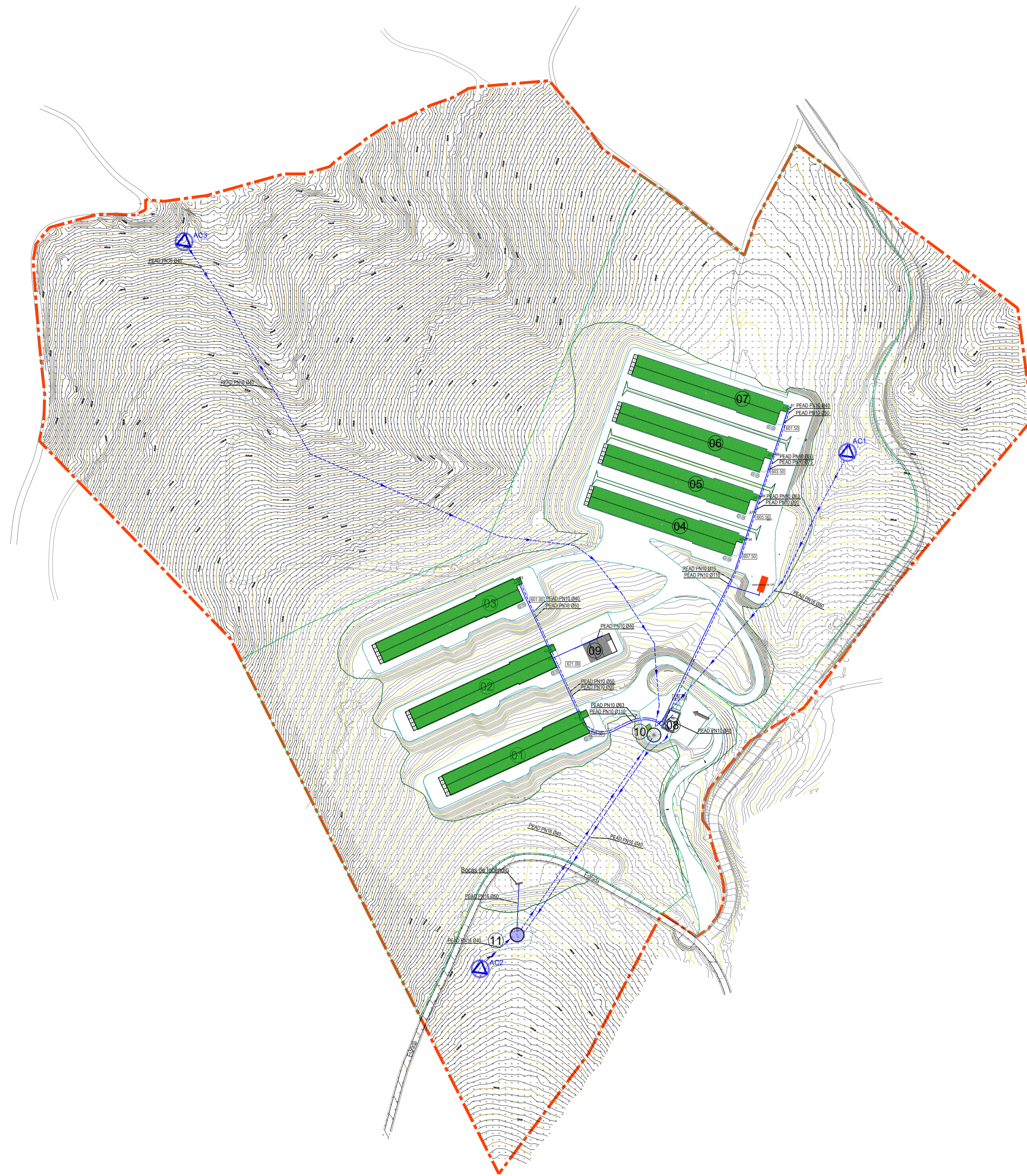
ESQUEMA DO SISTEMA DE BOMBAGEM E DESINFECÇÃO DA ÁGUA RESERVATÓRIO 1