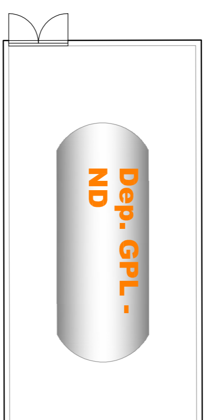
Planta de GPL Escala 1:100