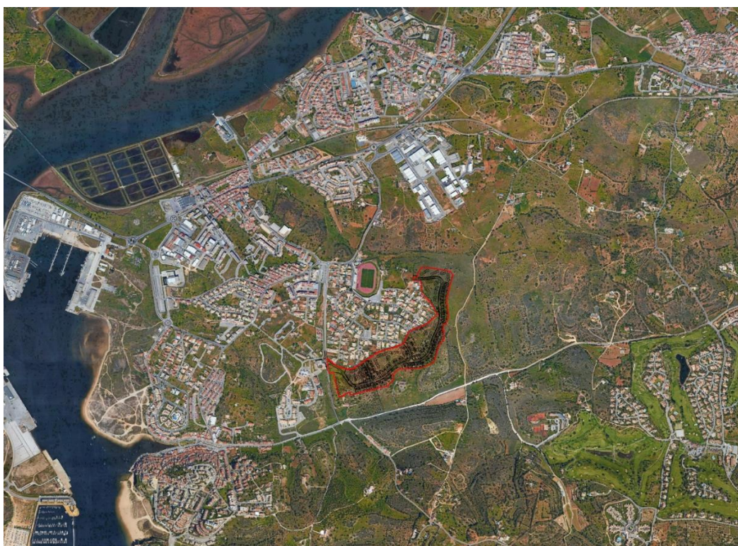
Mapa 1 - Enquadramento da área em estudo.

A área em análise insere-se numa realidade urbana residencial de transição para áreas rurais. Esta irá contribuir em conjunto com as áreas urbanas adjacentes para a emissão de GEE, produção de resíduos e consumos de energia e água. Contudo, a escala e os métodos construtivos modernos, não é crível que o seu contributo cumulativo seja relevante.