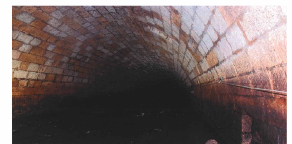
Fotografia 1 retirada no interior do Caneiro de Alcântara s / escala