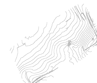
Altimetria 2 x 2 m