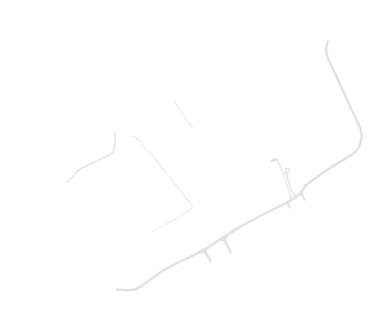
Rede viária e outras construções lineares