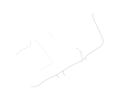
Rede viária e outras construções lineares