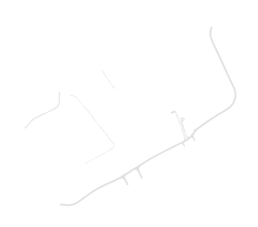
Rede viária e outras construções lineares