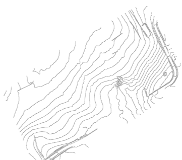
Altimetria 2 x 2 m