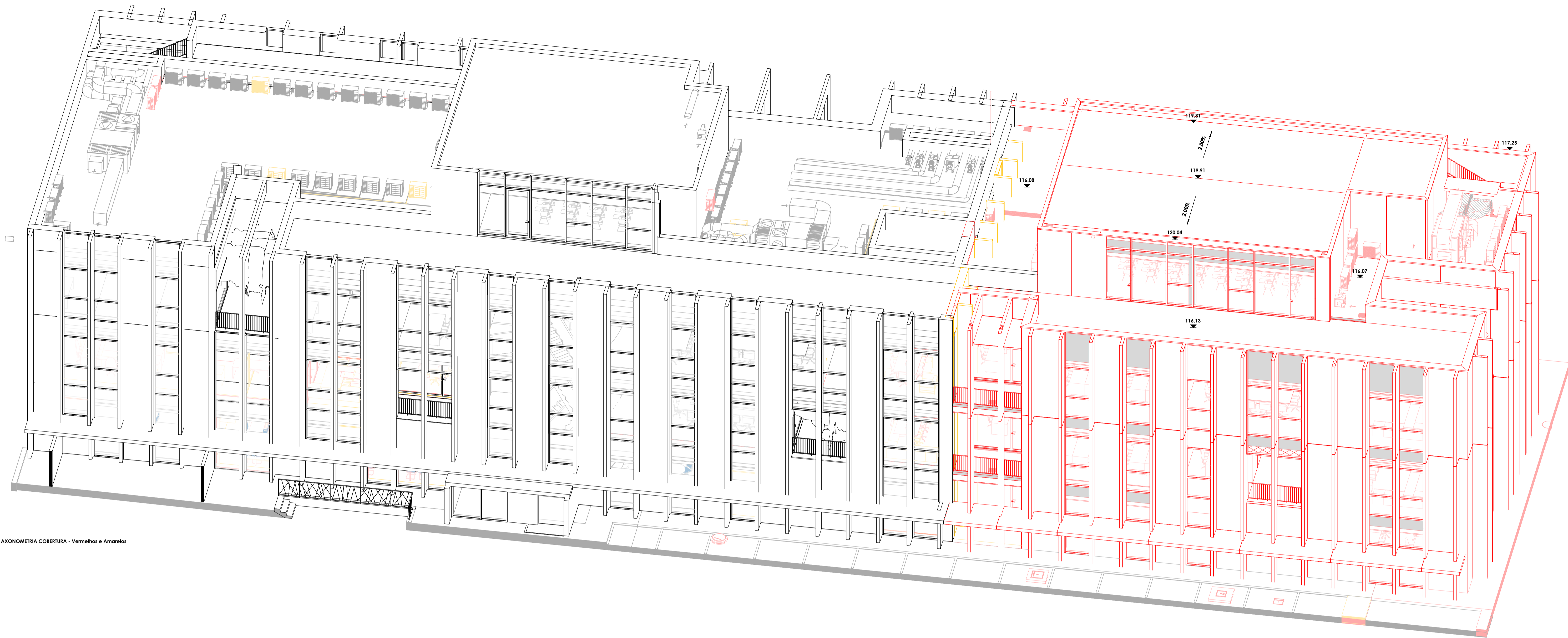
AXONOMETRIA COBERTURA - Vermelhos e Amarelos

LEGENDA - Vermelhos e Amarelos ■ A construir ■ A demolir ■ Existente