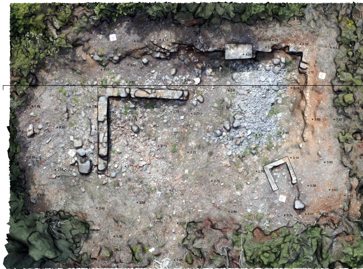
PLANTA DE COBERTURA