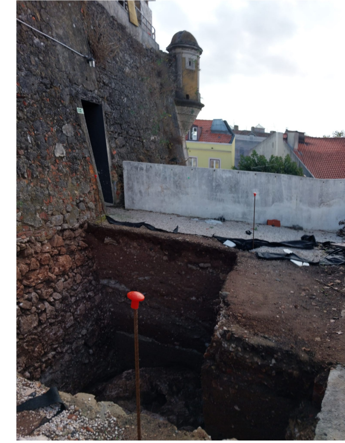
FOTOGRAFIA 2 - MURALHA DO BALUARTE E GUARIDA INTERFERÊNCIA Nº 381b s / escala