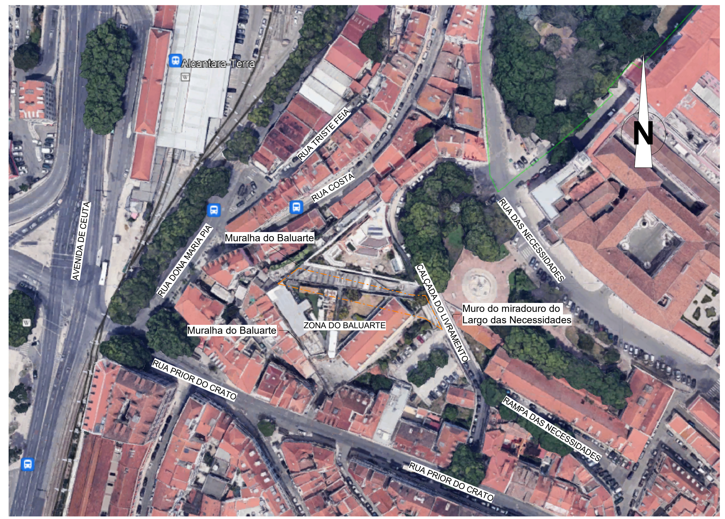
PLANTA DE LOCALIZAÇÃO GOOGLE EARTH s / escala