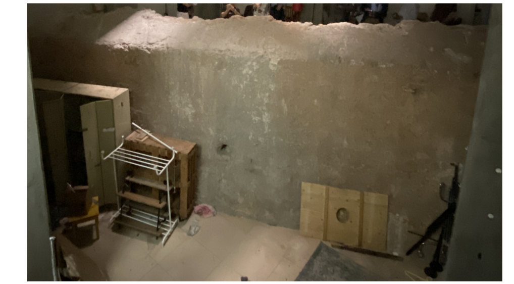
FOTOGRAFIA 4 - MURALHA FILIPINA/ESPANHOLA INTERFERÊNCIA Nº 381c s / escala