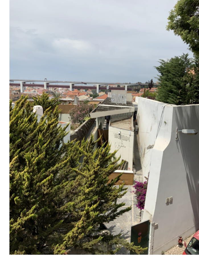
FOTOGRAFIA 1 - MURALHA DO BALUARTE INTERFERÊNCIA Nº 384 s / escala