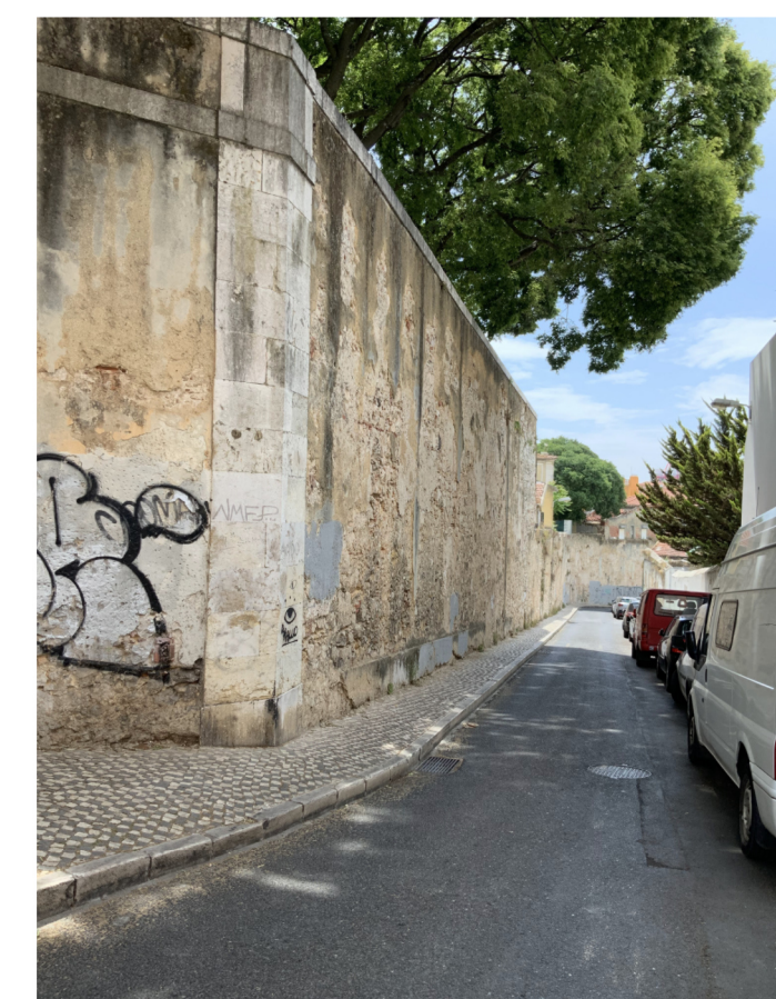
FOTOGRAFIA 3 - MURO DO MIRADOURO DO LARGO DAS NECESSIDADES INTERFERÊNCIA Nº 385 s / escala