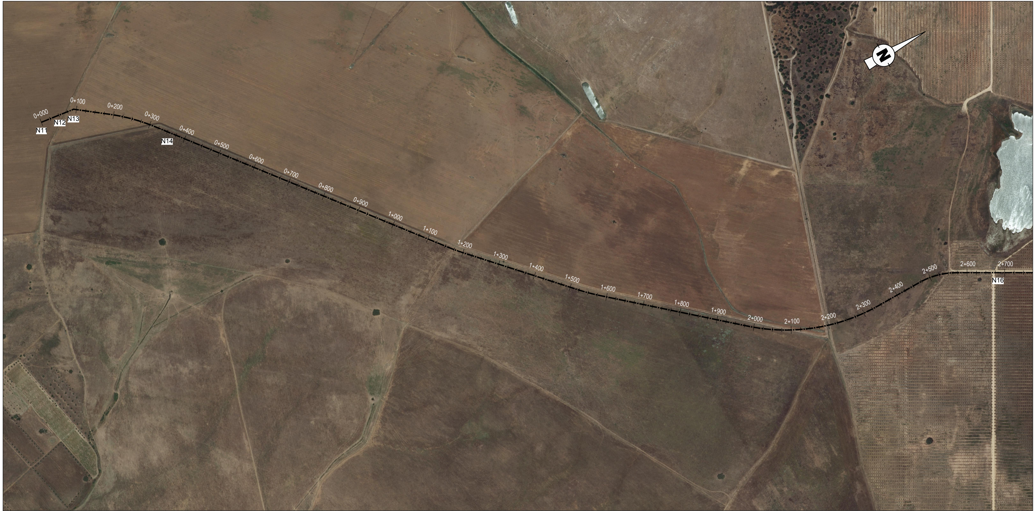
PLANTA Esc: 1:5000