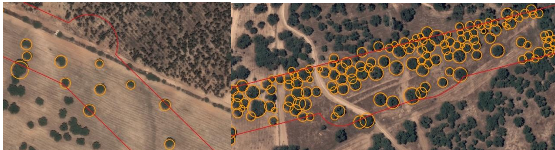
Figura 2 – Exemplo de aplicação do delineamento de copas com recurso a ortofotomapa