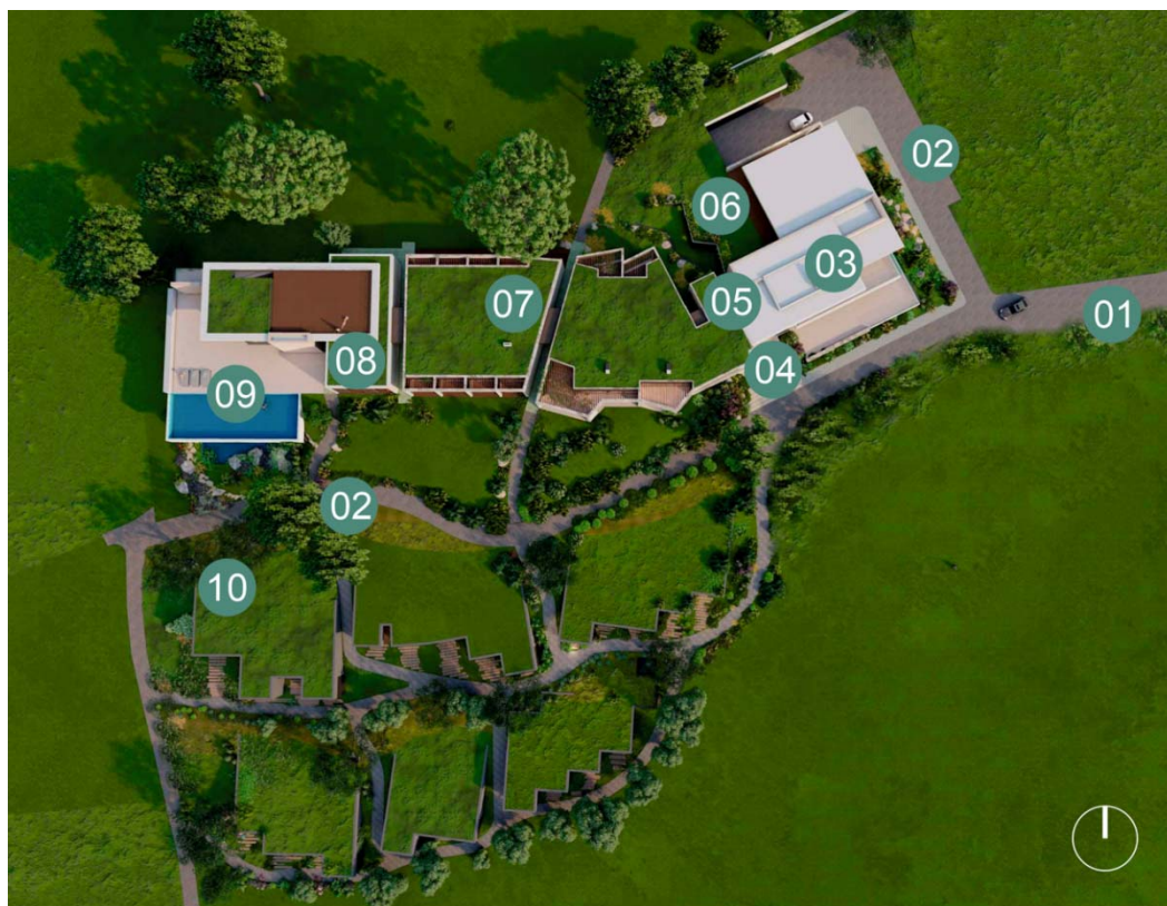
Figura 3 - Planta esquemática do programa de utilização das edificações e áreas envolventes.