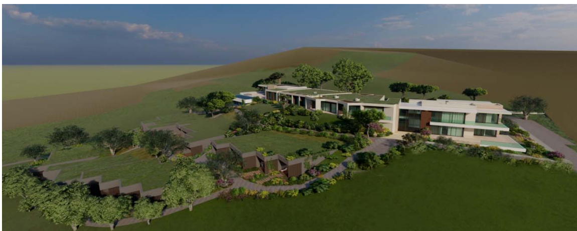
Figura 4 - Vista geral do Empreendimento Turístico.

O acesso ao empreendimento será feito pela rede viária existente, designadamente pelo chamado Caminho de S. Vicente. Está prevista a deslocalização de um troço deste caminho para uma extrema da propriedade, garantindo o seu uso público, sem necessitar de dividir a propriedade. Esse novo troço, com uma área de 852 m 2 , integra a via asfaltadas e a valeta de betão de ambos os lados.