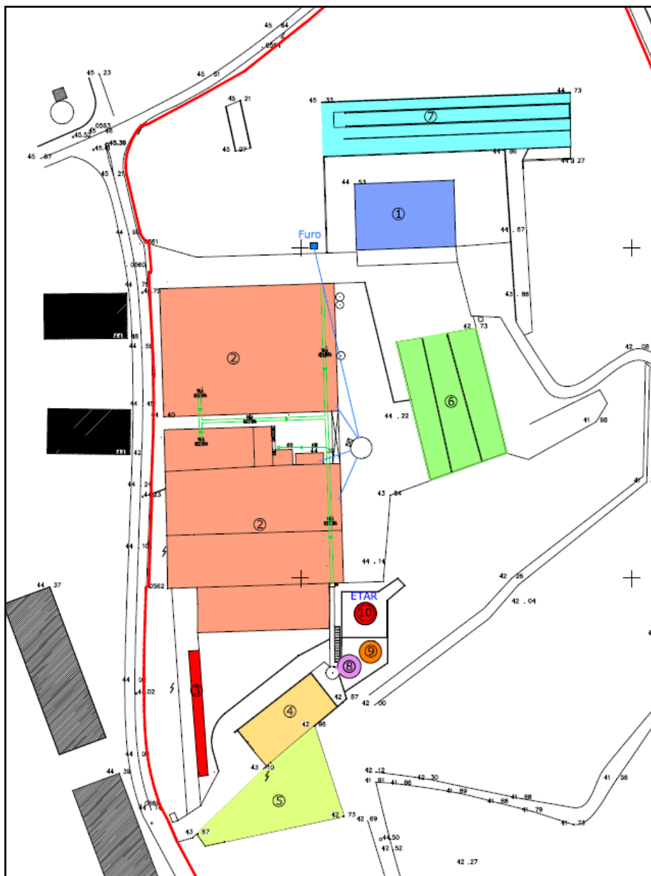
Figura 1. – Esquema de implantação da Área Edificada 2 (adaptado Peça Desenhada n.º 2)