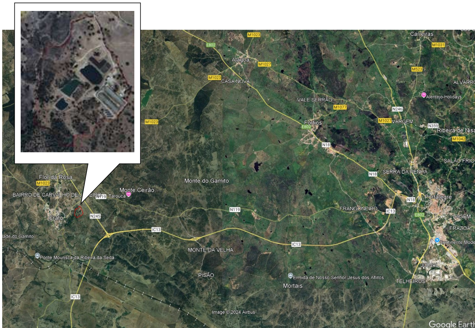
Figura 2- Enquadramento local e acesso à Exploração Pecuária de Cabrins.