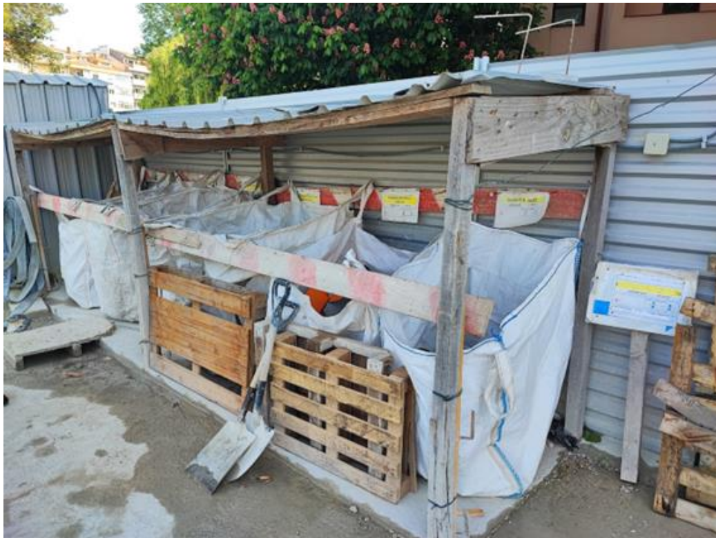
Figura 3 - Exemplo de boas práticas num parque de resíduos

Na figura 3 podemos observar um local de armazenamento temporário de resíduos não perigosos que serve como exemplo do que se pretende dotar a exploração. Os resíduos estão acondicionados em big bags em parque coberto com identificação LER.