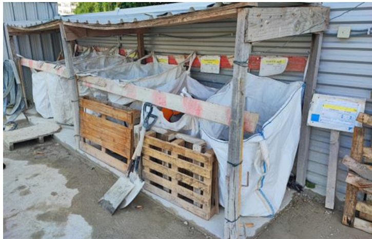
Figura 3 - Exemplo de boas práticas num parque de resíduos

Na figura 3 podemos observar um local de armazenamento temporário de resíduos não perigosos que serve como exemplo do que se pretende dotar a exploração. Os resíduos estão acondicionados em big bags em parque coberto com identificação LER.