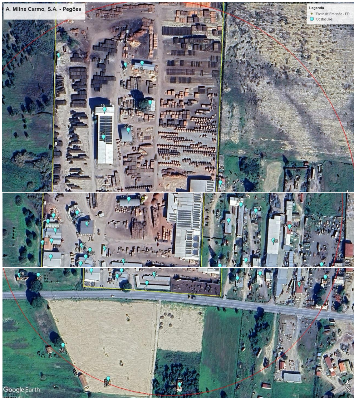
Figura 2 - Representação pormenorizada dos obstáculos localizados num raio de 300 metros

São considerados obstáculos situados na vizinhança da fonte de emissão (incluindo o edifício de implantação da chaminé) e que obedeça, simultaneamente, às seguintes condições: