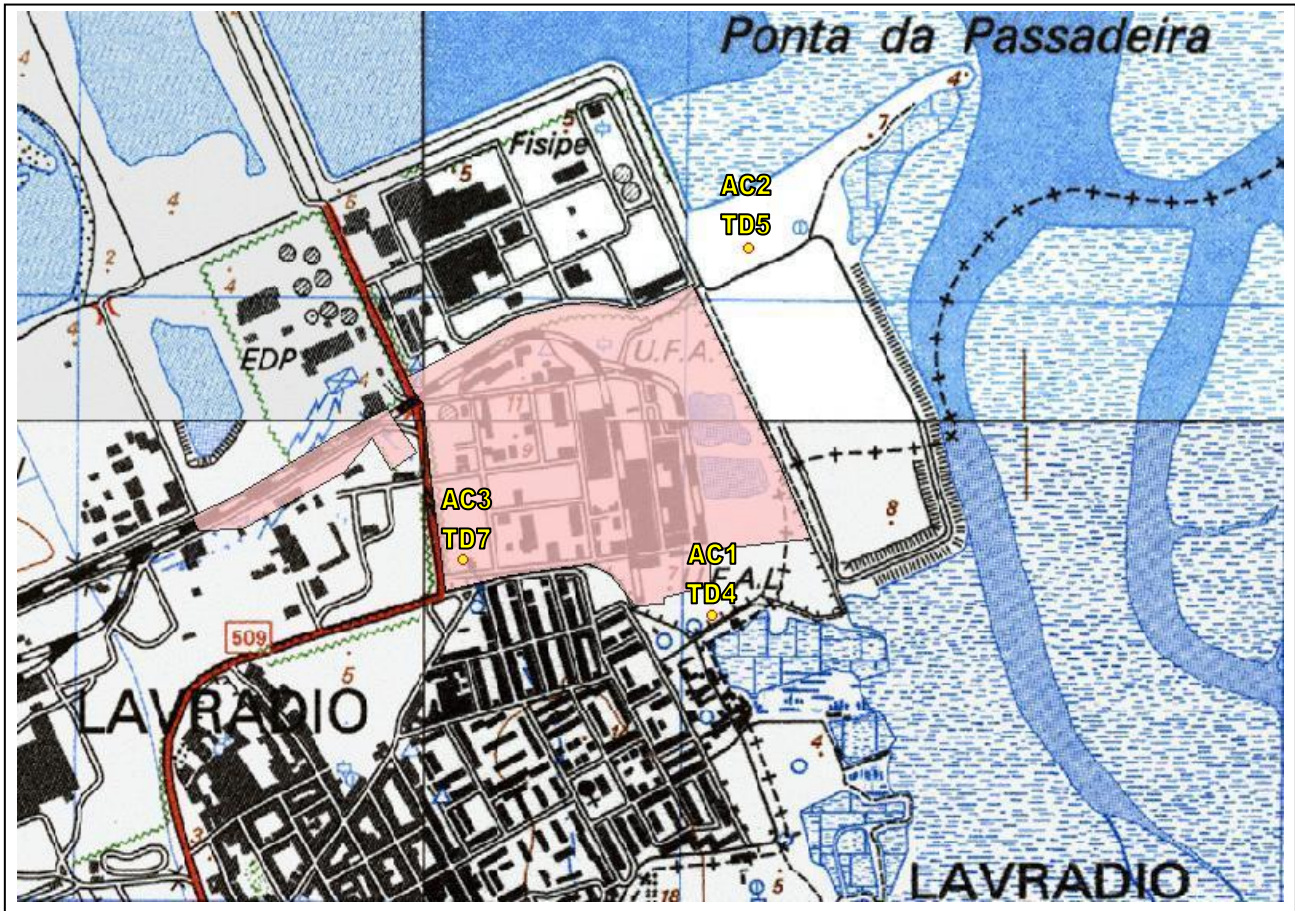
Figura 2.2.2 - Localização dos furos de captação de águas subterrâneas, extracto das cartas militares 1:25 000 n.º:431, 432, 442 e 443 (Nota: o desenho não se encontra à escala)

Na figura seguinte é possível observar a localização dos furos de captação de águas subterrâneas utilizados na instalação como abastecimento de água para uso industrial. Encontra-se assinalada a área ocupada pela instalação e os furos encontram-se identificados com a designação interna e respectivo código PCIP.