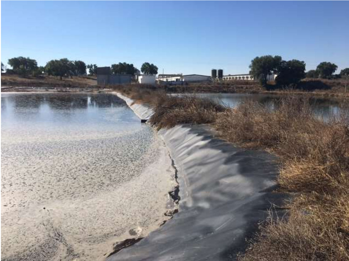
2ª e 3ª Lagoa