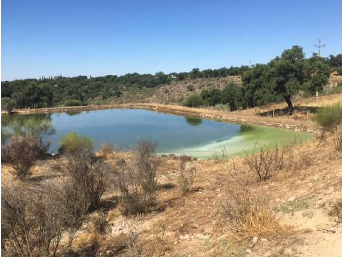
5ª Lagoa (DESATIVADA)