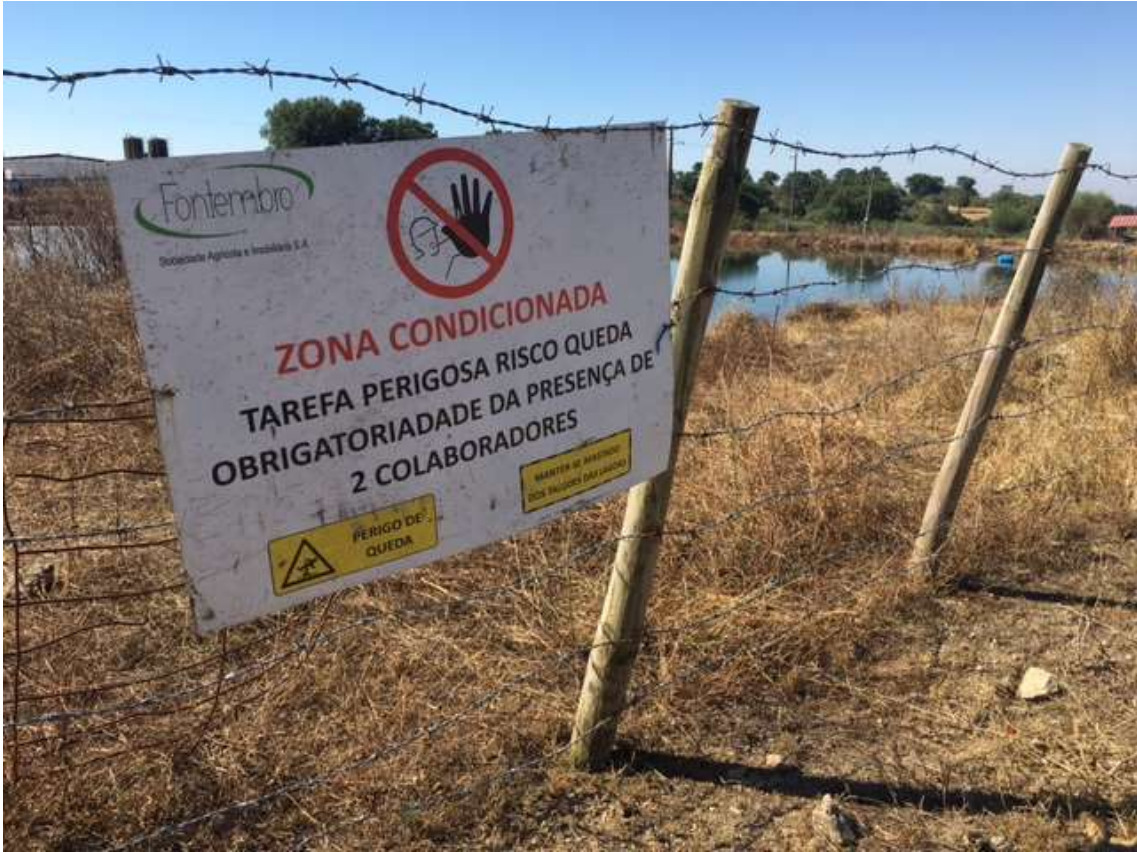
Vedação das lagoas