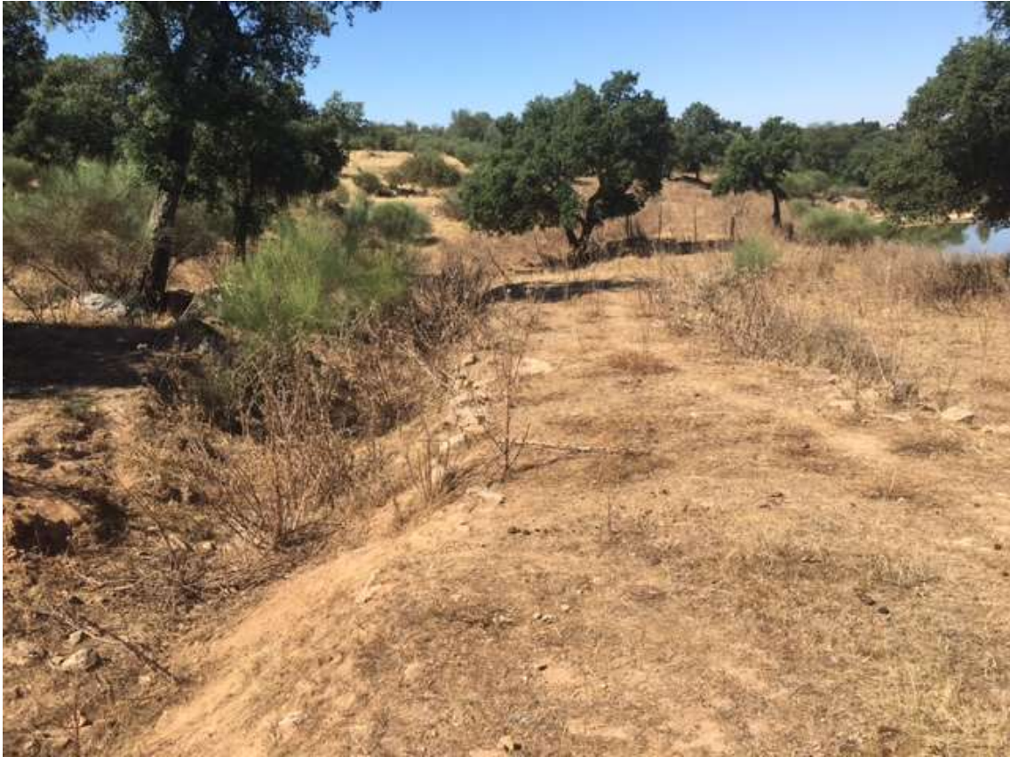
Linha de água