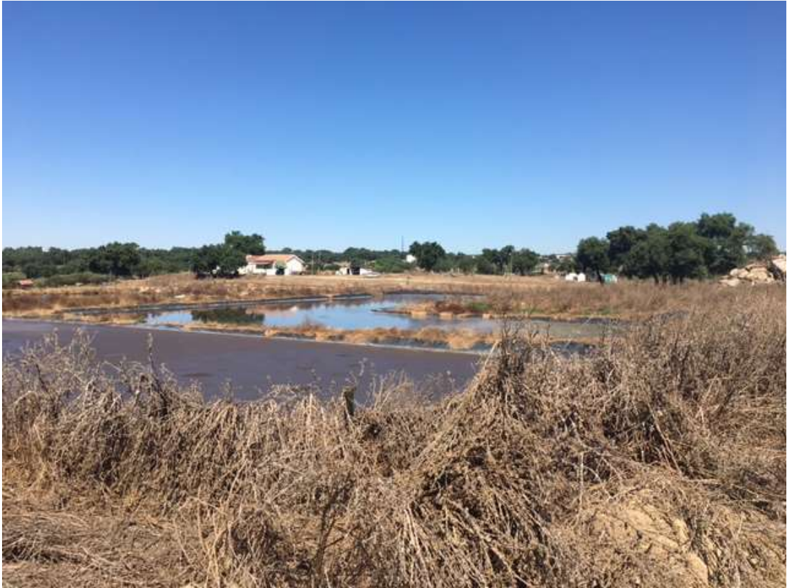
1ª e 2ª lagoa