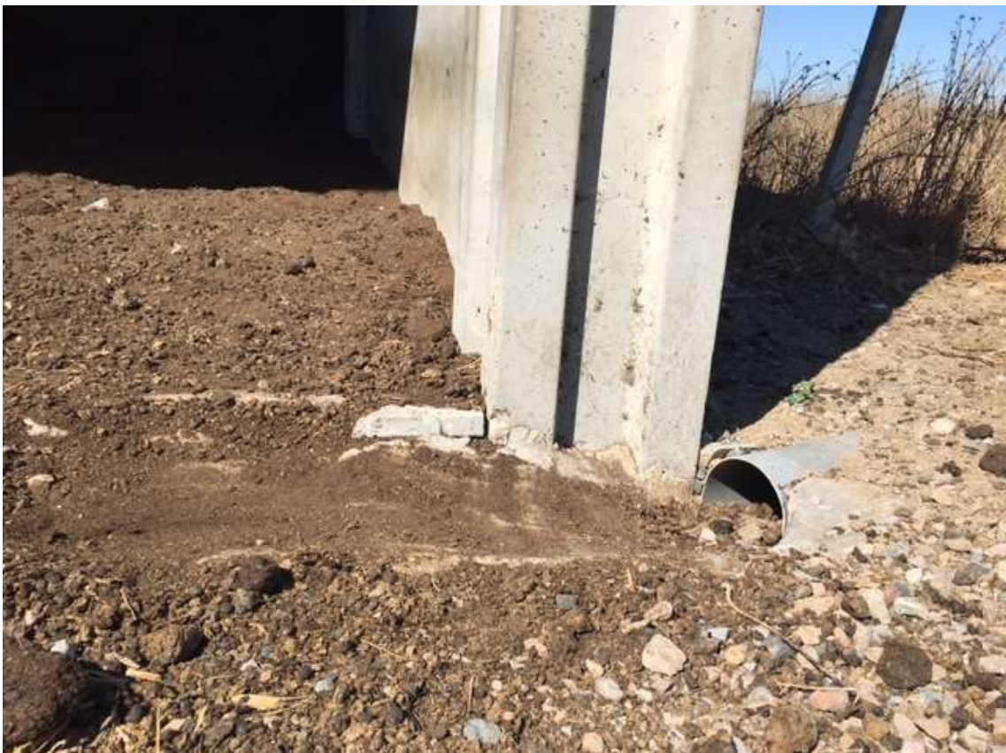
Escoamento da niteira para o poço de receção